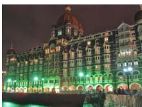
Figur 9. Taj Mahal-hotellet.

Nästa ställe som terroristerna anföll var Leopold Café & Bar, som besöks av såväl utlänningar som indier. Cafeét och baren är 130 år gammal. Terroristerna hette Hafiz Arshad och Nazir, de kom in och började skjuta och en granat exploderade. Tio personer dog och många skadades i attacken på cafeét. (Haberfeld & von Hassel 2009, 322; NY Times 2009.)