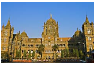
Figur 6. CST järnvägsstation.

Terroristerna anlände till södra Mumbai på kvällen den 26 november. De åkte sedan med taxi till de olika platserna dit de skulle. (NY Times 2009.) Efteråt dödades taxichaufförerna. Ministry of External Affairs India, 2009 (i verket Haberkfeld & von Hassel 2009, 320.)