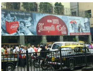
Figur 8. Leopold Café & Bar. (Images Google 2009.)

man se en bild på Kasab. (NY Times 2009.)