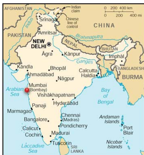
Figur 3. Mumbais läge. (Images Google 2010a.)

Som man kan se från kartan, är Mumbai beläget i västra Indien, intill Arabiska havet.