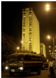
Figur 10. Oberoi Trident-hotellet.

Från det första samtalet, kan man se att terroristerna ville ha gisslan som hade makt och betydelse i Indien, så att terroristerna skulle kunna få ut vad som helst som de ville ha ut av Indien. Från det andra samtalet kan man se, att "chefen" vill få terroristen än en gång att tro att han gör dådet i Allahs namn, och få honom att göra sitt bästa, för att han har redan lämnat allt bakom sig.