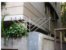
Figur 11. Nariman House.