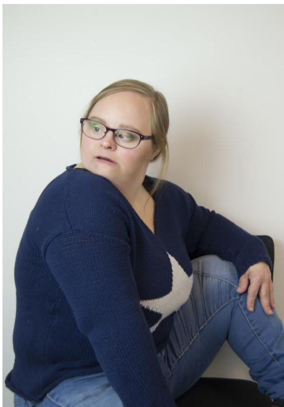
Figur 3: Top modell