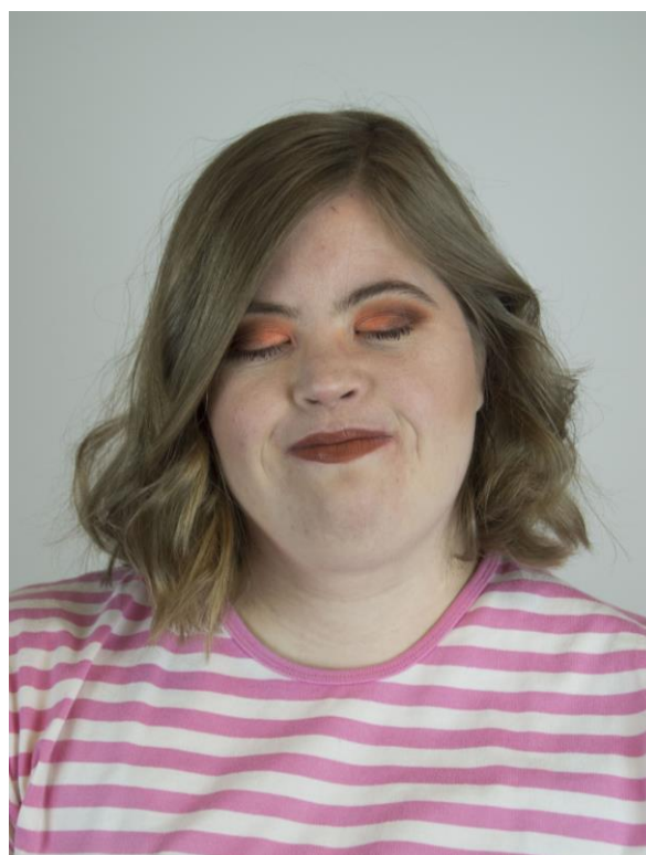
Figur 2: 50 shades of Orange