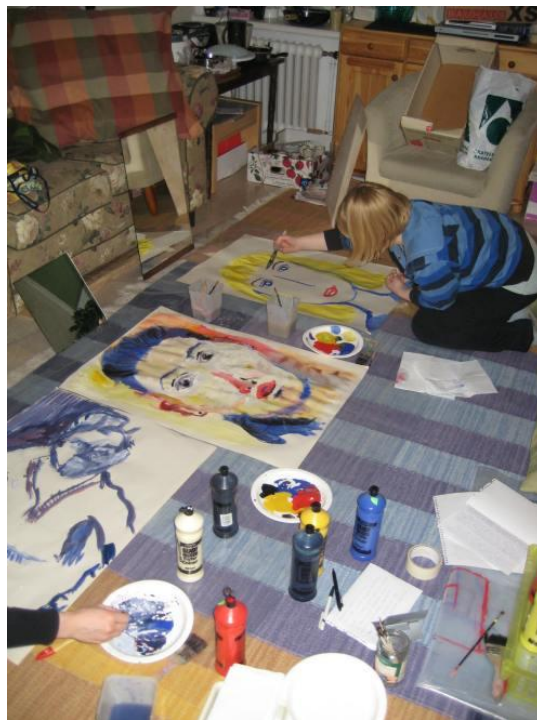
Kuva 3 Työskentelyä Tyttöjen Talon Omakuva-työpajassa.

Tampereen Tyttöjen Talolla sukupuolisensitiivinen tyttötyö merkitsee myös uusien työtapojen kehittämistä. Talolla hyödynnetään tyttötyön menetelmiä muun muassa tyttöjen identiteetin vahvistamisessa, kehonhallinnan, itsetuntemuksen sekä tunneilmaisun tukemisessa (Tampereen Tyttöjen Talon vihko: Sukupuolisensitiivisen tyttöryhmän ohjaaminen n.d.). Omakuva-työpaja vastaa uudenlaisen työtavan kokeilun ja kehittämisen haasteeseen. Omakuva-työpajan lähtökohdat, itsetuntemuksen lisääminen, oman itsen peilaaminen sekä kuvallinen ja sanallinen ilmaisu myötäilevät sukupuolisensitiivisiä tavoitteita.