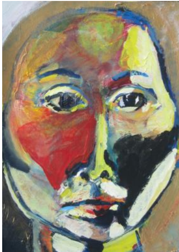
Kuva 1 Omakuva voi olla oman sisäisen maailman opas ja tulkki.

Tutkin omakuvien tekemistä ja niistä keskustelemista. Peilaan omaa aiempaa kokemusta sekä keräämääni aineistoa lähdeaineistooni, pohdiskellen ja mietiskellen. Tutkimukseni tarkoitus on kuvailla, mitä Omakuva-työpajassa Tampereen Tyttöjen Talolla tapahtui. Mitä kuvista puhuttiin, mitä ryhmän sisällä tapahtui? Lopussa päädyn pohtimaan, minkälaisia päätelmiä voi tulosten perusteella tehdä ja miten omakuvien tekemistä voisi jatkossa käyttää.