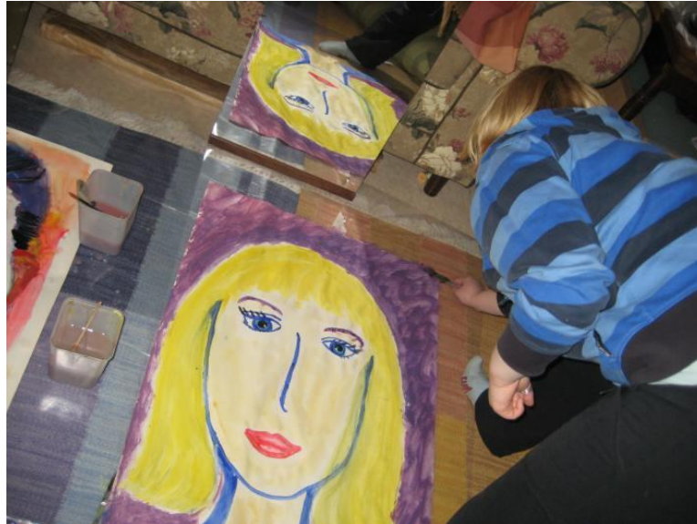
Kuva 4 Taidetyöskentelyä ja peilaamista.

Omakekuva-työpajassa syntyneissä kuvissa osallistujat saavat itse määritellä itsensä. Jokaisella on valta omaan kuvaansa. Jokainen saa kirjoittaa siitä mitä tahansa ja kertoa siitä sen, mitä itse haluaa. Näin voi kehittää tietoisuutta omasta itsestä, mutta myös siitä, että vain itsellä on valta päättää omasta kuvastaan.