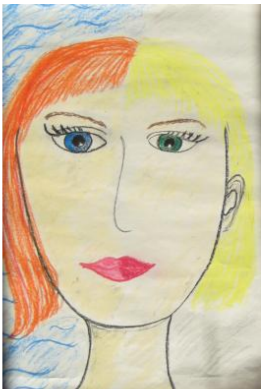
Kuva 25 Ellan omakuva 24.2. eli viimeisellä työpajakerralla.