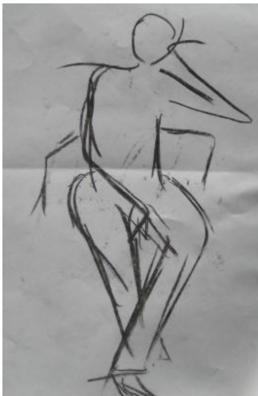
Kuva 8 Ohjaajan eli minun croque.