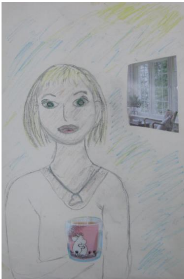
Kuva 12 Ellan omakuva 3.2. ”Kirjoitin lukiassa äidinkiellentunnilla semmosen runon, että määhaluaisin oppia nauttimaan hetkestä jolloin aurinko valaisee mun aamuteepöytää.”