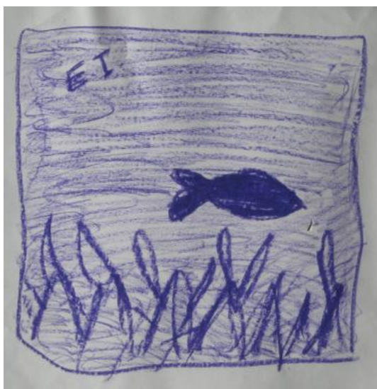
Kuva 17 Fahmidan toisen työpajakerran lämmittelytehtävä.