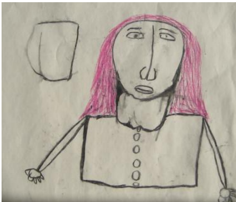
Kuva 11 Ikranin omakuva 3.2. eli Omakeuva-työpajan ensimmäisellä kerralla. ”Tukka on hyvä.”