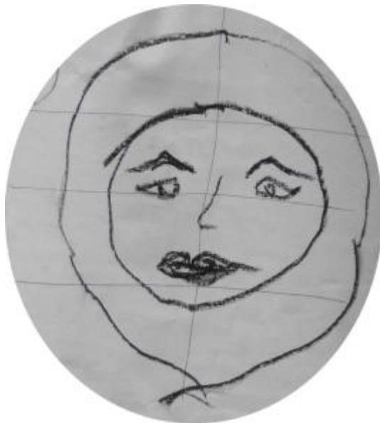
Kuva 21 Fahmidan omakuva vasemmalla kädellä 10.2. ”Mää oon nopee piirtään mää en oo tarkka missään.”