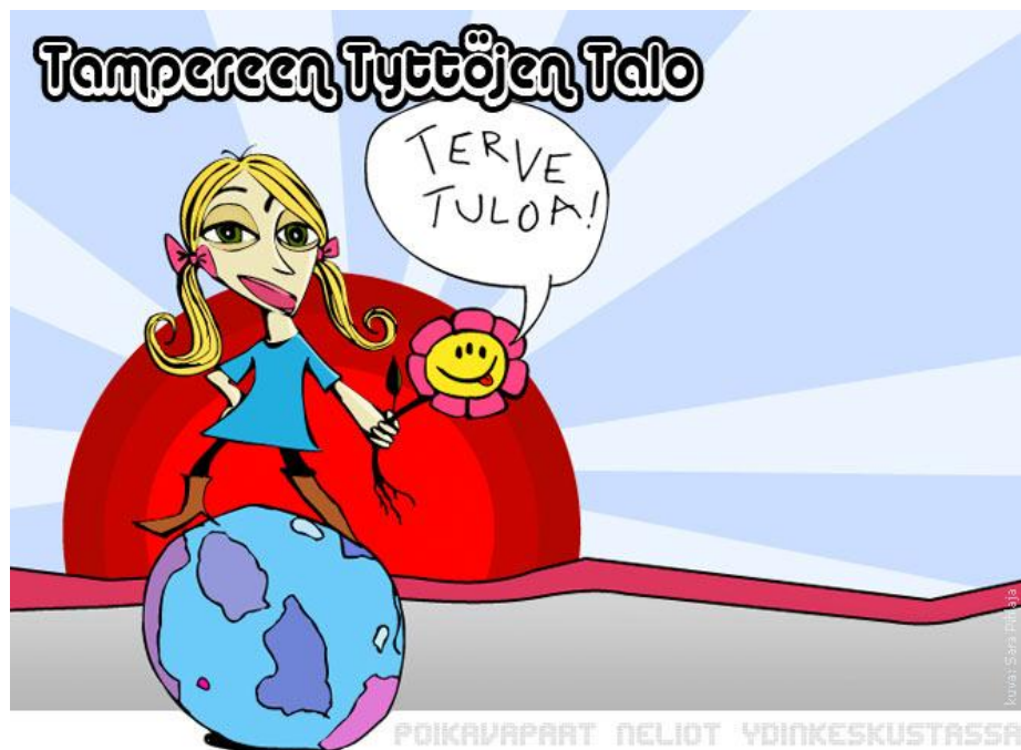
Kuva 2 Tampereen Tyttöjen Talon logo.

Etsiessäni syksyllä 2009 harjoittelu- ja opinnäytetyöpaikkaa mielenkiintoni heräsi Tampereen Tyttöjen Taloa kohtaan. Olin tutustumisharjoittelusani ollut Settlementti Naapurin Naisten kansainvälisessä tapaamispaikassa, Naistarissa. Ajatus harjoittelusta Tyttöjen Talolla jäi silloin kytemään mieleeni. Tyttöjen Talo tarjosi minulle mahdollisuuden sekä syventävän harjoittelun että opinnäytetyön tekemiseen.