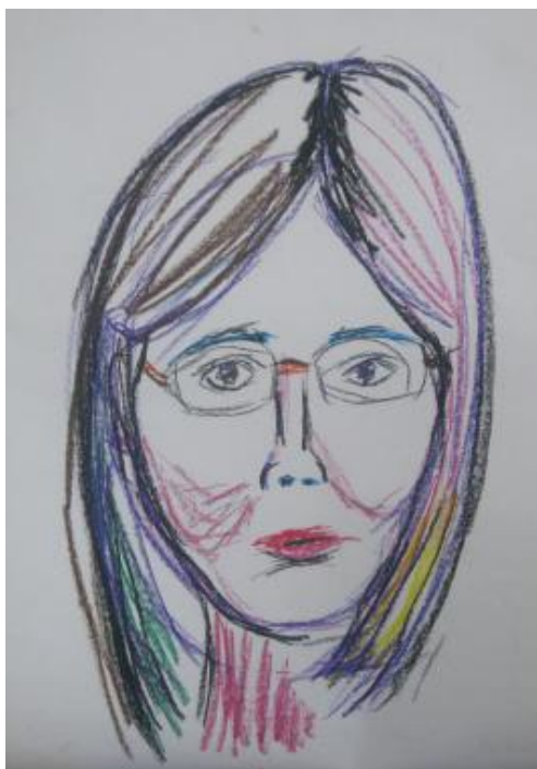
Kuva 14 Minun omakuva 3.2. ”Tein itselleni ekaa kertaa silmälasit.”