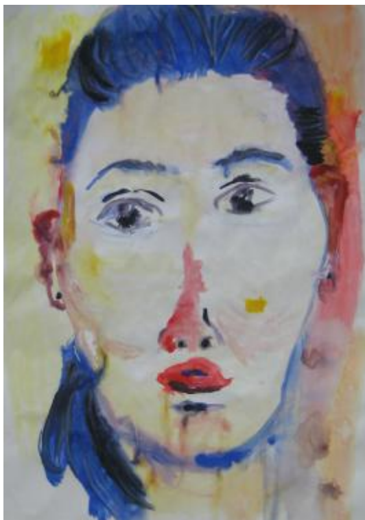
Kuva 24 Minun omakuva 17.2. ”Joo et mä niinku hallitsen jotain.”