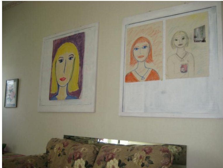
Kuva 6 Kuvat esillä