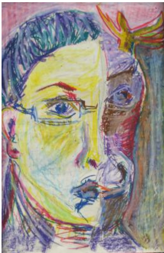
Kuva 26 Minun omakuva 24.2.