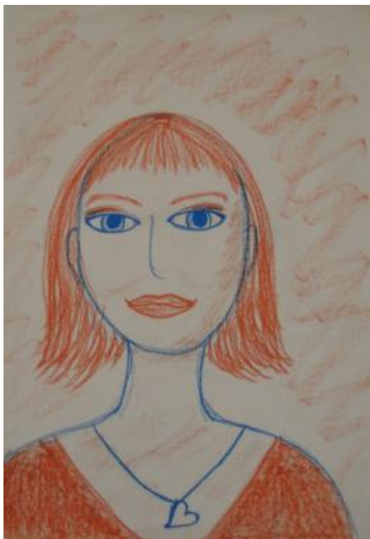
Kuva 18 Ellan omakuva 10.2. eli toisella työpajakerralla. ”Noi silmät, mun mielestä ne on vähän liian isot ja jotenki siinä on kauheen tiukka katse.”