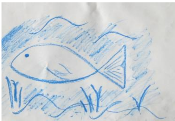
Kuva 16 Ellan toisen työpajakerran kuvallinen lämmittelytehtävä.