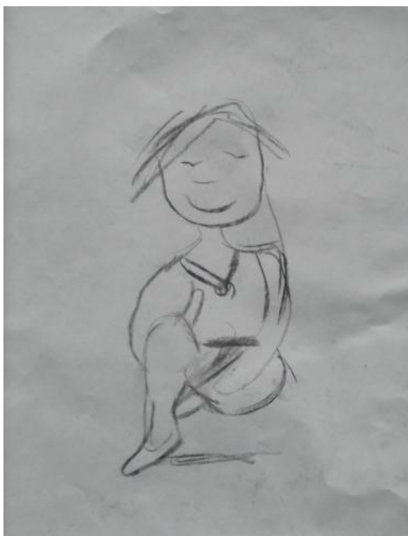
Kuva 9 Ellan croque. Omakeuva-työpajan ensimmäisen kerran kuvatyöskentelyn lämmittelytehtävä.