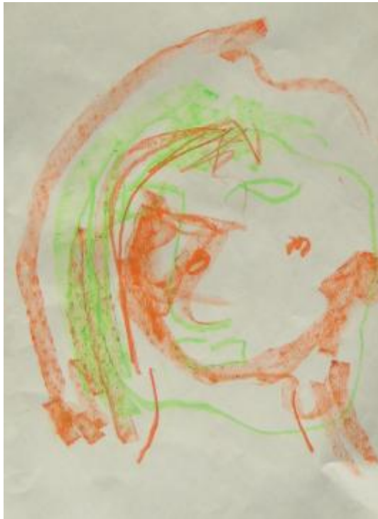
Kuva 5 Minun silmät kiinni tekemäni omakuva. Tämän tekemällä pyrin osoittamaan Saanalle vapautunutta suhtautumista kuvan tekemiseen.