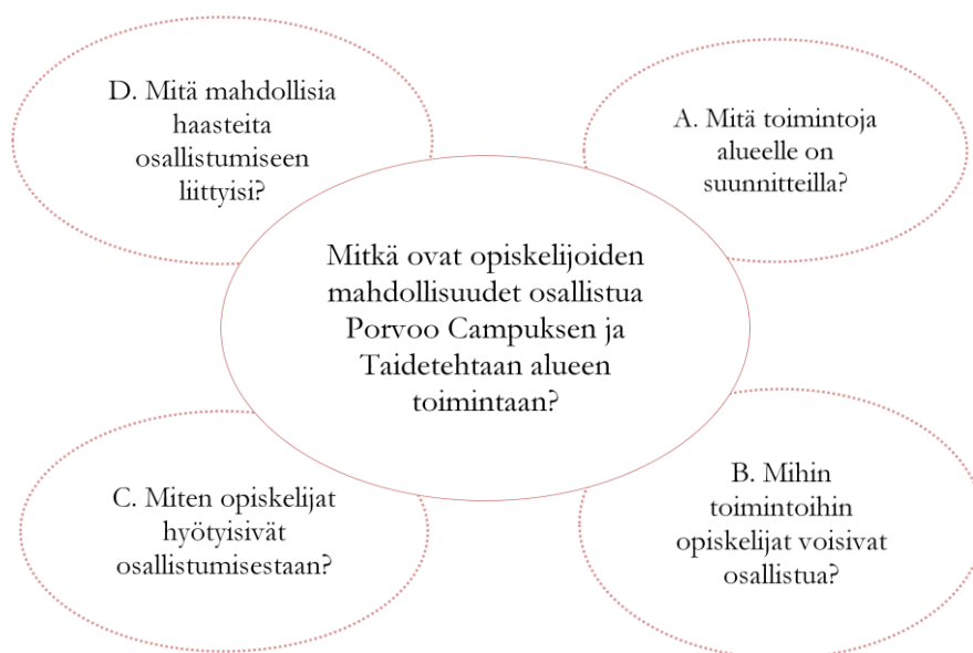
Kuvio.1 Tutkimusongelma ja ala-ongelmat

124.) Ensimmäisenä kartoitan yleisesti, mitä toimintoja alueelle ollaan suunnittelemassa. Mielestäni tämä kysymys luo pohjan tutkimusongelmalleni mutta samalla toimii perustana myös muille kysymyskokonaisuuksille. Kysymyksellä B eli mihin toimintoihin opiskelijat voisivat osallistua, pyrin kartoittamaan sitä, mitä opiskelijat alueella voisivat tehdä ja mihin toimintoihin he voisivat tuoda oman panoksensa. Kolmantena kohtana on kohta C, joka fokuoittuu tuomaan esille hyötynäkökulman; olisiko opiskelijoille hyötyä osallistumisesta ja jos olisi, niin mitä nämä hyödyt voisivat olla. Lopuksi kartoitan aiheeseen liittyvät haasteet, onko niitä ja jos on, niin mitä ne ovat.