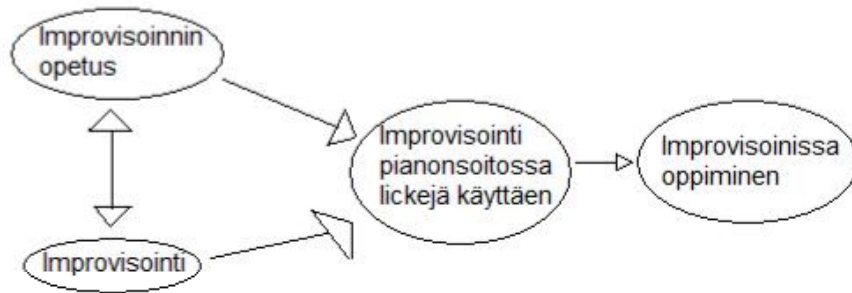
Kuva 4. Viitekehys pianonsoiton improvisoinnin oppimisesta blues-lickejä käyttäen.

Aiemmassa pohjassa oppilaiden pianonsoitossa saama improvisointiopetus ja heidän improvisointiharjoituksensa ovat vuorovaikutuksessa keskenään. Tältä pohjalta oppilaat tulevat harjoittelu- eli kokeiluvaiheeseen, jossa improvisoidaan lickejä käyttäen. Kokeiluvaiheen tulokset todetaan oppilaiden antamien haastatteluvastausten ja opettajan tekemien havaintojen pohjalta.