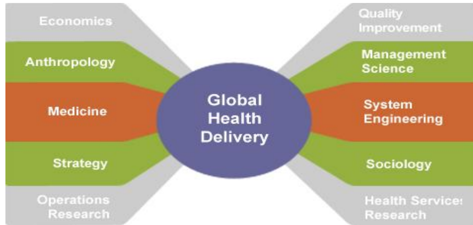
Kuva 2. Globaalien terveyden näkökulmia. (WHO 2007).

Terveyttä voidaan tutkia ja tarkastella ja mitata useiden eri tieteenalojen kautta. WHO:n tuottama kaavio (kuva 2) globaalien terveyden eri näkökulmista osoittaa havainnollisesti, miten monimuotoisesti terveyskäsitystä voidaan tutkia eri tieteenalojen kautta ja mitkä kaikki osa-alueet vaikuttavat terveyden tuottamiseen ja edistämiseen.