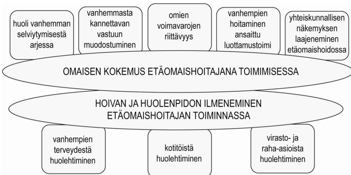
KUVIO 2. Sisällön analyysin pääluokat

Miten hoiva ja huolenpito ilmenivät vanhemman tukemisessa arjessa ja kotona selviytymisessä analyysin tuloksena syntyi kolme pääluokkaa. Pääluokat olivat vanhemman terveydestä huolehtiminen, kotitöistä huolehtiminen, virasto- ja raha-asioista huolehtiminen. Kuviossa 2 on esitetty kaaviomaisesti analyysin pohjalta syntyneet pääluokat. Kursivoidut tekstit ovat etäomaishoitajien suoria lainauksia ja samalla auttavat lukijaa tutkimustulosten ymmärtämisessä. Liitteessä 2 ja liitteessä 3 olevien suorien lainausten välissä kolme pistettä kuvaa haastateltavien käyttämiä sidesanoja, joilla ei ole merkitystä asian sisältöön.