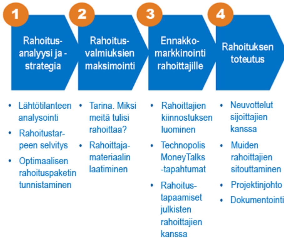
Kuva 3. Rahoitusprosessin kulku (Technopolis)

Kaavio havainnollistaa rahoitusprosessin kulkua yleisellä tasolla.