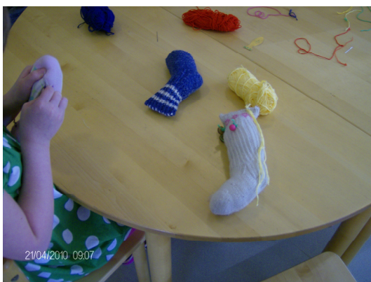
Täytettyjä villasukkia, joista omakuvat muodostuvat

Kun omakuvat ovat valmiita, voidaan istua piiriin ja kajauttaa ilmoille laulu. Oteetaan omakuvat syliin, laulunkajautusasento ja annetaan mennä! Tämän jälkeen omakuvat voidaan laittaa odottamaan Häppeningiä.