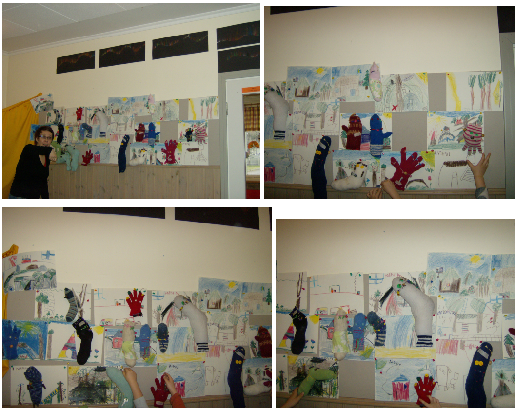
Salaiset maailmat ja omakuvat seinällä valmiina lasten leikkeihin