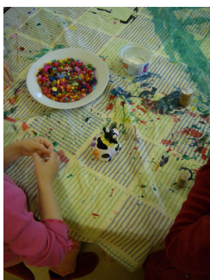
Oman museoesineen tekoa

Jokaisella museoesineellä on oma tarinansa. Kun lapsi on saanut oman esineensä valmiiksi, annetaan hänen kertoa tarina oman museoesineensä takaa. Tärkeää on, että tarinat ja esineet ovat lähekkäin toisiaan ja tarina keksitään lapsen omasta esineestä. Ohjaaja kirjoittaa tarinan ylös sanasta sanaan. Tarinan voi myöhemmin laittaa esille ryhmän yhteiseen pienoismuseoon.