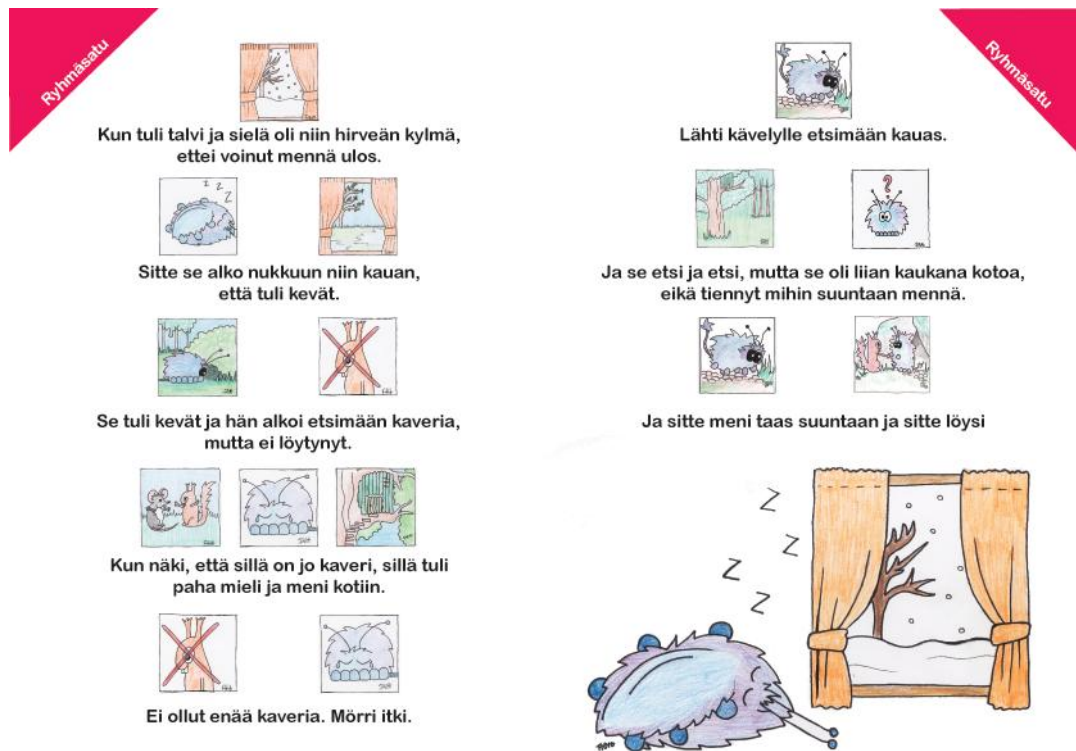
Kuva 2 sivumalli

symbolit ovat helposti luettavia, ymmärrettäviä ja soveltuvat erityislapsille. Myös paperi valinnalla voi vaikuttaa luettavuuteen. Se vaikuttaa esimerkiksi tekstin ja taustan väliseen suhteeseen. Tuotteen tulisi erottua edukseen muista vastaavanlaisista tuotteista yksilöllisyyden ja persoonallisuuden avulla. Mörri- satukirjaan suunnittelemani symbolit tekevät kirjasta ainutlaatuisen, koska ne ovat käsin tehtyjä ja vastaavat suoraan kirjan sisältöä. (Vilkka & Airaksinen 2003, 52-53.)