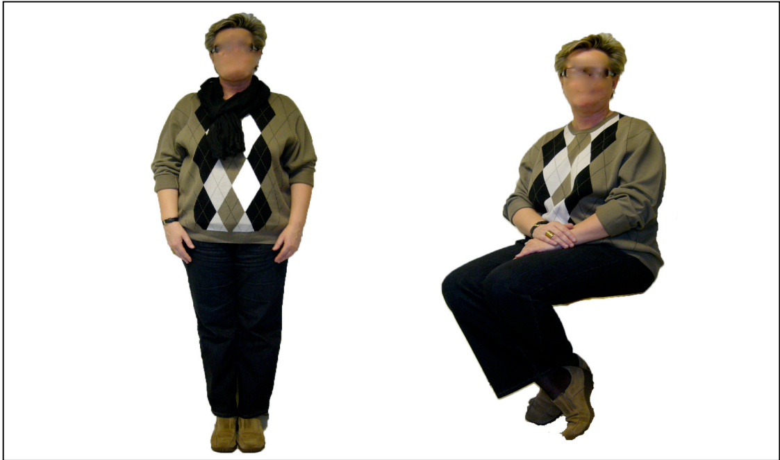
KUVIO 2. Kollaasi kahdesta positiosta. (Keronen 2010)

valitsin valaistuksen ja kokonaisuunnistumisen suhteen parhaimmat kuvat, joissa vaatteiden yksityiskohdat ja värit näkyivät selvästi. Näistä kuvista retusoin mallien kasvot anonymiteetin turvaamiseksi. Kaksi tehtyä esihaastattelua toivat esiin, että lisäarvoa materiaaliin ei tuottaisi se, että käytössä olisivat olleet kollaasit (kuvio 2), jossa malli seisoo ja istuu. Haastattelutilanne itsessään ei vaikuttanut informantille mielekkäältä suuren havaintoaineuksen takia.