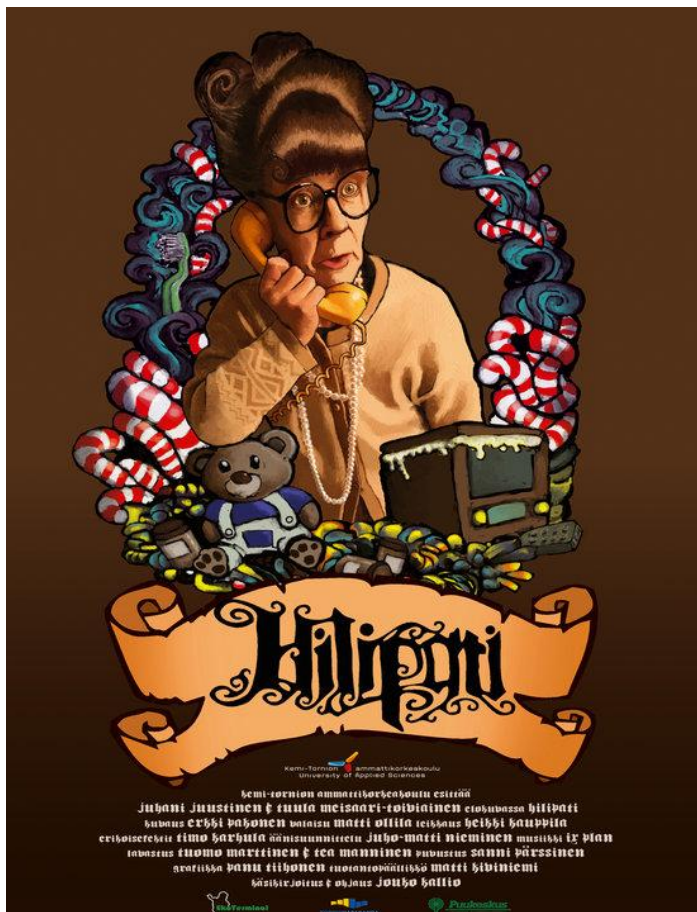
Kuva 5. Hilipati – elokuvajuliste

”Kuuletko Naurun?” -lyhytelokuvan ohjaajana toimi Matti Kiviniemi ja julisteen graafikkona toimi Tero Saikkonen. Lyhytelokuva ”Hilipatin” ohjasi Jouko Kallio ja julisteen graafikkona toimi Panu Tiihonen. Heidän yhteistyöllään syntyi mielestäni persoonalliset ja mielenkiintoa herättävät elokuvajulisteet. ”Kuuletko naurun?” -elokuvajuliste muodostuu pienistä paloista ja useasta kuvasta, kun taas Hilipati- elokuvajuliste ei ole tavanomainen valokuva. Julisteeseen on muun muassa laitettu erilaisia elementtejä itse lyhytelokuvasta.