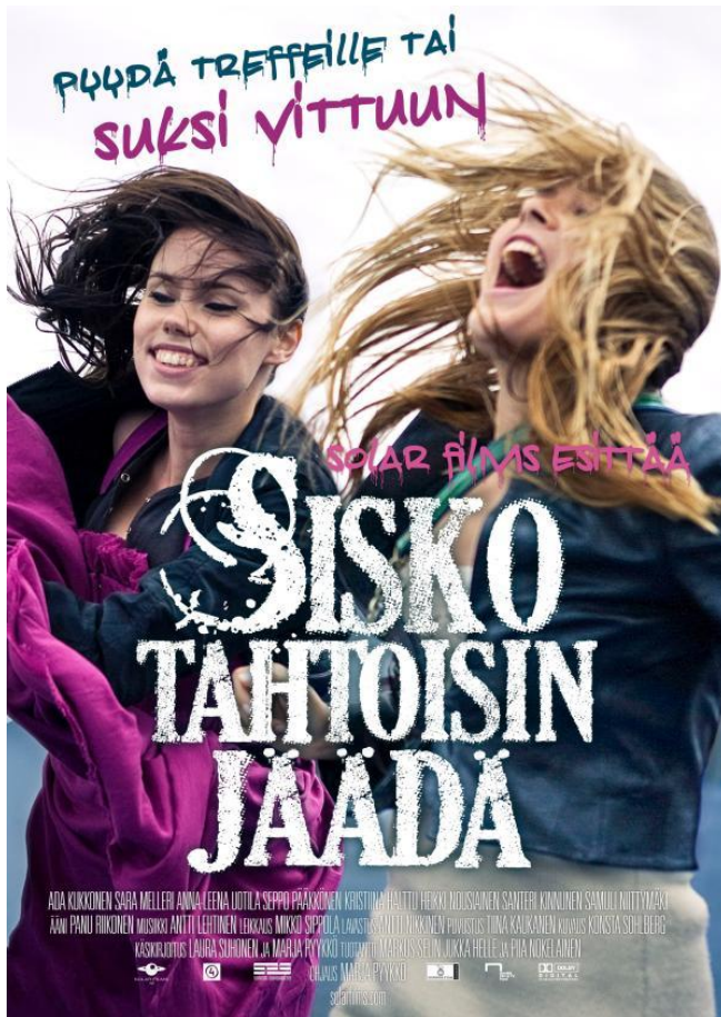
Kuva 2. Sisko tahtoisin jäädä – elokuvajuliste