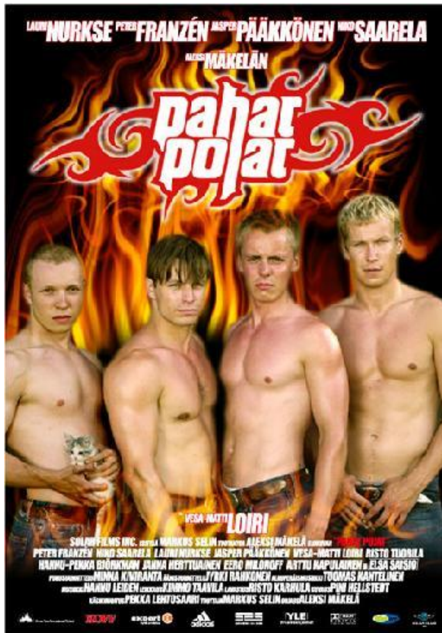
Kuva 1. Pahat pojat – elokuvajuliste

Tekijät: Jussi Reunanen kuva, Jussi Maula suunnittelu/ Solar Films