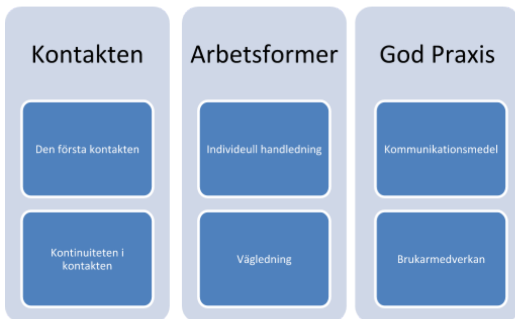
Figur 3, huvudteman och kategorier indelade efter innehållsanalys

Helheten av materialet bröts ner i 3 identifierade teman i sampel med frågeställningarna och sedan skapades kategorier av de viktiga diskussionerna under varje tema, enligt anvisningar av Dahlin -Ivanoff & Holmgren (2017 s. 70 - 72). Nedan i bilden kan man se huvudkategorierna samt underkategorierna: