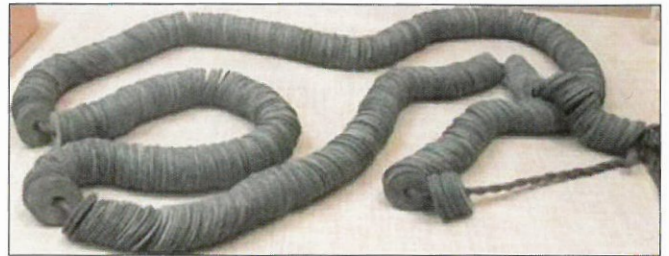
100 ja 1 000 cashin raharimpsut.

Cash-rahoja ja niiden kerrannaisia ja valmistettiin aikoinaan niin Kiinassa, Japanissa ja laajalti muuallakin Indokiinassa aina 1900-luvun alkupuolelle asti. Cash-rahast valmistettiin alun perin valamalla, ja niiden valmistusmäärästä ei juurikaan pidetty kirjaa. Ainoa rajoite niiden valmistamiselle olikin käytännössä messingin saanti. Messingistä ja raudasta valamalla valmistaminen jatkui aina 1910-luvulle, mutta jo 1800 luvun loppupuoliskolla liisääntyi cash rahojen valmistus lyömällä.