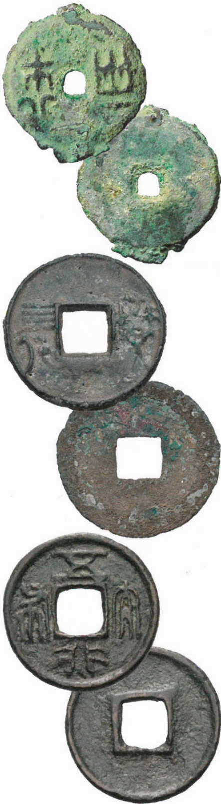
Kolme varhaista cash-rahaa. Ylimpänä Ban Ling raha (käyttöön 378 eKr), keskellä Zhou-dynastian aikainen Yi:n kaupungin 4 huan raha (300–200 eKr) ja alimpana keisari Wu Di:n aikainen Wu Xing Da Bu raha (562–578 jKr). Huomaa siirtyminen alun pyöreästä neliskulmaiseen reikään.