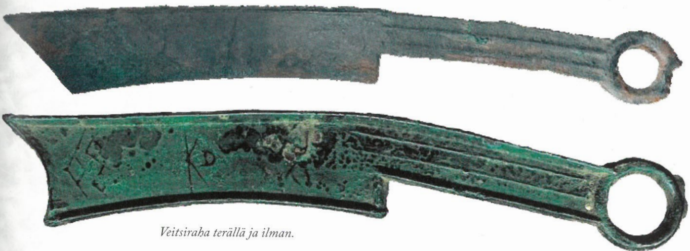
Veitsiraha terällä ja ilman.

talliin (aluksi pronssi, myöhemmin messinki; myös rautaisia casheja on valmistettu) perustuva maksuvälinearvo. Rahoissa on hallitsijan ja alueen ilmaiseva teksti, mikä mahdollistaa niiden tunnistamisen ja ajoittamisen. Kiinassa näitä rahoja on kutsuttu nimellä qian, mutta sittemmin käyttöön vakiintui etelä-intialainen tamilinkielen sana kasu, josta juontuu kaikkien tuntema englanninkielinen nimi cash.