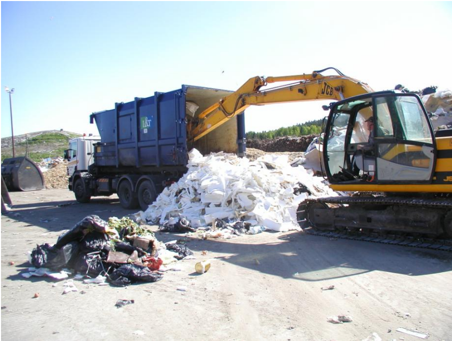
Kuva 6 Jätekuorman tarkastus kuorman purkamisen yhteydessä

Tällaisia jätteitä sisältävistä kuormista lähetetään yritykselle lajitteluohje sekä reklamaatio. Kaikki vastaanotettavat lajiteltavat jätekuormat tarkastetaan purkamisen jälkeen lajittelun yhteydessä, ennen kuin murskauskelpoiset jätteet siirretään murskaukseen ja hyötyjätteen varastokasoihin.