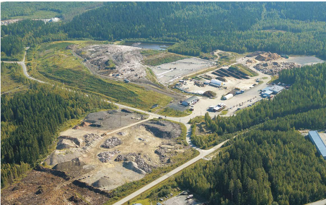
Kuva 1 Kuopion jätekeskus /9./

Kuopion jätekeskus sijaitsee n. 16 km Kuopion eteläpuolella. Jätekukko on vuokrannut Kuopion kaupungin omistaman tontin vuoden 2050 loppuun. Tontin pinta-ala on noin 140 ha. Jätekeskus sijaitsee osittain rakennetussa ympäristössä. Lähin asuinrakennus on 0,8 km päässä jätekeskuksesta luoteeseen. Jätekeskuksen tien varressa sijaitsee vuosina 1967-1992 toiminut suljettu Silmäsuon kaatopaikka. Jätekeskuksen lähin suurempi vesistö on Kallaveden Haminanlahti, joka sijaitsee jätekeskuksesta 1,6 km koilliseen. Alueella ei ole tärkeitä pohjavesialueita. Jätekeskuksen ympäristössä virtaavien pinta- ja pohjavesien virtaussuunnat ovat pääsääntöisesti yhteneviä. Lapinjärven laskuoja kulkee jätekeskuksen alueen kaakkoisreunalla ja se on ohjattu virtaamaan Heinälamminojaan, joka laskee Myllyjoen ja Kyläkeskusjoen läpi Haminanlahden kallaveteen. /8./