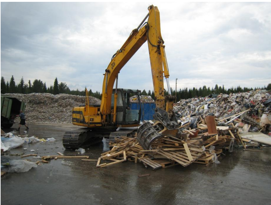
Kuva 7 Jätekuorman lajittelu koneella