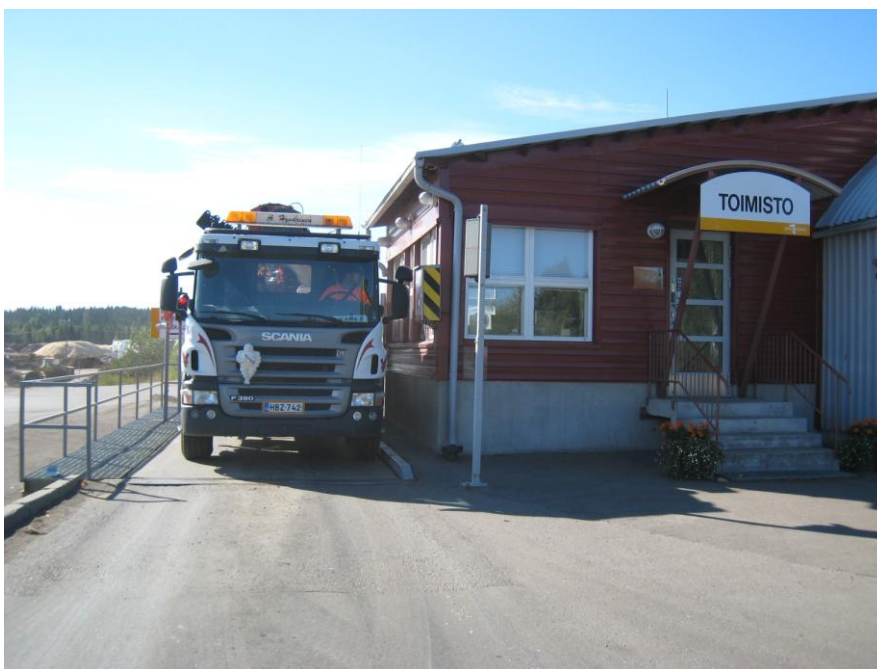
Kuva 2 Jätekeskuksen vaaka ja toimistorakennus