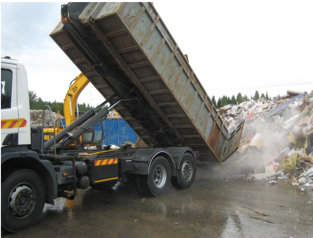
Kuva 5 Jätekuorman purku

Jätekuormien siirtoasiakirjaan merkitään mm. asiakkaan tiedot, kuorman sisältö ja hyväksytäänkö jätteet sijoitettavaksi kaatopaikalle. Jätekuormat tarkastetaan ennen purkamista kuormantarkastuspisteessä (kuva 4) tai purkamisen yhteydessä (kuva 6). Jätekuormista tarkastetaan olomuoto, väri sekä öljyn tai liuottimien poikkeava haju aistinvaraisesti ja tarvittaessa soveltuvilla pikamääritysmenetelmillä. Jos jäte täyttää sille asetetut kelpoisuusvaatimukset, se voidaan vastaanottaa jätekeskukselle. Kuorma-auto punnitaan ensin jätekeskuksen vastaanoton vaa'alla. Siitä auto ajaa kuormantarkastuspisteeseen. Ensin jätekuorma tarkastetaan silmämääräisesti ja määrätään kuorman purkupaikka (kuva 5). Jätekuorma tarkastetaan vielä purkamisen yhteydessä, koska kuorman päältä ei näe kuorman koko sisältöä. Kun kuorma on purettu, siitä lajitellaan koneella (kuva 7) mahdolliset kuormassa olleet hyötyjätteet ja sellaiset jätteet, joita kuormassa ei saa olla. Jätteet, joita ei kuormassa saa olla lajitellaan ja siirretään niille kuuluviin vastaanottoaikoihin (esim. ongelmajätteet Ekokem Oy Ab:lle).