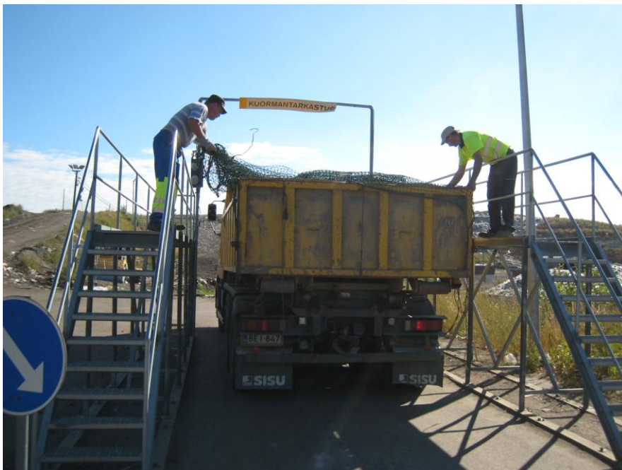
Kuva 4 Kuormantarkastus silmämääräisesti

Kun jätekuorma tulee jätekeskukselle, kuormasta täytyy tarkistaa tarvittavat asiakirjat kuten tarvittaessa siirtoasiakirja (ks. liite 1) sekä jätteen perusmäärittelylomake (ks. liite 2), jätteen syntytyyppi ja jätekuorma silmämääräisesti.