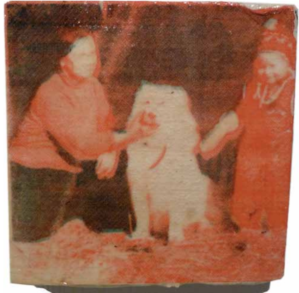
Serigrafiateoksia näyttelystäni. Teosten pohjana 70-luvun lapsuuskuvani.