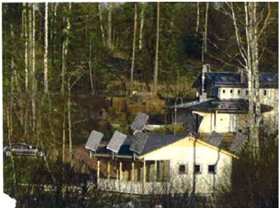
Kuva 2. Havainnekuva Villa Tainan aurinkopaneeleista

Esimerkkitapauksessa asiakas on ostanut kahdeksan kappaletta 200 W:n aurinkopaneeleita (kuva 2.).