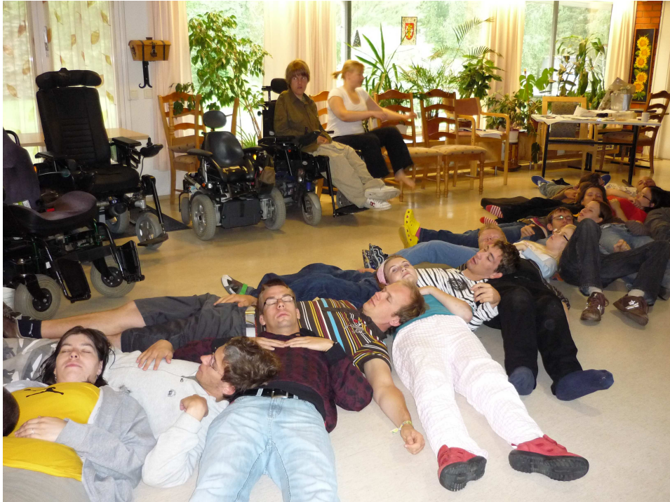
Kuva 3. Seittiläisiä Kaarinassa viettämässä kesää 2008.

Seitissä panostetaan jatkuvasti erilaisuuden kohtaamiseen ja ennen kaikkea erilaisuuden hyväksymiseen, jotka Taina Karman (2010, 21) näkee yhteisöllisyyden perustaksi. Hänen mukaansa perinteisyys ja säännöllinen toistuvuus ovat ominaisia yhteisöllisyydelle. Näissäkin asioissa voidaan todeta, että Seitissä on mukana vahva perinteisyys ja säännöllisyys. Perinteisinä toimintatapoina mainittakoon keväisin järjestettävä nuorisotoimikuntien seminaari ja valtakunnalliset pikkujoulut. Säännöllisyys puolestaan näkyy parhaiten Seitin oman nuorisotoimikunnan vuosittaisissa kokouksissa, joita on neljä tai viisi.