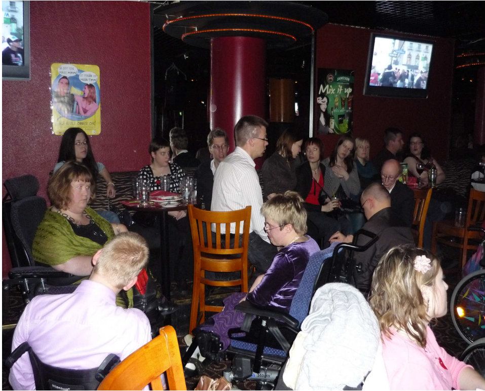
Kuva 2. Seittiläisiä viettämässä pikkujouluja Hotelli Vantaalla marraskuussa 2008.

kuten hotelleissa. Tällöin viestitään ihmisille, että kyllä liikuntavammaisetkin henkilöt käyvät siellä, missä muutkin henkilöt ja liikkuvat ihmisten ilmoilla. Jo pelkästään se, että vammaisia henkilöitä liikkuu yleisissä paikoissa, voi avata ihmisten mieltä näkemään erilaisuutta.