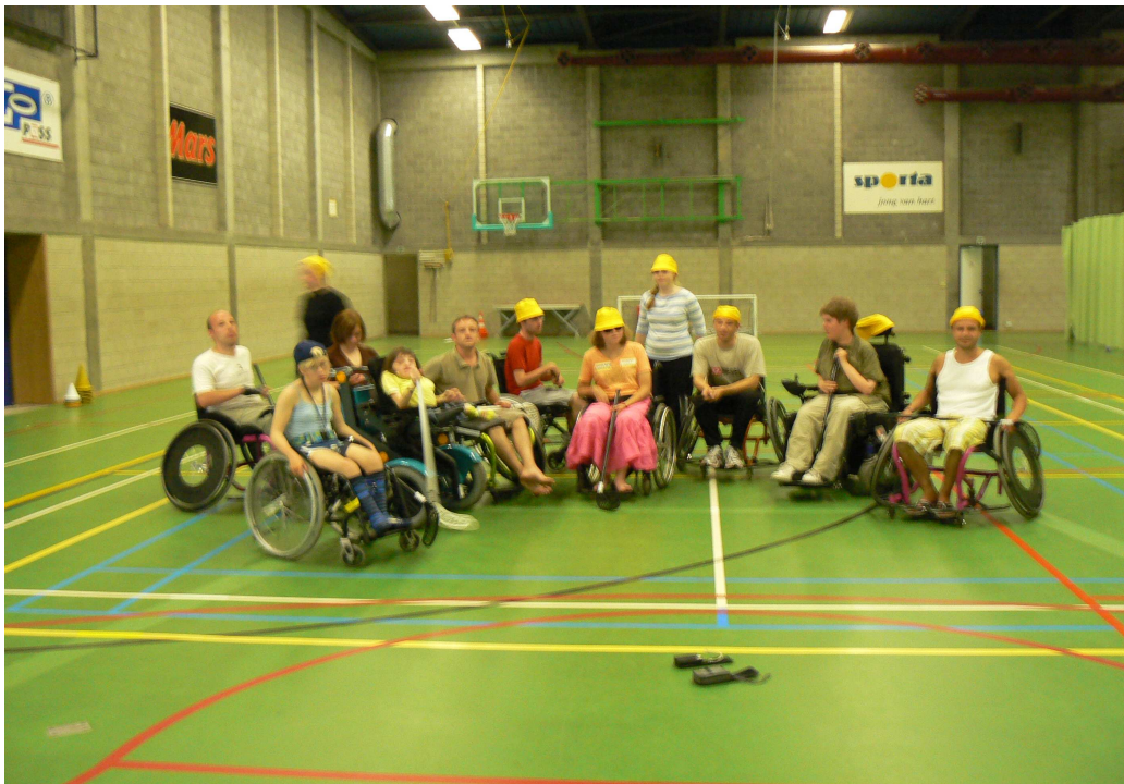
Kuva 4. Seittiläisiä belgialaisten ystävien kanssa leikkimielisessä pyörätuolisalibandykilpailussa Belgian Tongerlossa kesällä 2007.

Dialogin eli yhteisen vuoropuhelun avulla voidaan ymmärtää vertaisryhmän monimuotoista kokonaisuutta. Dialogi on kahden tai useamman ihmisen välistä vuoropuhelua, jonka tavoitteena on yhteisen ymmärryksen edistäminen. Vuorovaikutus on aina kaksisuuntaista; dialogisuus muuttaa aina keskustelussa mukana olevia. Tasavertaisuuteen perustuva dialogi on hyvä keskustelumenetelmä vertaisryhmätoiminnassa. Arvostavassa dialogissa tärkeitä on toisten kuunteleminen ennakkoluulottomasti, kiirehtimättä ja krittisoimatta. (Holm 2010, 53; Laimio & Karnell 2010, 18.)