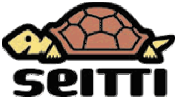
Kuva 1. Nuorisoyhteistyö Seitin tunnus, kilpikonna nimeltään K. Unto.

Seitillä on laaja yhteistyötahojen kirjo, joiden kanssa on jatkuvasti kokouksia ja muita tapaamisia. Näitä ovat CIMO – kansainvälisen nuorisovaihdon keskus, KVT – Kansainvälinen vapaaehtoistyö ry, OK- ja TSL-opintokeskukset, Suomen nuorisoyhteistyö Allianssi ry, Nuorten Akatemia, VNY – Vammaisjärjestöjen nuorisoyhteistyöryhmä, Kynnys ry, Curly sekä eri oppilaitokset, kulttuuri-, nuoriso- ja harrastejärjestöt ja kuntien nuoriso- ja vapaa-aikatoimi sekä sosiaali- ja terveystoimi. (Jokinen 2008.)