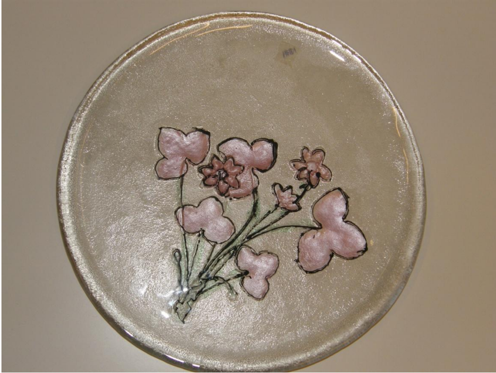
KUVA 8. Lasimaalauksella koristeltu lautanen.