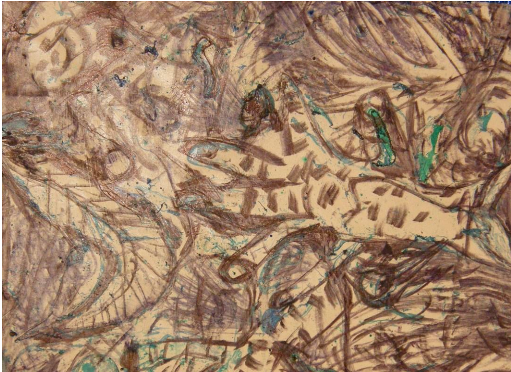
KUVA 20. Marmorioimalla tehty tausta ja sen päälle piirretty tussilla.

Taide voi toimia terapeuttisena elementtinä, sillä sen avulla ihminen voi ilmaista itseään tietoisesti ja alitajuisesti. Taideterapiassa keskeinen ajatus on, että jokainen ihminen kykenee heijastamaan sisäiset ristiriitansa visuaaliseen muotoon. Taiteen tekemisessä tärkeintä on henkilö ja prosessi, ei lopputulos. Terapiassa ei ole tarkoitus että, terapeutti analysoi valmista työtä mahdollisimman tarkasti. Syntynyttä teosta tutkitaan yhdessä ja siitä keskustellaan. Totuus on, että ainoastaan tekijä itse voi ymmärtää täydellisesti tekemänsä työn sisällön. (Keränen 2001, 109.)