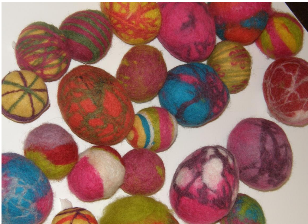
KUVA 13. Huovuttamalla tehtyjä pääsiäismunia.