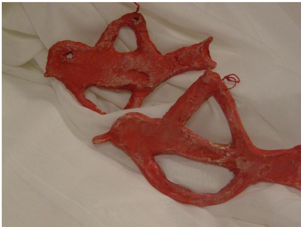
KUVA 16. Savilintuja.