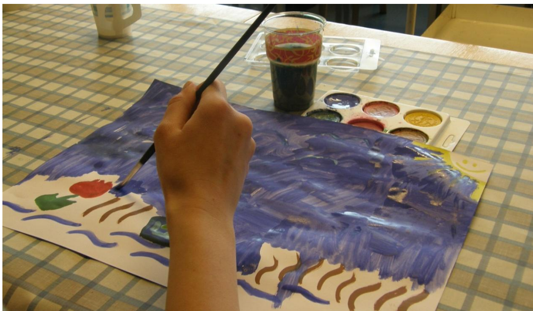
KUVA 22. Luomisprosessi.

Olemme itsekkin opiskelleet jonkin verran kuvataideterapiaa ja myös harjoitelleet käytännössä kuvan terapeuttista käyttöä. Olemme vakuuttuneita taiteen tekemisen ja käsillä tekemisen terapeuttisista vaikutuksista. Meillä ei ole kuvataideterapeutin koulutusta, mutta mielestämme voimme puhua kuvan terapeuttisesta käytöstä. Taideterapia on itsensä etsimistä. Ajatuksia ja tunteita ilmaistaan maalaamalla, piirtämällä, muovailemalla tai muilla kuvallisilla keinoilla. Tekemällä, kokemalla, ja puhumalla opitaan tuntemaan itsensä syvällisemmin sekä tunnistamaan itsessä olevia positiivisia ja negatiivisia tunteita. (Saarinen 1992, 55-60.) Terapiamenetelmiä käytettäessä on tärkeää, että menetelmää ohjaavalla henkilöllä on omakohtaisia kokemuksia käyttämänsä toimintamuodon suotuisista vaikutuksista. Ohjaajan asenteen merkitys on suuri. Lisäksi on oltava itse innostunut, jotta voi innostaa toisia. Meillä on omakohtaisia kokemuksia kuvan ja musiikin terapeuttisesta käytöstä niin yksilötasolla, pareittain kuin pienryhmissä. Olemme kokeneet ja nähneet ympärillämme niiden voimaannuttavan vaikutuksen. Siitä intoutuneina alusta asti näimme tämän kurssin ryhmämuotoisen toiminnan terapeuttisesta aspektista, joka tarjoaa mahdollisuuden osallistumiseen ja yhteenkuuluvuuden tunteeseen, hyvään elämään ja osallisuuteen yhteisössä.