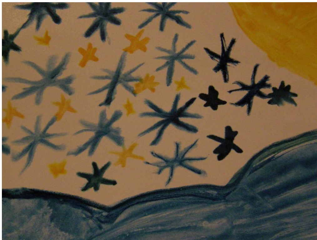
KUVA 28. Kurssilaisen maalaus.

Pyrimme avoimissa kysymyksissä välttämään valmiiden vastausvaihtojen antamista ja annoimme kurssilaisten rauhassa miettiä vastaustaan. Emme halunneet johdatella vastaajaa, sillä näihin kysymyksiin ei ollut oikeita tai vääriä vastauksia. Välillä silti jouduimme avaamaan kysymystä ja esittämään tarkentavia kysymyksiä, jotta kurssilainen ymmärsi oikein, mitä häneltä kysyttiin.