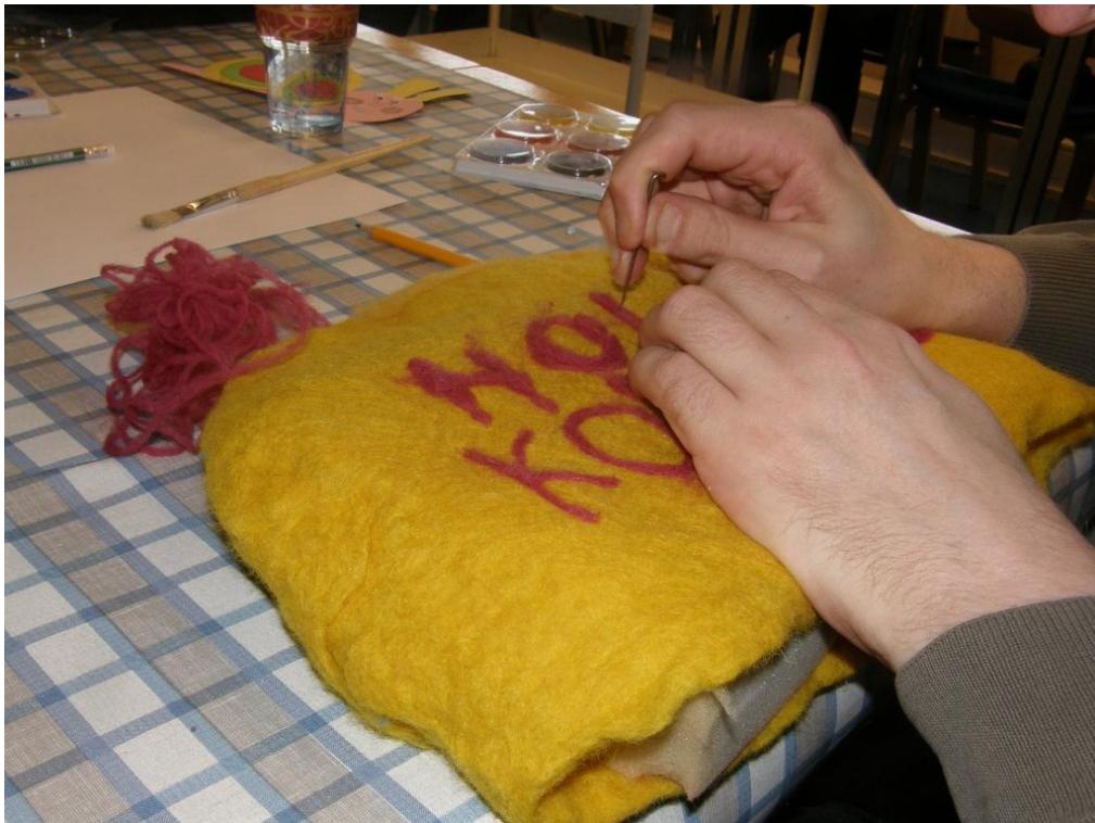
KUVA 24. Luomisen iloa.

Puhuttaessa kuvataideterapeuttisesta toiminnasta, on tärkeä huomioida tilan turvalliseen ilmapiiriin sekä terapeuttisesti toimivan opettajan kykyyn pitää prosessin rajat selkeinä. Kuvataideterapeuttisessa toiminnassa luodaan rajat toiminnalla. Ne rakennetaan suojaamaan ja turvaamaan oppijaa sekä antamaan hänelle liikkumatilaa niin henkisesti kuin fyysisestikin. Näitä rajoja ovat tila, paikka, aika, taidemateriaali. (Hautala 2008, 66.) Ryhmän toiminta on suunniteltava huolella. Ensimmäinen tärkeä asia on ryhmän koko. Se ei saa olla liian suuri. Ryhmä on kodikas ja turvallinen kun siinä säilyy mahdollisuus kasvokkain oloon (Hautala 2008, 114).