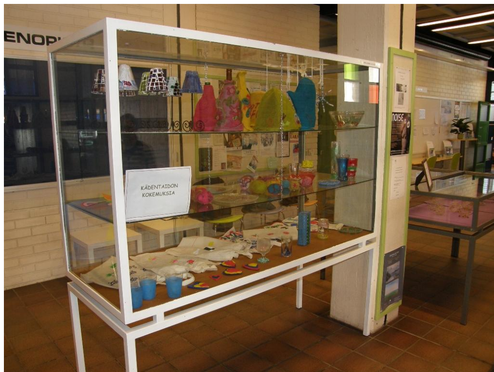
KUVA 4. Kevätnäyttely.

Kevätkauden suunnitteleminen oli huomattavasti helpompaa, kun tunsimme kurssilaiset ja olimme saaneet myös heiltä ideoita kevätkaudelle, jotka huomioitiin kevättä suunnitellessa. Pidimme syyskauden loputtua suunnittelupalaverin ja keskustelimme samalla kurssin sujumisesta. Keväällä luvassa oli puhallusmaalausta, narupainantaa, kankaanpainantaa eri tekniikoilla, lasimaalausta itse tuotuun lasiesineeseen, jääkaappimagneetti Cernit-massasta, pääsiäiskoristeita huovuttamalla, paperinarupallot sekä mosaiikkityö.