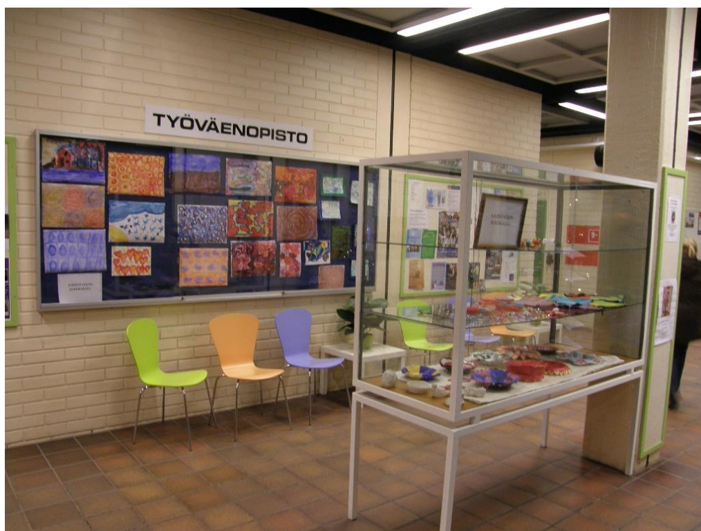
KUVA 3. Näyttely syksyllä kurssilla tehdyistä töistä.

Vaikka kurssi olikin suunnattu erityistä tukea tarvitseville, sen tarkoituksena oli kädentaitojen kokemusten saaminen. Ajattelimme myös opinnäytetyötämme, emmekä halunneet missään vaiheessa luokitella, saati diagnosoida erilaisia opiskelijoita. Kurssille olivat tervetulleita kaikki, jotka olivat kiinnostuneita käsillä tekemisestä. Kuitenkin lähtökohta ja edellytys kurssille osallistumiseen oli erityisen tuen tarve tekemisessä ja osallistumisessa. Hienoimmalta tuntui kurssilaisten innostuneisuus. Yksi nainen esitteli erityisammattikoulussa tekemänsä kansion ja toinen taas oli niin innostunut, että ehdotti taidenäyttelyä viimeiseksi kerraksi. Jokainen kurssilainen ilmoitti haluavansa omat työt esille näyttelyyn. Taidenäyttely päätettiin järjestää viimeisellä kerralla. Se järjestettiin Työväenopiston alakerran aulaan, jossa työt olivat viikon esillä. Jokainen töitä ihastelemassa käynyt sai kirjoittaa nimen vieraskirjaan.