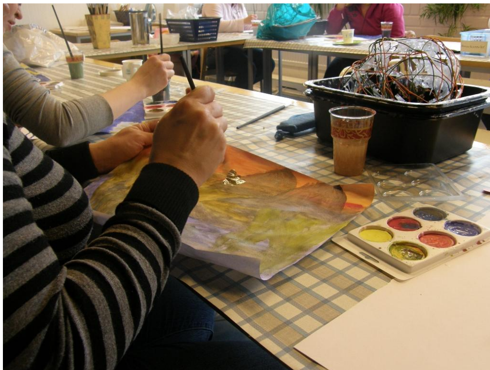
KUVA 25. Taideterapeuttisen hetken luomistyö.

Kummallakaan meistä ei ole terapeutin koulutusta, joten hetki oli toteutettu terapeuttisella tavalla. Aihe ei saa silloin olla liian syvälinen. Molemmat meistä ovat kiinnostuneita taiteen terapeuttisesta käyttämisestä työssään ja uskomme sen vaikuttavan ihmiseen. Taiteen avulla ihminen oppii tuntemaan itseään paremmin ja sen avulla omien tunteiden työstäminen on monesti helpompaa.