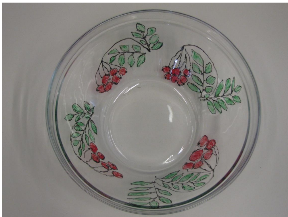
KUVA 7. Kurssilaisen itse suunnittelema pihlajanmarjakuvio.