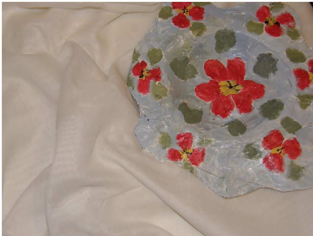
KUVA 15. Paperimassasta tehty koristekulho.