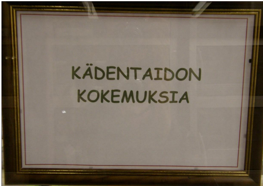
KUVA 2. Kurssin nimi muotoutui sisällön mukaan.

voivat kuitenkin johtua myös ihmisestä itsestään. Rohkeus liikkua kodin ulkopuolella riippuu täysin aikaisemmista kokemuksista sekä ihmisen itsetunnosta. Kodin ulkopuolelle uskaltautuminen vaatii rohkeutta asettaa itsensä ja oma erityisyys alttiiksi toisten arvostelulle ja reaktioille. Myönteinen elämänasenne auttaa elämään rikasta elämää ja tekemään asioita, joita itse haluaa. (Loijas 1994, 47-50.) Monet erilaiset syyt saattoivat aiheuttaa sen, että myös tälle kurssille osallistuminen oli joillekin mahdotonta. Jatkuva henkilökohtaisen avun tarve saattaa olla syynä siihen, ettei ole mahdollista lähteä harrastamaan. Joillekin kulkemisen esteet Työväenopistolle saattoivat olla liian suuria, ja siksi jäi osallistumatta kurssille halusta huolimatta. Erilaiset ahdistus- ja pelkotilat saattoivat aiheuttaa sen, ettei ollut rohkeutta osallistua ryhmään. Syitä voi siis olla hyvin erilaisia.