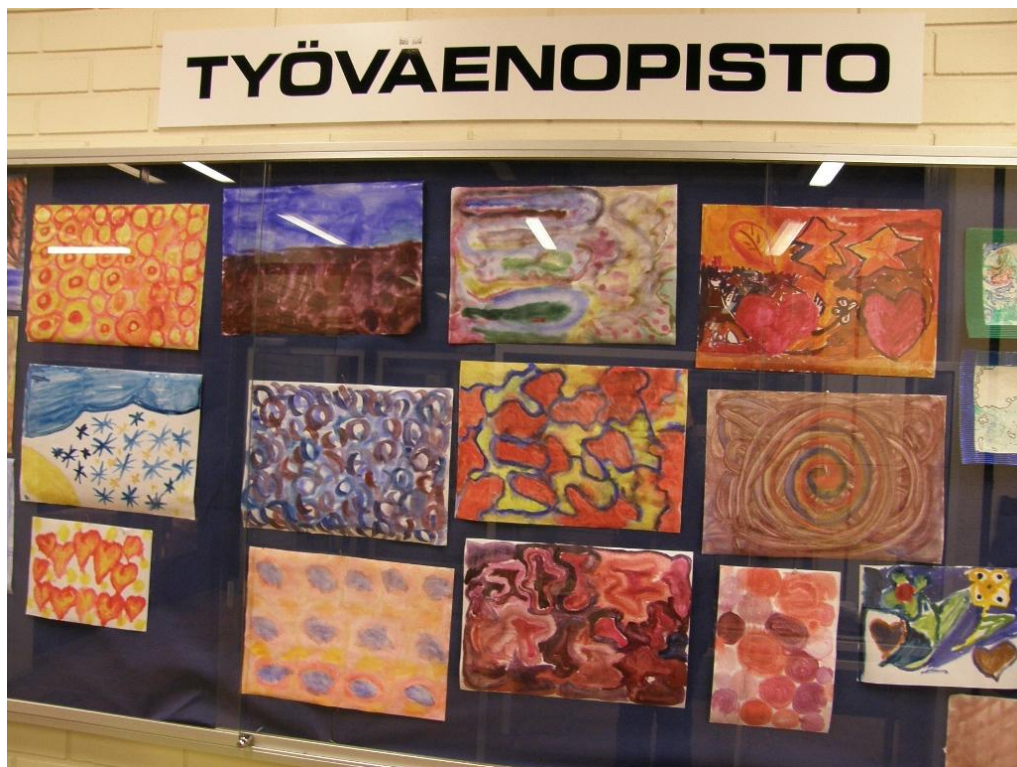
KUVA 27. Kurssilaisten töitä vitriinissä.

Haastattelun tuloksia käsiteltäessä käytämme tekstissä kursivointia , jotka ovat suoria lainauksia haastateltavien avoimista vastauksista.