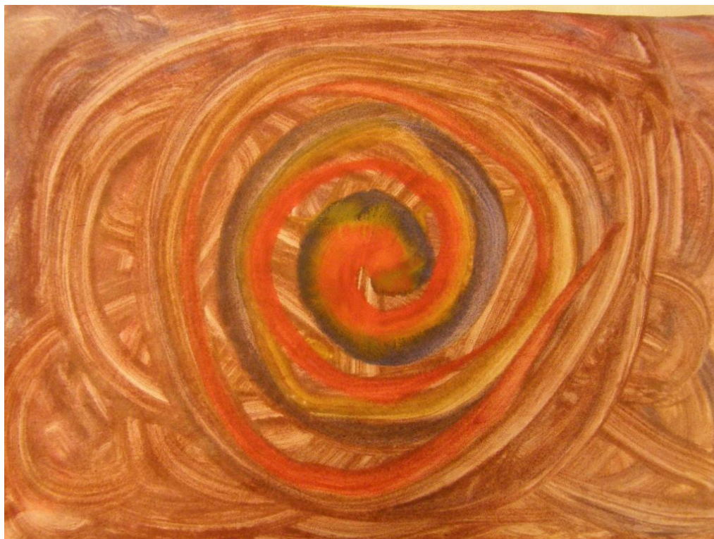
KUVA 21. Kurssilaisen maalaama työ.

Kuvallisella ilmaisulla on usein terapeuttisia vaikutuksia. Tekemisen avulla ihminen saa kosketuksen sisäiseen maailmaansa, joka on jäänyt varjoon. Hän voi tehdä näkyväksi ja tutustua tuohon kätkeytyyn puoleen itsessään. Helposti ajattelemme, että antaa niiden tehdä, jotka osaavat. Jokaisella ihmisellä on kuitenkin kyky löytää visuaalinen muoto mielensä sisäiselle maailmalle. Mitään kohderyhmää ei pidä jättää ulkopuolelle, sillä verukkeella, että he eivät osaa. Tunteiden ilmaiseminen voi olla vaikeaa sanallisesti, mutta esimerkiksi värien avulla voi maalata kuvan ja jakaa sen toisen kanssa. Kaikkea ei tarvitse selittää. Riittää, kun tulee vastaanotetuksi. (Lipsanen-Rogers 2005, 64-71.)