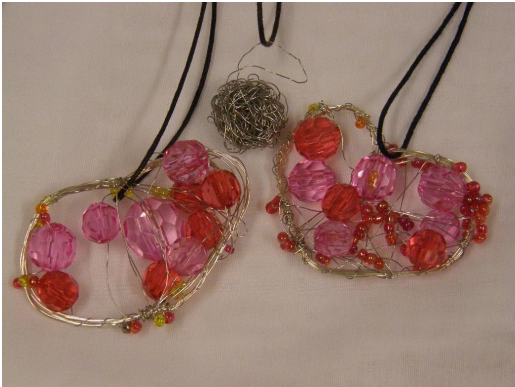
KUVA 11. Metallilangasta tehtyjä kaulakoruja.