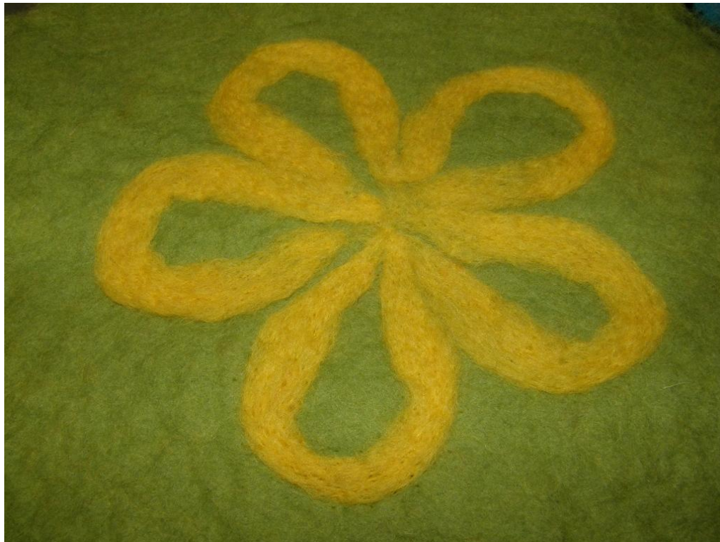
KUVA 17. Huovuttaen tehty patalappu.