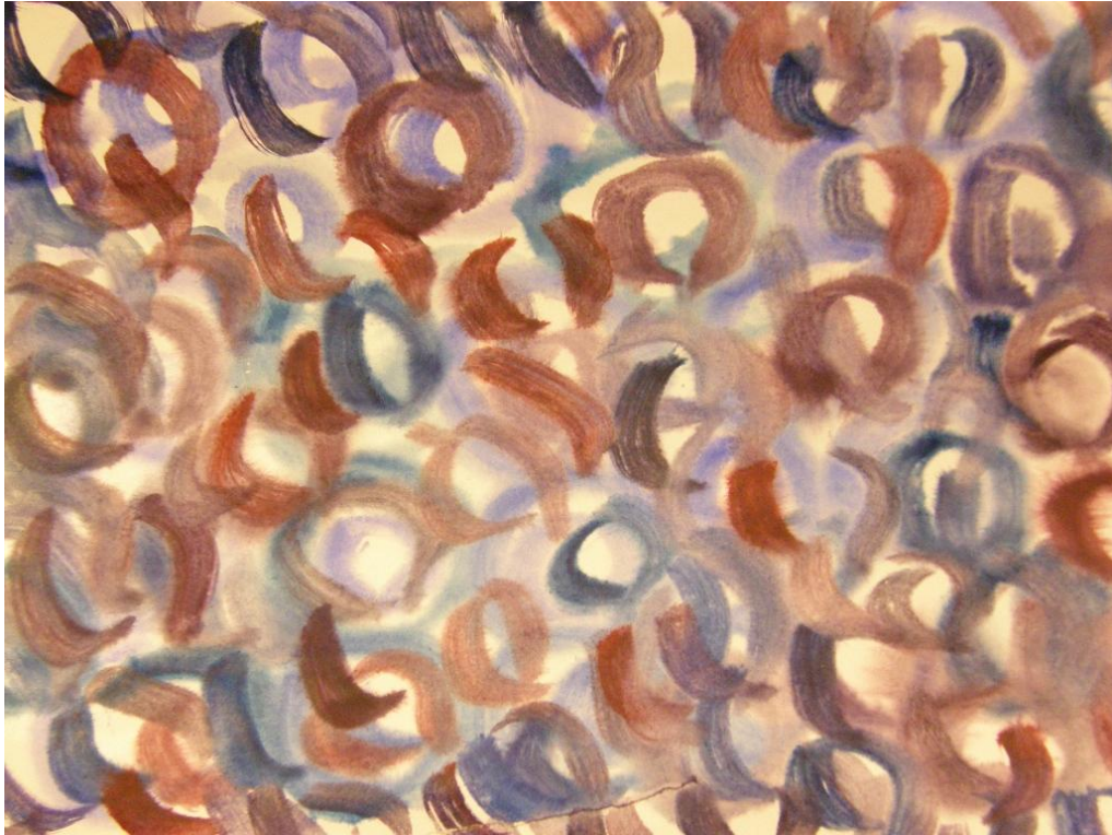
KUVA 19. Tomusokeriliuksella ja peiteväreillä maalattua.

Tekemisen kautta joudumme näkemään maailmasta uudenlaisia asioita, itsessämme muotoutuu uusia piirteitä. Taiteen tekeminen on asioiden aidosti tekemistä. Se kehittää kokonaisuuden ja sen olennaisten piirteiden hahmottamisen taitoa, ns. teoreettista ajattelua. Taide kehittää tarkkaavaisuutta, keskittymiskykyä ja kärsivällisyyttä, tyytyväisyyden taitoa. Taiteen tekeminen opettaa myös lepäämisen taitoa. Taiteen luomisessa olet irrottautuneena henkilökohtaisista ja ulkonaisista huolista ja pysähdyt aktiivisesti ja samalla se opettaa elämään presensissä. Kun ihmisessä vahvistuu kyky ymmärtää erilaisuutta ja tulkita samanlaisia ilmiöitä toisistaan poikkeavin tavoin, kehittyvät myös suvaitsevaisuus ja erilaisuuden kunnioittaminen. (Venkula 2003, 46-58.)