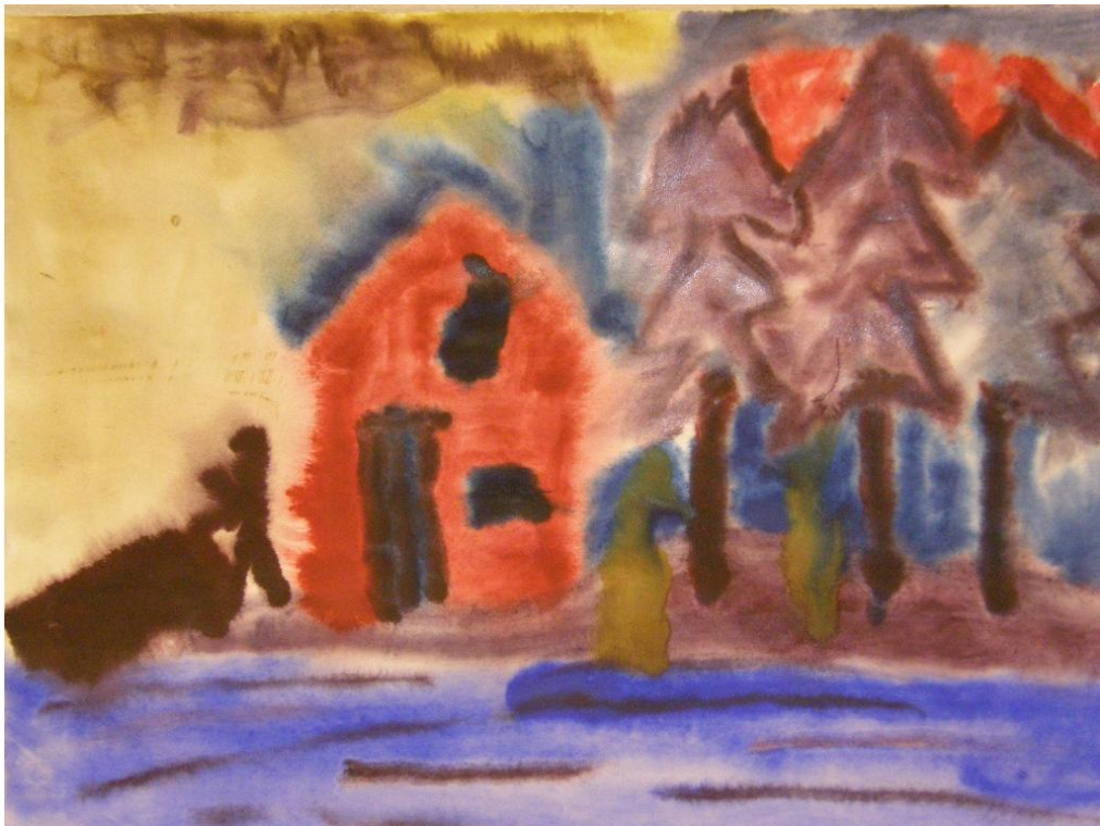
KUVA 23. Kuva omasta ”pirtistä”.

teoista. Esimerkiksi kuvaa tekevällä taiteilijalla ei tarvitse olla terapeutista asennetta, mutta hänen toimintansa ja sen tulos voivat vaikuttaa terapeutisesti häneen itseensä ja hänen valmiin kuvan katsojaankin. (Mantere 1991, 112-113.) Kuvataideterapia on psykoterapiaan verrattavissa oleva terapiamuoto, jolla on hoidolliset tavoitteet eikä sitä voi ohjata kuin terapiakoulutuksen saanut henkilö. Taidetta eri muodoissaan voi kuitenkin käyttää työnsä apuvälineenä ja se voi toimia terapeutisesti. Silloin on hyvä valita itselle tuttu taiteen laji. Asiakastyössä pitää muistaa, että kaikki menetelmät eivät sovi kaikille. Taiteellista lahjakkuutta ei tarvita, mutta ihmisellä on oltava halu ilmaista itseään jollain luovalla menetelmällä kuten esimerkiksi piirtämällä, kirjoittamalla tai musiikin avulla. (Keränen 2001, 107.)