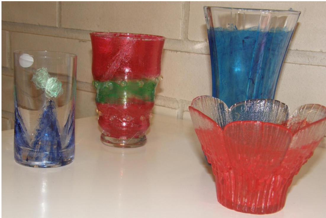
KUVA 18. Omien lasiesineiden koristelua.