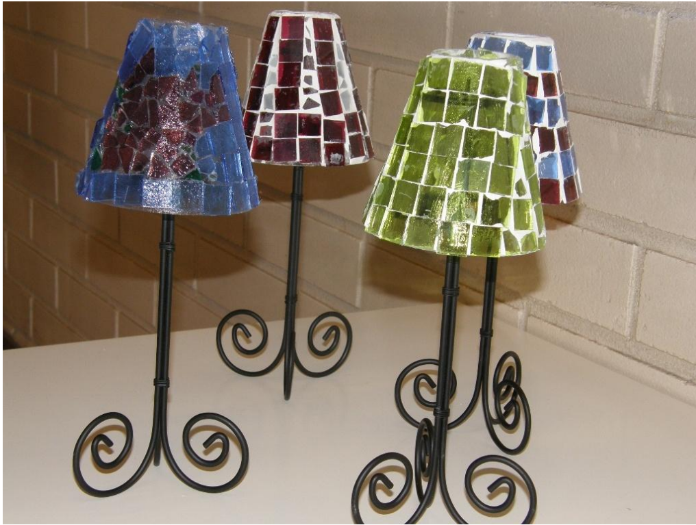
KUVA 10. Mosaiikitöitä.