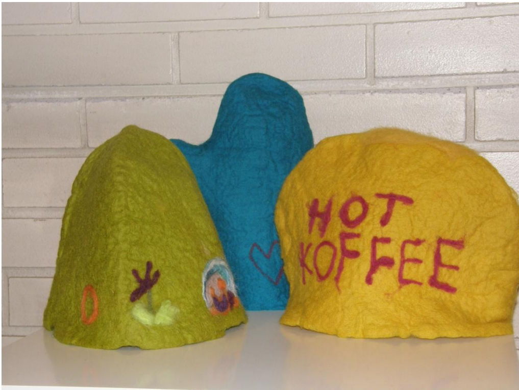
KUVA 9. Huovuttamalla tehty patakinnas ja pannumyssyt.