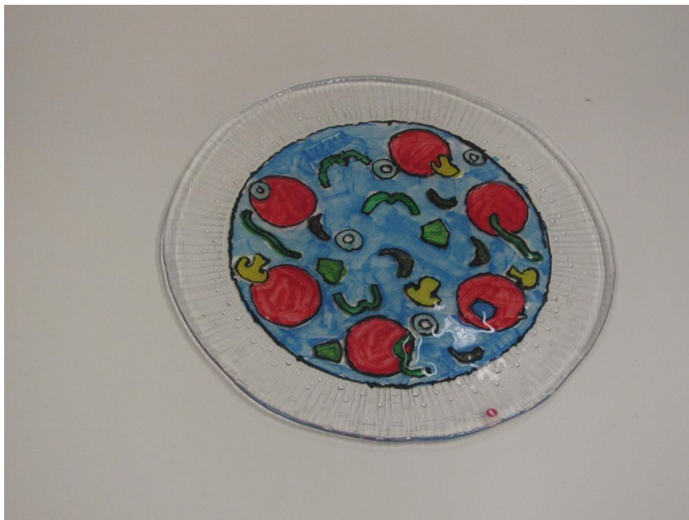
KUVA 6. Lasimaalausta – pizzalautanen.