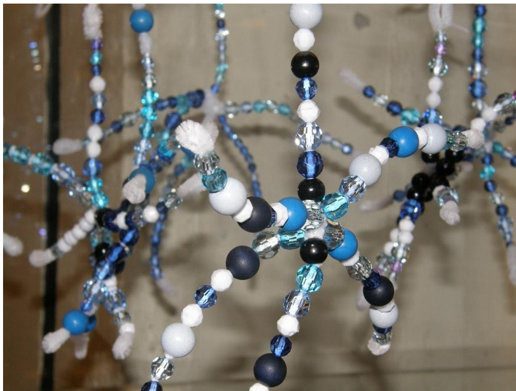
KUVA 14. Lumihiutaleita.