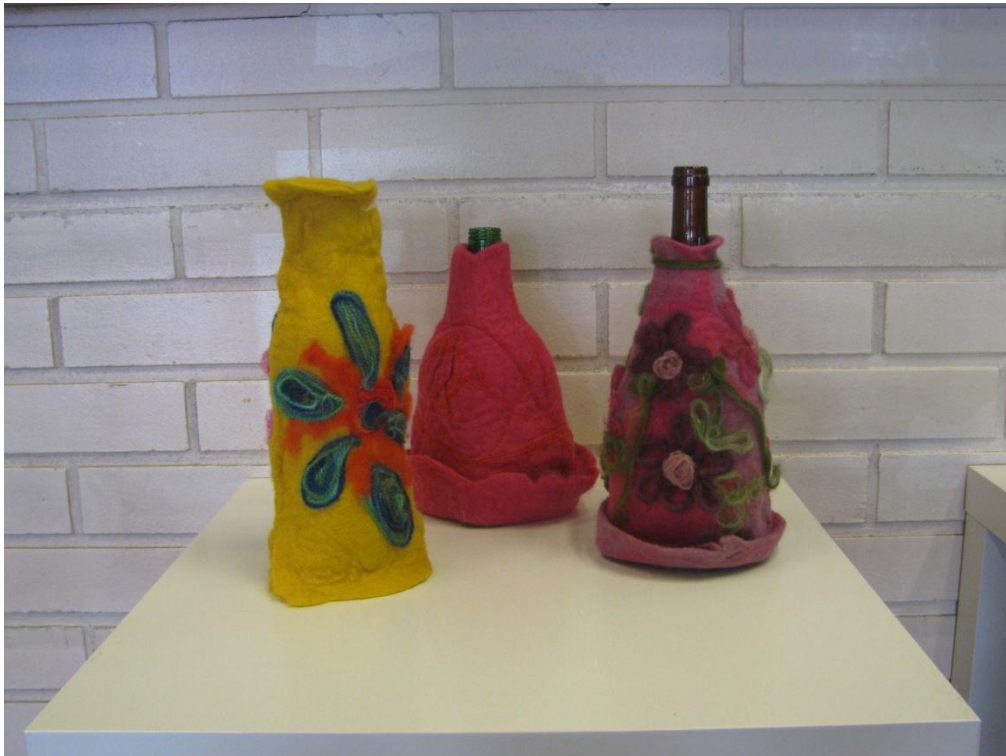
KUVA 12. Huovuttamalla tehtyjä pullopiiloja.