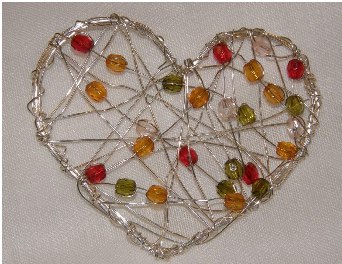
KUVA 5. Korusydän metallilangasta.

Nykyisin puhutaan paljon yhteisöllisyyden katoamisesta ja yksilöllisyyden korostamisesta. Kaikki eivät kuitenkaan ole asiasta yhtä mieltä. Itse asiassa ilmassa on merkkejä siitä, että yhteisöllisyyden ideat elävät uutta kukoistusta. Ihmiset ovat halukkaita liittymään yhteen erilaisiin vapaamuotoisiin yhteisöihin ja nykyajan yhteisöllisyys näkyy haluna kuulua johonkin ryhmään. Yhteisöllä on tyypillisesti jokin yhteinen toiminnan kohde, kuten harrastus. Jokainen sitoutuu mukaan omista lähtökohdistaan ja kiinnostuksensa pohjalta. Sosiaalialan työssä yhteisöllisyys on väline sosiaalisten ongelmien ratkaisemiseen sekä uusien ihmissuhteiden ja sosiaalisten verkostojen rakentamiseen. (Mäkinen ym. 2009, 152-155.)