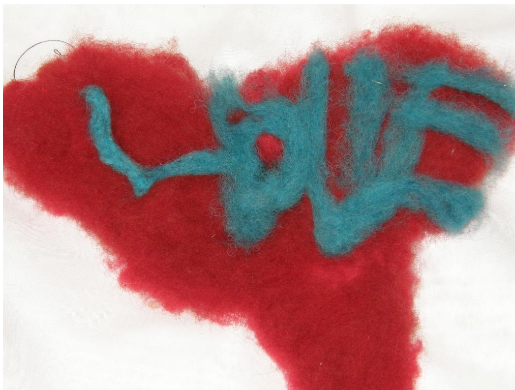
KUVA 29. Huopasydän.

Lopuksi kurssilaiset saivat sanoa terveisensä ohjaajille. Kaikki toivottivat hyvää kesää ja kertoivat kovasti odottavansa syksyllä jatkuvaa kurssia. ” Paras kaveri ja kaikki ” sanoi yksi kurssilainen. Ja ” Kiitoksia haastattelusta ”.