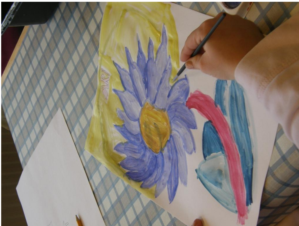
KUVA 26. ”Minun kesäni”.

Mielestämme terapeuttinen taidehetki oli hyvin onnistunut. Tunnelma oli rauhallinen ja kaikki maalasivat paperille jotain itsestään. Jokainen halusi myös kertoa omasta työstään muille, jonka tulkitsimme luottamuksen osoitukseksi.