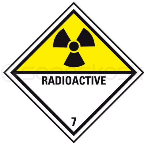
Kuva 6. ADR-kuljetusmerkki 7d ( https://www.sareskoski.com/adr-kuljetusmerkki-7d/P3858 ).