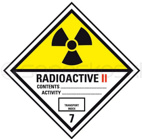
Kuva 4. ADR-kuljetusmerkki 7b ( https://www.sareskoski.com/adr-kuljetusmerkki-7b/P3855 ).