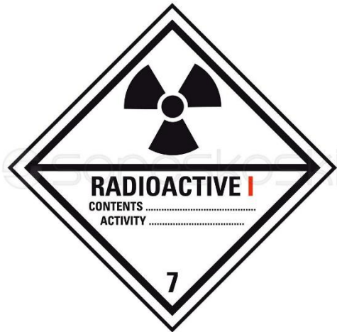
Kuva 3. ADR-kuljetusmerkki 7a ( https://www.sareskoski.com/adr-kuljetusmerkki-7a/P3854 ).