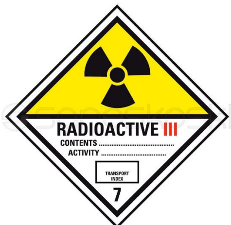
Kuva 5. ADR-kuljetusmerkki 7c ( https://www.sareskoski.com/adr-kuljetusmerkki-7c/P3856 ).