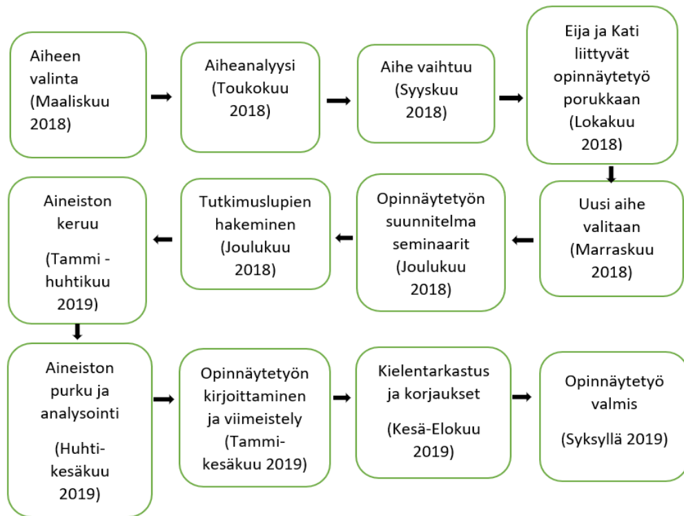
Kuva 1. Opinnäytetyön prosessi ja aikataulu.

toisena päivänä työ taas edistyi todella paljon. Ajatukset olivat todella paljon opinnäytetyössä viimeisen vuoden ajan. Kuvassa 1. on esitetty opinnäytetyöprosessi kaaviona.