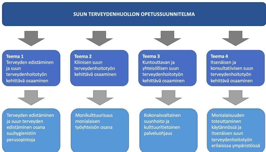
Kuvio 2. Suuhygienistiopiskelijan harjoittelujakso teemoittain Metropolian Ammattikorkeakoulun Myllypuron kampuksen terveystieteiden osastossa.

Suuhygienistiopiskelijoiden harjoittelujakso teemoittain Metropolian Ammattikorkeakoulun Myllypuron kampuksen terveystieteiden osastossa on kuvailtu kuviossa 2. Kyseinen jako teemoittain on yksinkertaistettu luonnos suun terveydenhuollon opetussuunnitelman pohjalta laadituista harjoittelujaksoista Terveystieteiden osastossa. Versioluonnos pohjautuu opetussuunnitelman sisältöihin ja tavoitteisiin (Suun terveydenhuollon opetussuunnitelma syksy 2019).