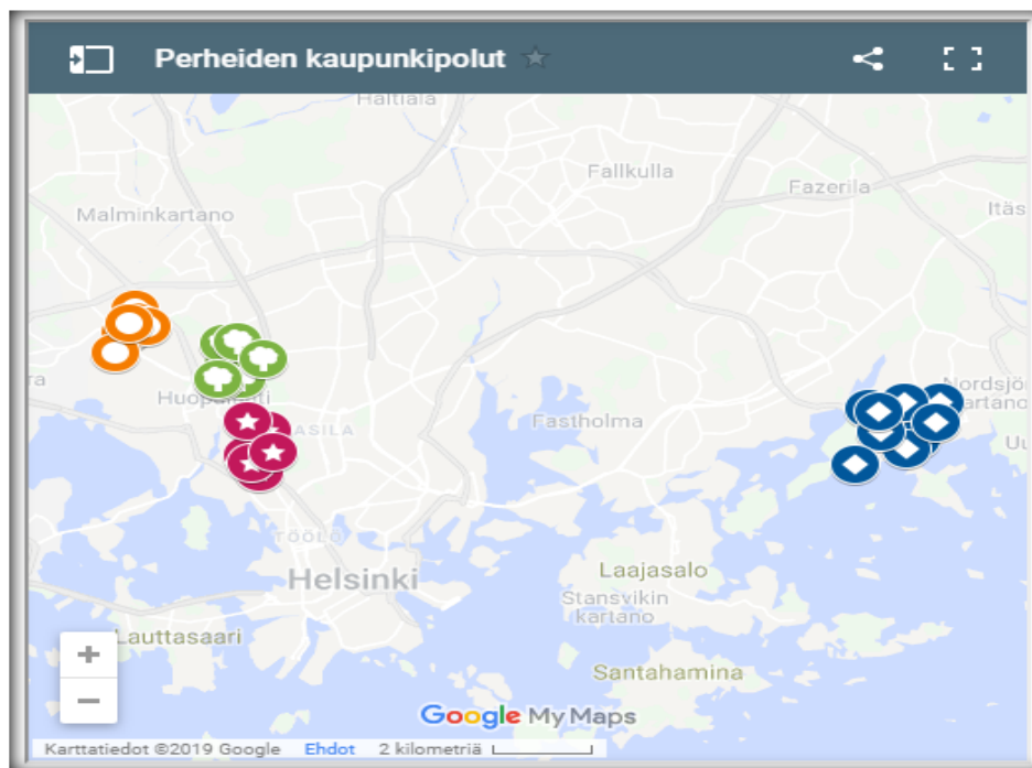
Kuva 2 Perheiden kaupunkipolut kartalla (Pienten Helsinki 2019).

Haastattelujen tuloksien perusteella perheet ovat valmiita liikkumaan aktiivisesti ympäri kaupunkia, joten Perheiden kaupunkipolkujen yhteinen kartta auttaa hahmottamaan niiden sijainnit suhteessa toisiinsa. Kuten tämän hetkessä tilanteessa näkyy kuvassa 2, kolme polkua sijaitsee lähellä toisiaan Länsi-Helsingissä. Perhe voi hyödyntää polkujen läheisyyksiä suunnitellessaan esimerkiksi muutaman päivän lomaa Helsingissä.