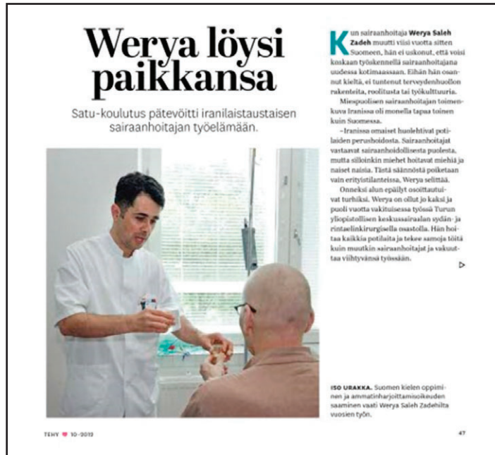
Kuva 2. Weryan haastattelu Tehy-lehdessä 10/2010.

Sairaanhoitaja-lehdessä 6–7/2003 oli artikkeli SATU-koulutuksen alkamisesta ja numerossa 8/2012 haastattelu Mouctar Bahista. Samoin vuonna 2013 oli vielä pikku-uutinen SATU-koulutuksesta Sairaanhoitaja-lehdessä. Turun Naiskeskuksen Appelsiinipuu-lehdessä oli kerrottu SATU-koulutuksesta vuonna 2003. Työelämä-lehdessä 6/2003 artikkelin otsikkona oli ”Opiskelijoiden ensitunnelmat ovat innostuneita”.