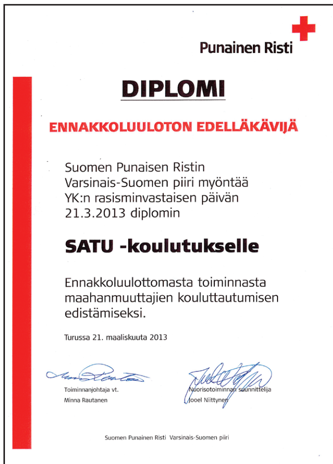
Kuva 5. SPR:n diplomi ”Ennakkoluuloton edelläkävijä”.

SPR:n Varsinais-Suomen piiri antoi SATU-koulutukselle vuonna 2013 “Ennakkoluuloton edelläkävijä” -diplomin (kuva 5). Se oli ansaittua tunnustusta maahanmuuttajien kouluttamisesta työelämään. Palkinnon myöntämiseen vaikutti ratkaisevasti myös se, että SATU-koulutus oli sen toteuttajatahoilta itseltään todellinen näyttö yhteistyön voimasta. SATU-koulutus oli yksi mahdollisuus aluevaikutukseen ja yhteiskuntavastuuseen. Esimerkiksi vuonna 2006 vastaavan tunnustuksen saivat Tyksin rekrytointi ja Turun kaupungin sisätautisairaala, jotka olivat ennakkoluulottomasti palkanneet maahanmuuttajia töihin, myös SATU-koulutuksen käyneitä.