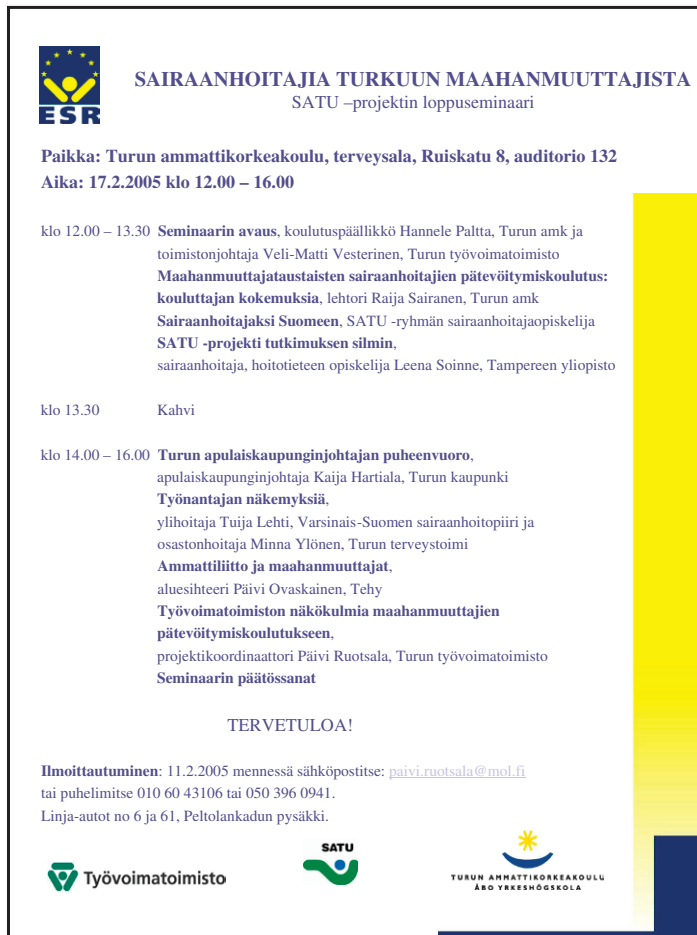
Kuva 4. SATU1 -koulutuksen loppuseminaarin ohjelma.