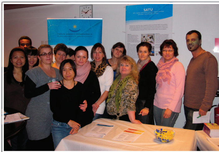
Kuva 7. SATU -ryhmäläisiä esittelemässä SATU -koulutusta.

Turun terveystoimen MONIKAS-hankkeen loppuseminaarissa ”Monikulttuurinen terveydenedistämistyö Turussa” v. 2007 oli esityksen aiheena ”SATU sairaanhoitajakoulutukset osana kotoutumista”. Samaisessa seminaarissa SATU2-ryhmän opiskelijat esittelivät myös opinnäytetöitään. SPECIMA-hankkeen, Turun yliopiston ja Turun ammattikorkeakoulun yhteistyöseminaari v. 2007 ”Oma väki ei riitä – monikulttuuriset voimavarat käyttöön terveydenhuollossa” oli kohdennettu valtakunnan tason päättäjille, viranomaisille ja kouluttajille. Siinä SATU-koulutus sai edelleen näkyvyyttä laajasti. Vuonna 2009 oli Turussa ”Kannattaako Suomeen tulla töihin?” -seminaari, jossa SOTE-alan maahanmuuttajataustaiset työntekijät pohtivat kysymystä, niin lääkärit kuin hoitajatkin. Tällöin myös SATU-koulutuksen tarve tuli hyvin esille. ”Osallisena Suomessa” -tilaisuudessa Turussa vuonna 2011 silloisen SATU4-ryhmän opiskelijat olivat itse esittelemässä SATU-koulutusta ständillä (kuva 7).