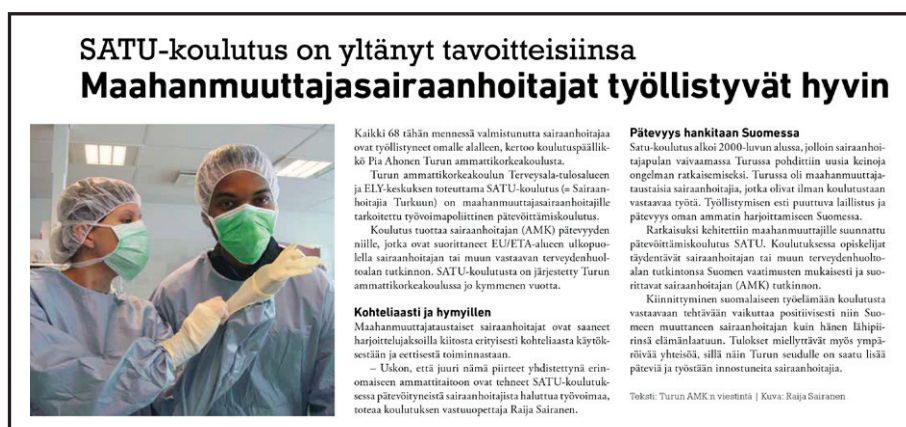
Kuva 3. Turkuposti 6/2013:n kirjoitus.

SATU-koulutusta käsiteltiin lisäksi seuraavissa lehdissä: Turun Sanomien verkkojulkaisu, Aamulehti, Kulmakunta-paikallislehti, Huvudstadsbladet, Aamuset-paikallislehti, Turkulainen-paikallislehti, Turun ammattikorkeakoulun Aurinkolaiva-lehti vuonna 2003, Turun pualest -kaupunkilehti vuonna 2008, TE-keskuksen omia julkaisuja, TEM:n uutiskirjeet, Hämeen Sanomat vuonna 2012, Turkuposti vuonna 2013 (kuva 3.)