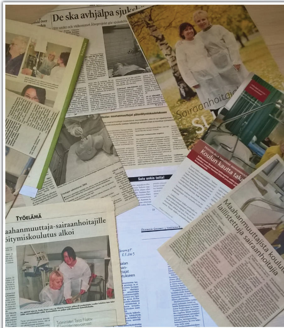
Kuva 1. Alkuvuosien mediaryöpytystä.