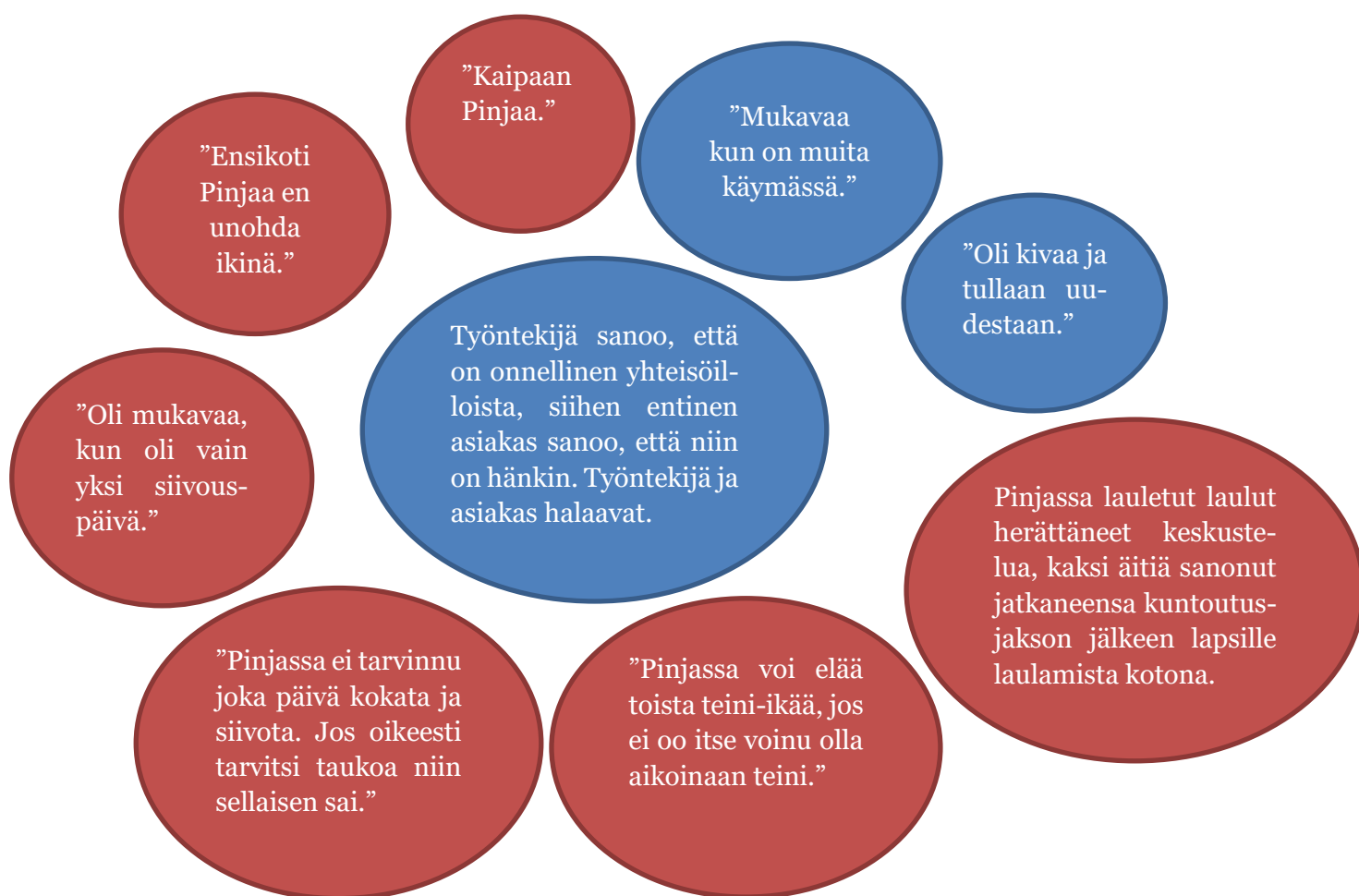
Kuvio 3. Otteita osallistavan havainnoinnin kautta kerätyistä kommentteista ja tilanteista yhteisöiltojen aikana koskien yhteisöiltoja ja Ensikoti Pinjaa.

Seuraavan kuvion lauseet ovat yhteisöiltojen kävijöiden sanomia kommentteja tai tekemiäni havainnointoja Ensikoti Pinjasta ja yhteisöilloista. Kuten menetelmät-luvussa kerroin, kävijöille kerrottiin illoissa, että havainnoin iltoja opinnäytetyötäni varten ja kerään illoista materiaalia opinnäytetyöhöni. Yhteisöiltoja koskevat kommentit ovat sinisten pallojen sisällä ja Ensikoti Pinjaa koskevat kommentit löytyvät punaisten pallojen sisältä.