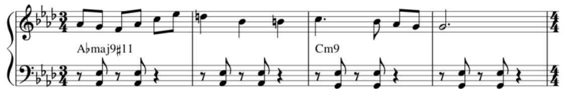
Kuva 5. Aavan tahdit 1-4. Myös harmoniasta löytyy rytmikkaa.

Aavan ensimmäiset neljä tahtia kokonaisuudessaan: