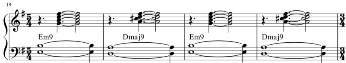
Kuva 9. Em9-Dmaj9-sointuvaihdos 5/4-tahtilajissa.

Kappaleen aiemmat modulaatioyitykset rohkaisivat minua moduloimaan tämän osan pienellä terssillä ylöspäin C#-mollista E-molliin. Melodia eroaa B-osan neljästä ensimmäisestä tahdistä siten, että kahden ensimmäisen tahdin jälkeen se hyppääkin jälkimmäisen soinnun kvintille, eikä perusäänelle. Tätä kautta alas tullessaan se pystyy ilmentämään jälkimmäisen soinnun lydistä sävyä #11-äänellä.