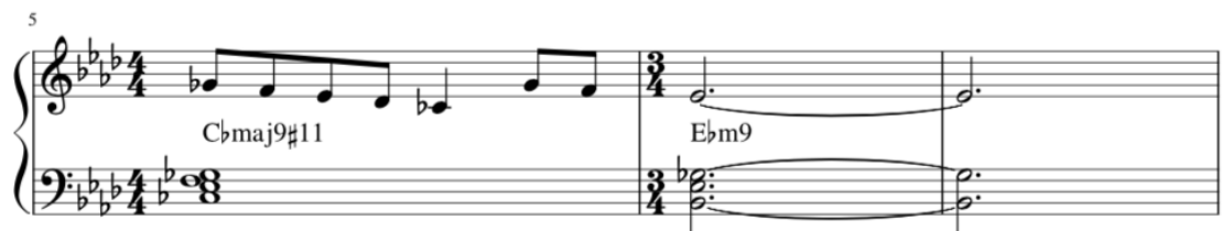
Kuva 6. A-osan tahdit 5-7.

Koin hyvin luonnolliseksi antaa basson vielä laskea, jota kautta löysin Cbmaj7-soinnun, joka ei kuulu Ab-lyydiseen sävellajiin. Kappaleen lead-sheet on kirjoitettu jooniseen Ab-duuriin, jotta se alleviivaisi Abmaj9#11-soinnun olevan toonika. Melodia päättyi neljännessä tahdissa Cm7-soinnun kvintille, g-äänelle, josta löysin luontevasti Cbmaj7-soinnun kvintin, ges-äänen. Tästä melodia jatka lyydistä asteikkoa alaspäin, jonka äänet f, es ja des ovat peräisin joonisesta Ab-duurista.