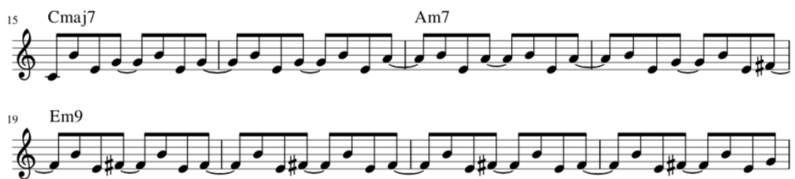
Kuva 23. Kappaleessa on jatkuva sekvenssi.

Kun tämä sointukulku alkoi hahmottua, mieleeni palasi aiemmin soittamani Cmaj7-kuvio. Moduloin äsken soittamani sointukulun E-molliin, jolloin soinnut ovat C – Am – Em. Kun tähän päälle lisäsi Cmaj7 kuvion, sai Revontulet alkunsa. Sovitimme yhteen pianistin kanssa sekvenssin, jonka äänet ennakoivat tulevaa sointua.