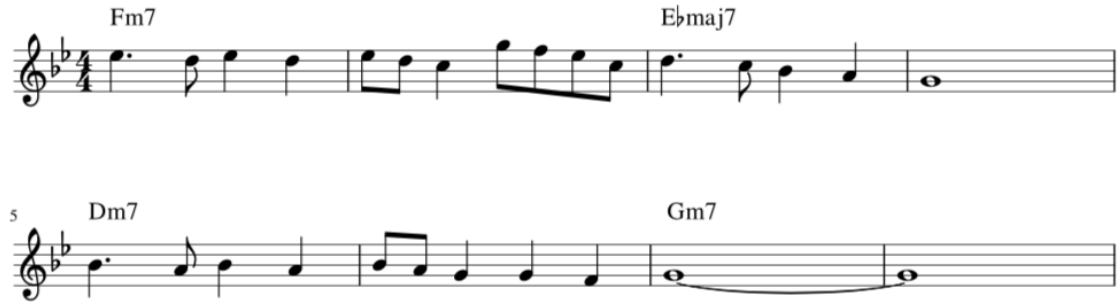
Kuva 18. Kappaleen B-osan melodia sointuineen.

kohtaan valikoitui kuitenkin molli ja näin melodia ilmentää Fm7-soinnussa doorista sävyä. B-osan kolmannesta tahdista eteenpäin ollaan taas selvästi G-mollissa, kun melodia Ebmaj7-soinnulla ilmentää Eb-lyydistä sävyä a-sävelellään.