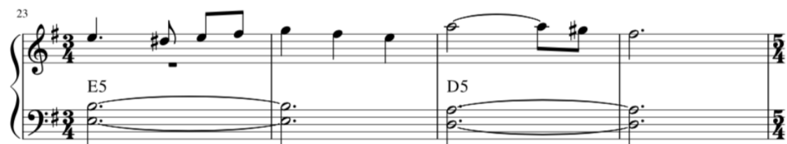
Kuva 10. B-osan jälkimmäinen melodia.

Kappaleen aiemmat modulaatioyitykset rohkaisivat minua moduloimaan tämän osan pienellä terssillä ylöspäin C#-mollista E-molliin. Melodia eroaa B-osan neljästä ensimmäisestä tahdistä siten, että kahden ensimmäisen tahdin jälkeen se hyppääkin jälkimmäisen soinnun kvintille, eikä perusäänelle. Tätä kautta alas tullessaan se pystyy ilmentämään jälkimmäisen soinnun lydistä sävyä #11-äänellä.