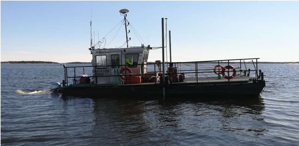
KUVA 6. Harauslautta