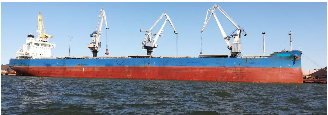
KUVA 7. Rahtilaiva

Kuvassa 7 esiintyy Panamax-luokan rahtilaiva kiinnitettynä sataman laituriin. Kuvan aluksella on pituutta n. 229 metriä.