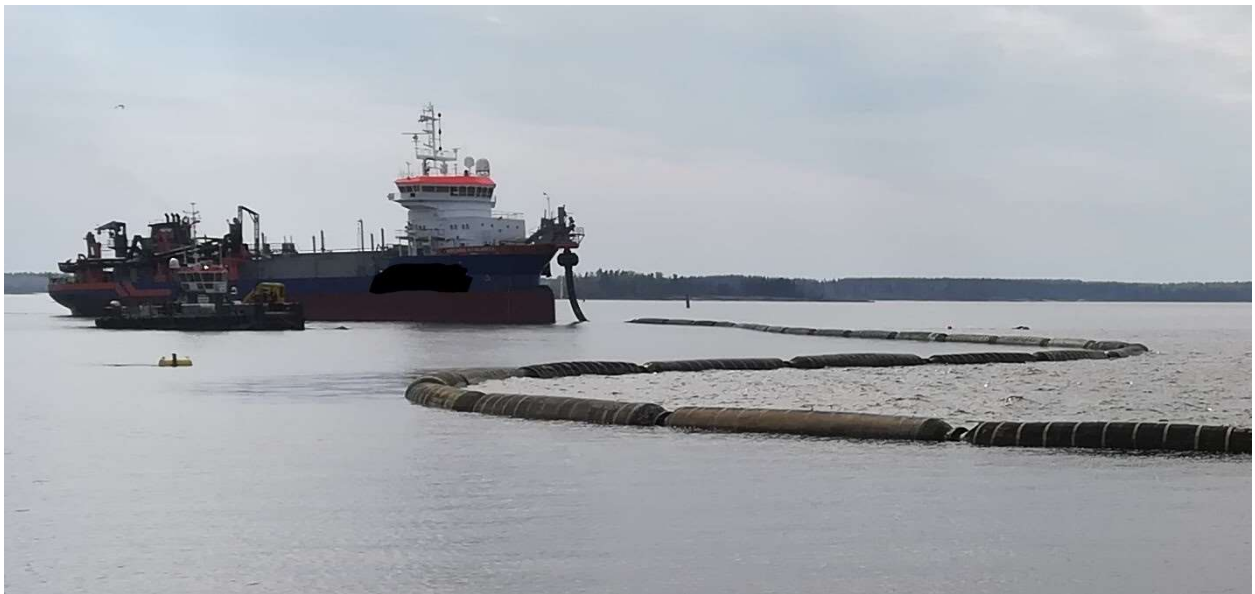
KUVA 2. Imuruoppaaja

Kuvassa 2 esiintyy imuruoppaaja (hopper), työlautta ja kelluva purkuputki, jota pitkin imuruoppaajan ruumassa olevaa ruoppausmassaa pumpataan läjitysaltaaseen.