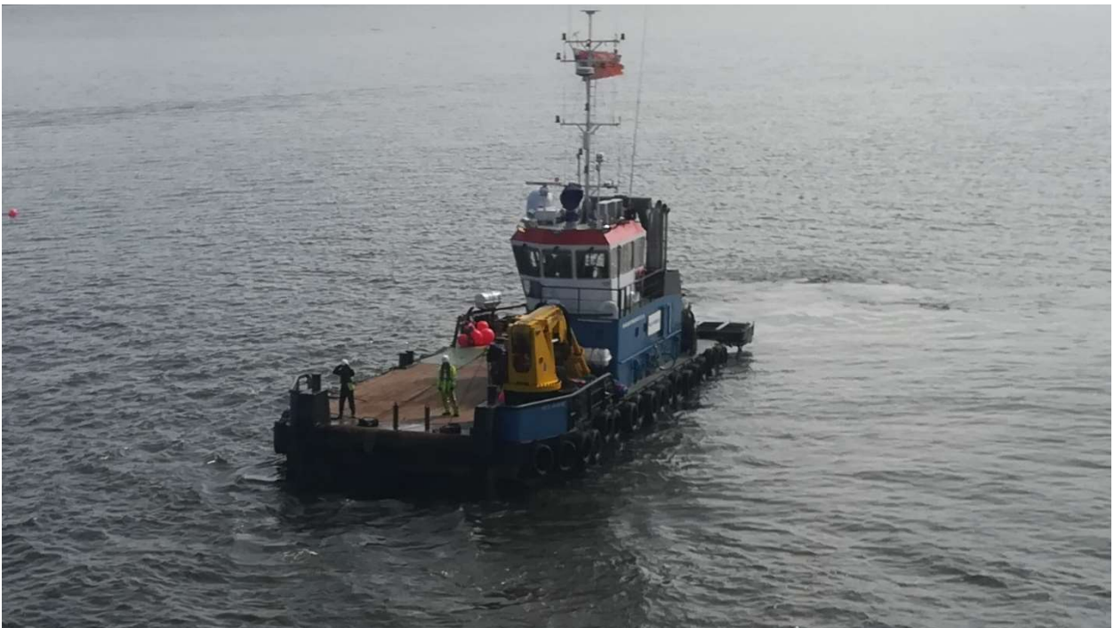
KUVA 5. Työlautta

Nostureilla varustetut työlautat toimivat monessa eri tehtävässä mukana. Näitä voivat olla mm. lanaus, imuruoppaajan kelluvan purkuputken kiinnitys, sukeltajien avustaminen ja turvalaitteiden asennustyöt. (Kuva 5.)