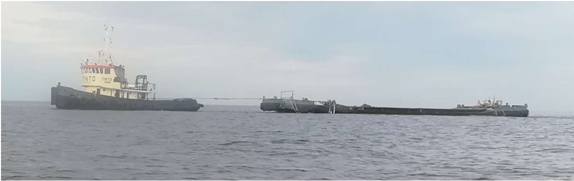
KUVA 4. Hinaaja sekä hinattava proomu

Hinaajalla/ työlautalla voidaan suorittaa myös lanausta, jolla saadaan viimeisteltyä ruoppausjälkiä tasaisemmaksi pinnaksi. Lanaukset pitää ajoittaa tyynelle merisäälle.