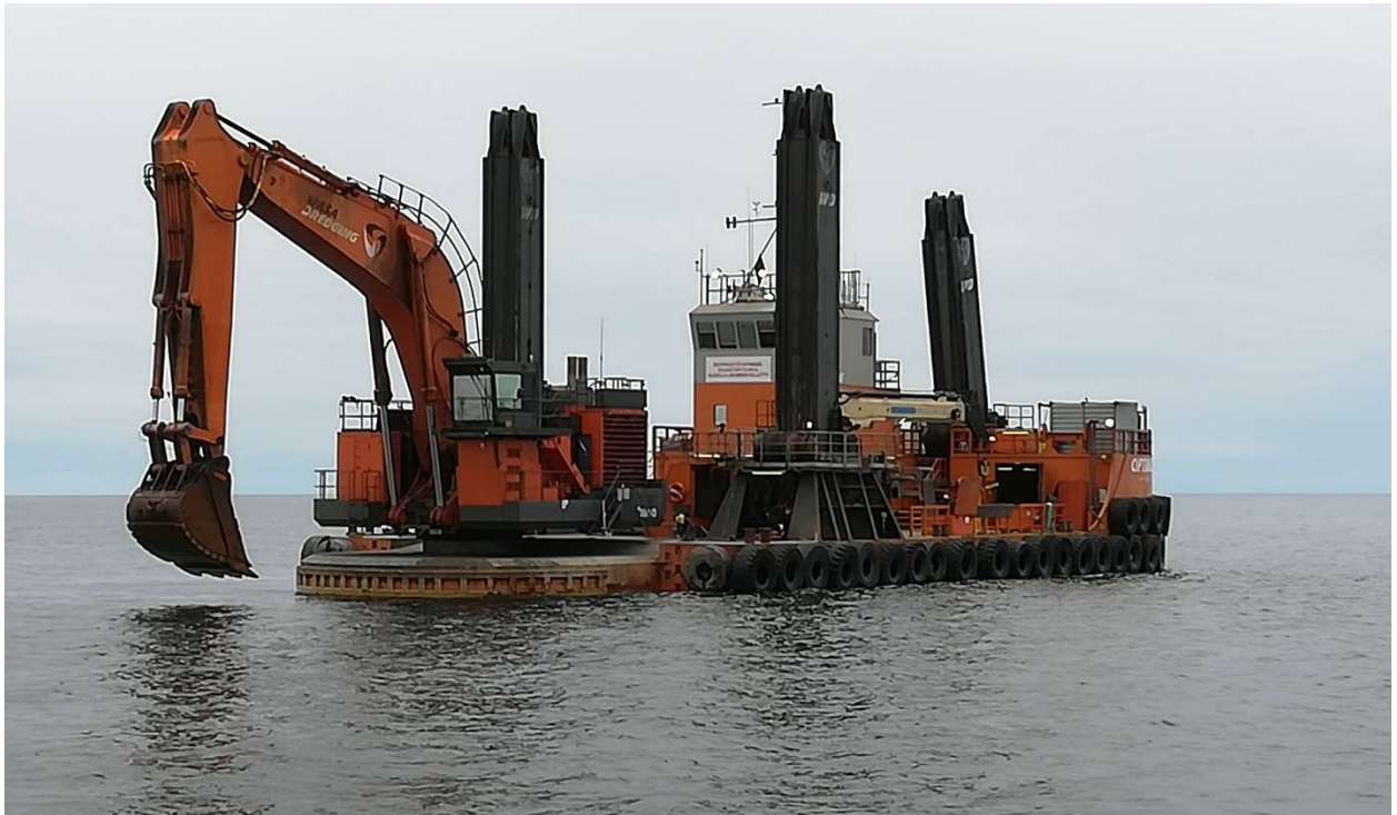
KUVA 1. Kuokkaruoppaaja