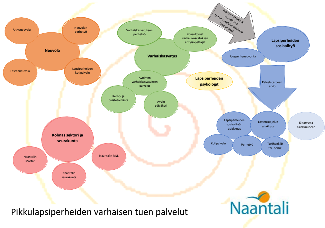
Kuva 4. Palvelukartta

pois palveluiden sisällön esittelyn. Käytimme visuaalisia keinoja kuten värejä, nuolia ja etäisyyksiä kuvastamaan palveluiden keskinäisiä suhteita. Neuvola ja sen alaiset palvelut merkitsimme oranssilla värillä, varhaiskasvatuksen ja sen alaiset palvelut vihreällä sekä lapsiperheiden sosiaalityön ja sen alaiset palvelut sinisellä. Lapsiperheiden psykologit merkitsimme keltaisella värillä varhaiskasvatuksen ja lapsiperheiden sosiaalityön läheisyyteen. Muita kuin kunnallisia palveluita tarjoavia tahoja merkitsimme punaisella, hieman erilleen muista palveluista.