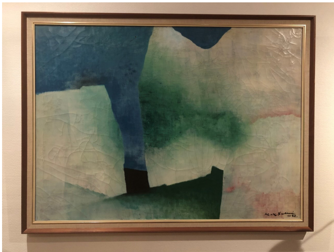
Kuva 24. Max Salmi, Valkoiset kalliovuoret. 110 x 80 cm (Laine, L.).

Jääkarhut ovat jo pitkään kiehtoneet minua, ja olen kuvannut niitä taiteessani eniten muihin lajeihin verrattuna. Kaikki lähti ideasta, joka syntyi Max Salmen jäävuorta kuvaavan maalauksen inspiroimana. Kyseisessä teoksessa minua puhuttivat värien käyttö, sekä jäävuoren symbolisuus. Teos ei kulunut katsoessa, vaan herätti minussa kerta toisensa jälkeen ajatuksia jäätiköiden sulamisesta. On myös ollut jälkikäteen mielenkiintoista huomata, kuinka kyseisen teoksen värimaailma toistui alitajunnan ohjaamana pitkään teokssani.