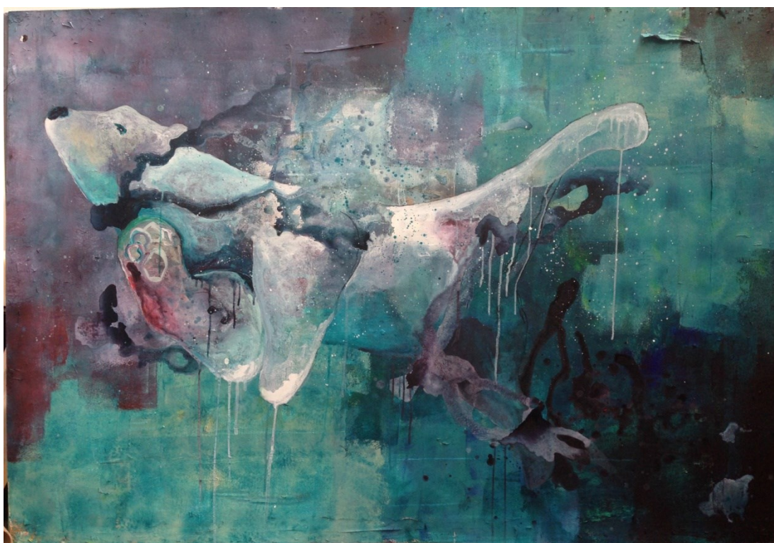
Kuva 25. Ruled by greed, 2017. Akryyli levyllä, 140 x 200 cm (Laine, L.).

olisi jääkarhu. En kuitenkaan ole missään kohtaa halunnut tehdä klassista kuvaa jääkarhusta sulavan jäälautan päällä. Suureen merkitykseen on noussut jääkarhun elinympäristön kuvaaminen muilla keinoin. Olen pyrkinyt luomaan teoksissani taustan mahdollisimman abstraktina, jotta katsojalle jää enemmän vapautta luoda mielikuvia eläimen ympäristöstä. Olen värien ja jäljen kautta pyrkinyt luomaan viitteitä eläimen ahdingosta sekä ympäristömyrkyistä kuten öljylautoista. Minulla oli myös vaihe, kun kuvasin jääkarhun leijaillemaan avaruuteen. Koetin tällä luoda perspektiiviä, ajatuksia katoavaisuudesta ja merkityksestämme maapallolla. Avaruus oli myös symbolina tuntemattomalle, äärettömyydelle ja hiljaisuudelle.