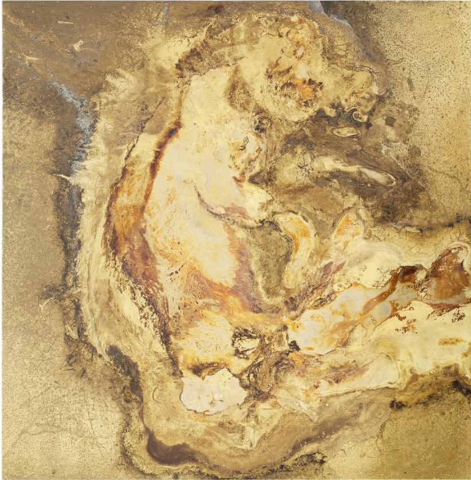
Kuva 27. Toni R. Toivonen, Life within, 2014. Messinki, alkuperäiset jäänteet kuolleesta eläimestä, 40,5 x 40 cm (Tiainen).

kun katsoja saa selville materiaalit joiden kautta teeman. Toisin sanoen, teos ei ensimmäisenä huuda kuolemaa, vaan vasta sen jälkeen kun on saanut katsojan pauloihinsa.