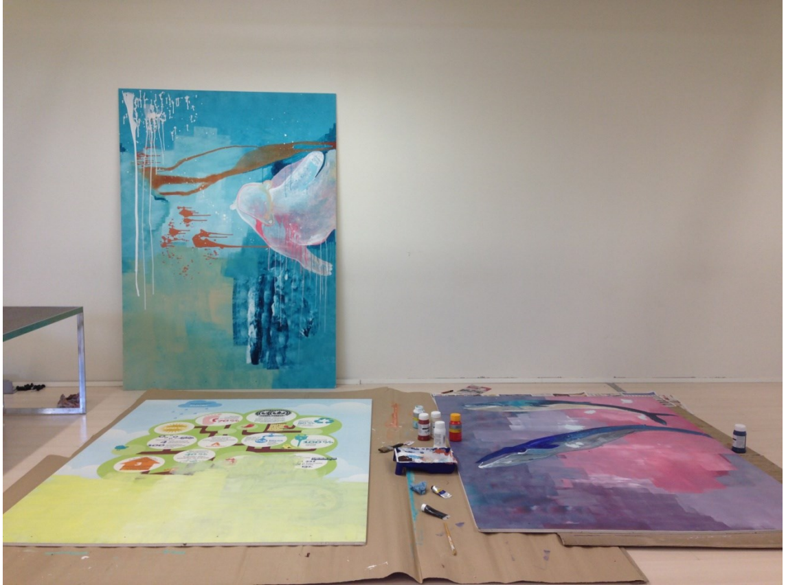
Kuva 21. Prosessikuva (Laine,L.).

Pohjien ollessa niin valtavia päätin työstää niitä asettamalla ne vaakatasoon lattialle. Saadakseni peitettyä mahdollisimman suuren pinnan käytin nyt ensi kertaa telaa muuhun kuin seinien maalaamiseen. Huomasin, että telan pinta jätti pintaan erilaisia jälkiä riippuen maalin paksuudesta sekä telaamiseen käyttämästäni voimasta. Kevyempi painallus sai vain telan ulommat kohdat koskemaan pintaa jättäen ikään kuin repaleista jälkeä, kun taas erittäin voimakkaasti painaessa, maalin sai liukumaan sileänä pohjaa pitkin. Hain osassa kohtaa teosta lisää sävyjä valmiiksi sekoittamieni värien lisäksikaatamalla paksut kerrokset kahta eri sävyä sekoittamatonta maalia suoraan maalaus pohjalle, jotka sitten sekoittuivat telan pyyhkiessä niiden ylitse. Sain näin pelkillä väreillä ja sävyeroilla sekä erilaisilla pinnoilla luotua taustaan illuusion syvyydestä, jäästä ja merivirtauksista.