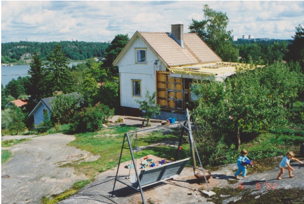
Kuva 4. Kodin rakennusta vuonna 1992 (kotialbumi).

On kaikki sinulle vain omaisuutta ja valtaat nimiin kaiken minkä näät vaan tiedän jokaisella olennolla elämä ja henki on sisällä