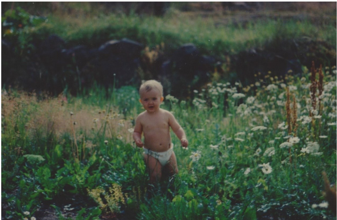
Kuva 2. Minä kotipihalla.

Lapsuuden kotini sijaitsi metsän laidalla korkealla kalliolla. Keittiön ikkunasta katsoimme usein äidin kanssa lintujen lentoa sekä Pitkäsalmessa lipuvia veneitä. Muistan yhä, miltä pihalla tuoksui, mereltä ja omenoilta. Vanhempani ostivat tontin vuonna 1987, jolloin pihalla seisoivat vanha mummonmökki, jonka pohjalta isäni rakensi silloisen kotimme. Lähimetsä oli itselleni tärkeä. Taitaa olla edelleen. Siellä leikittiin, sinne piilouduttiin. Sieltä haettiin sammakonkutua, jota kotipihalla sitten ihmeteltiin. Siellä ulkoilutin koiria, ja sieltä käytiin joka joulukuusi isän kanssa varastamassa kuusi kotiin kinokissa kahlaten (kyllä, lapsuuteni talvet olivat Etelä-Suomessa runsaslumisia). Sinne tehtiin majoja, kätettiin veljen kanssa sammalpeittoihin ensimmäiset kaljat, jotka sopivalla hetkellä kaivettiin esiin ja tietenkin juotiin. Väitän ja uskon, että kasvuympäristöni on ollut luomassa pohjaa tämän hetkiseen kunnioitukseeni eläimiä ja luontoa kohtaan.