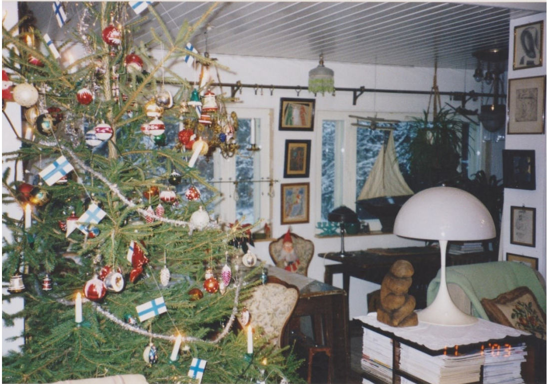
Kuva 9. Joulu 2003 (kotialbumi).

Kuten olen jo maininnut, isäni harrasti taiteen keräämistä. Kerääminen oli, ja on edelleen, isälleni obsessio. Teoksista käytiin muiden keräilijöiden kanssa kauppaa, ja kotimme seinät olivat kuin iäti vaihtuva taidenäyttely. Jotkut teoksista roikkuivat seinillä vain muutamia kuukausia, joistain ei luovuttu silloinkaan, kun ei ollut rahaa laskuihin. Tämä pakonomainen tarve materiaalin omistukselle meni kaiken edelle. Haluan korostaa, että vanhempani eivät olleet suurituloisia. Muistan päivän, kun isäni saapui kotiin barokin ajan kaapin kanssa. Siitä syntyi riita vanhempieni välille. Sitä jatkuvaa riidan ja huudon määrää oli hyvä paeta metsään tai kotipihalle. Tavaraa oli enemmän kuin kotimme neliöt antoivat myöden, joten sitä säilytettiin myös pihalla pressujen alla, joskus jopa vuosia. Sieltä löytyi hyviä piilopaikkoja. Muistiini ei palaakaan enää tuoksu merestä ja omenoista, vaan auton raadon ruosteisista ovista ja homeisista penkeistä.