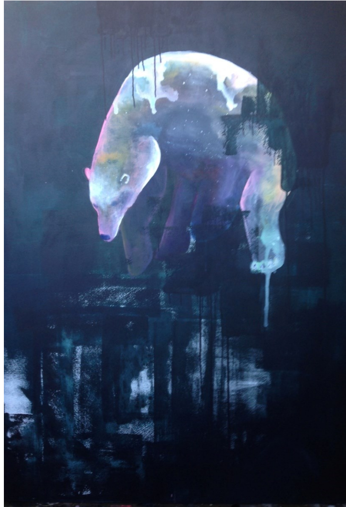
Kuva 28 Ja yöksi jää avaruus, 2018. Akryyli kankaalle, 160 x 120 cm (Laine,L.).

ensimmäisenä esiin, vaan vasta esteettisen hurmoksen jälkeen, joilloin aihekin olisi helpommin lähestyttävissä.