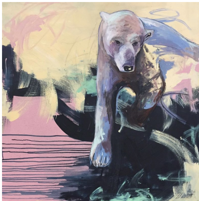
Kuva 29. Vaellus, 2019. Akryyli & hiili kankaalle, 100 x 100 cm (Laine,L.).