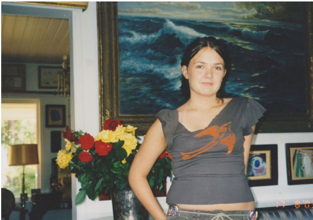
Kuva 8. Rippijuhlat kotona (kotialbumi).

Isäni elämä pyöri taiteen ympärillä, eikä hän kotonakaan juuri muusta innostunut kuin uusista hankinnoistaan. Isäni antama palaute töistäni ei kuitenkaan ollut sellaista, mitä olin odottanut. Hän poikkeuksetta tyrmäsi jokaisen teokseni yksi toisensa jälkeen, pahimmassa tapauksessa hän otti itse pensselin käteensä ja näytti, kuinka maalaus tulisi toteuttaa. Muistan tapauksen, kun olimme isovanhempieni mökillä. Minulla ja veljelläni oli siellä aina tapana piirtää lintuja lintukirjan kuvia apuna käyttäen. Yhteen piirrustuksistani isäni teki ”parannelmia” vahvistamalla linnun ääri viivoja, minulta mitään kysymättä. ”Muista, vapaat vedot”, totesi hän usein palautetta antaessaan. Aloin kapinoimaan tätä ajatusta vastaan keskittymällä pikkutarkkaan piirtämiseen ja esittävään maalaukseen. Tästä seurasi monen vuoden taistelu niin itseäni, isääni kuin abstraktia maalausta vastaan. Jokin sai minut kuitenkin jatkamaan taiteen tekemistä, sytyttäen lopulta mielenkiinnon myös abstraktia maalausta kohtaan.