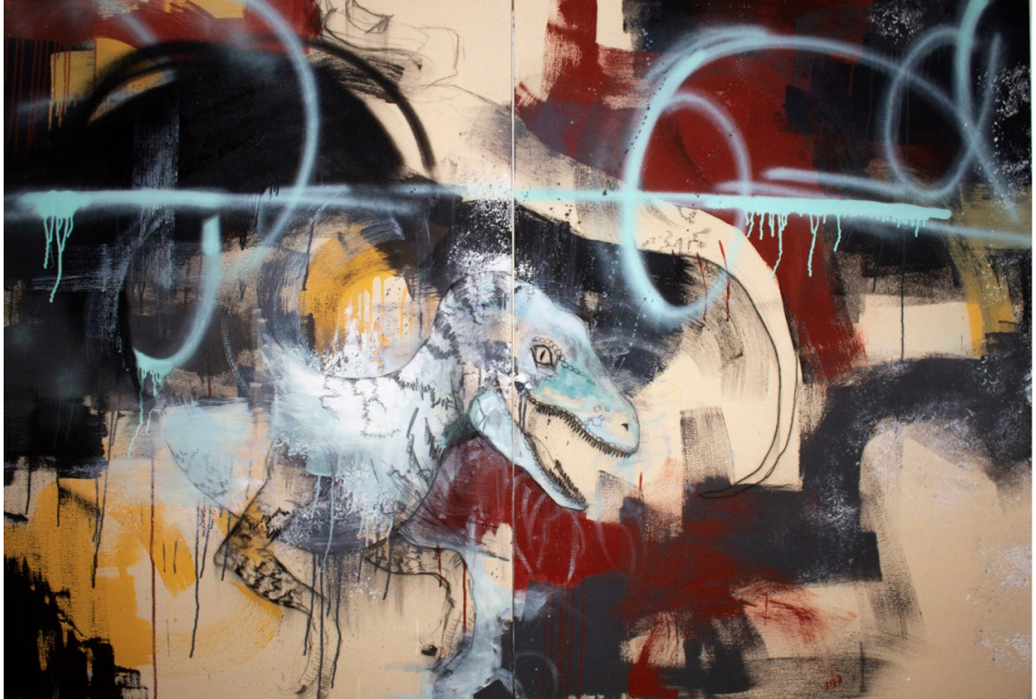
Kuva 23. How dinosaurs became extinct?, 2018. Akryyli, hiili & spraymaali kankaalle, 150 x 220 cm (Laine, L.).

ihmisiä. Syy miksi kyseisestä teoksesta tuli itselleni tärkeä, on että uskalsin kokeilla jotain, mikä tuntui aluksi vieraalta. Toiselle nämä riskien otot voisivat tuntua vähäpätöisiltä, omalla mittapuulla ne olivat suuria harppauksia taiteellisen kehitykseni kannalta.