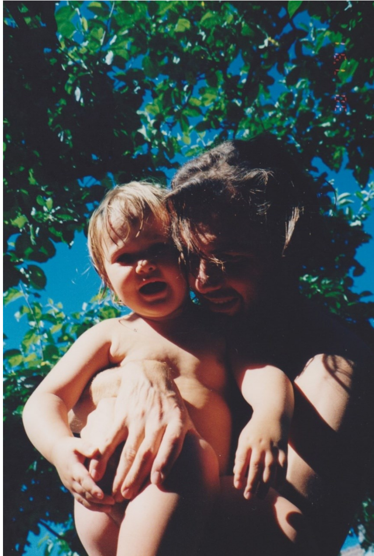
Kuva 7. Isän kanssa (kotialbumi).

Kiinnostukseni taiteen tekemiselle tulee kotoa. Isäni on aina kerännyt taidetta, ja kotimme seinät olivat tauluilla täyteen ahdattuja. Halusin tai en, minut altistettiin taiteelle. Lapsuudessa ja varsinkin varhasteini-iässä minua eivät niinkään kiinnostaneet itse maalaukset, vaan isäni innokkuus ja intohimo tiettyjen taiteilijoiden tuotantoa kohtaan. En täysin ymmärtänyt, mikä niissä kiehtoi, joten lähdin itse maalaamaan hakien näin ymmärrystä oman tekemiseni kautta. Olen terapiassa pohtinut usein perimmäistä syytä innokkuudelleni taiteen tekemistä kohtaan. (Tai no, ei-