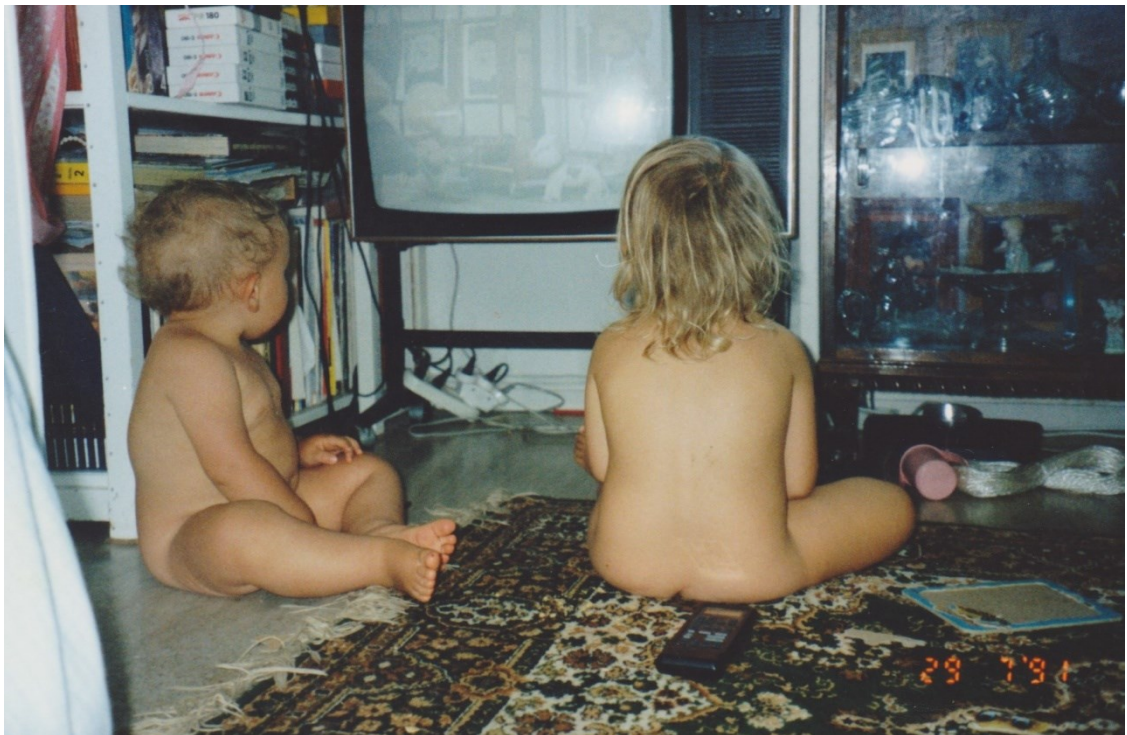
Kuva 11. TV:tä -91.

mantyyppiset kysymykset niin ulkopuolisilta tahoilta kuin minusta itsestäni. Miten ylipäättäen tullaan taiteilijaksi? Otetaanko sinut taiteilijana vakavasti ilman koulutusta? Mitä jos ei oteta kouluttautumisen jälkeenkään? Eikö riitä että voi pitää taiteen tekemisen harrastuksena? Eikö olisi järkevämpää kouluttautua ammattiin, joka työllistää? Lähinnä nykyään mietin: millä on oikeastaan mitään väliä? Ei kukaan täysjärkinen tätä rahasta tee vaan jostain käsittämättömästä sisäänrakennetusta halusta. Itse olen aina ollut huono puhumaan. Taide onkin muodostunut itselleni välineeksi keskustella ajankohtaisista asioista, saada myös oma kantani ja näkemykseni kuuluviin. Paneudun luvussa "Eläinten oikeudet taiteessani" tarkemmin siihen, miten olen asiaa tähän mennessä taiteessani käsitellyt.