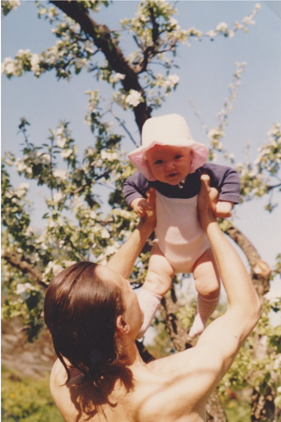
Kuva 1. Minä isäni kanssa kesällä 1989 (kotialbumi).