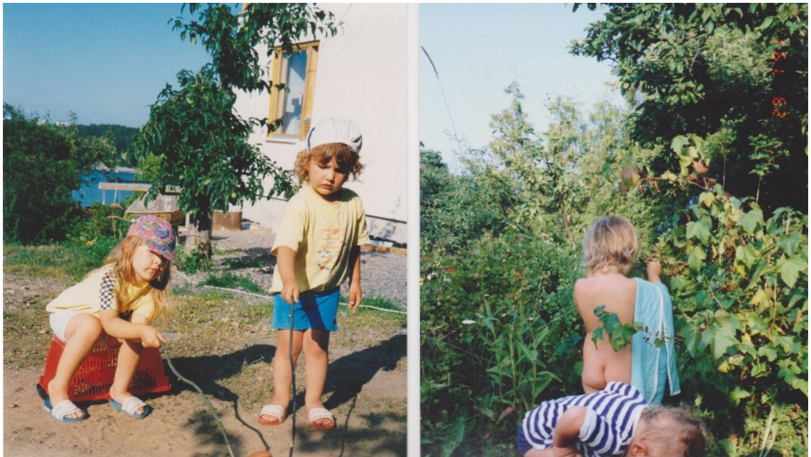
Kuva 13. Makkaran grillausta ja marjojen poimintaa.

Muistan hämärästi illan, jolloin ensimmäistä kertaa jouduin todistamaan eläimiin kohdistunutta väkivaltaa. Olin ala-asteikäinen, ja katsoin televisiota olohuoneen lattialla. Elokuvasssa tulee kohtaus, jossa mies potkaisee pientä valkoista koiraa. Tämä aiheutti minussa voimakkaan tunnereaktion, jota seurasi hysteerinen itkukohtaus. Muistan äidin rauhoitelleen minua sanoen, että kohtaus oli näytelty eikä koiraa oikeasti sattunut. Itku ei kuitenkaan loppunut, koska ajatus eläimen satuttamisesta jäi pyörimään mieleeni. En voinut ymmärtää, miten joku voi kohdella eläintä väkivalloin. Tämä on asia, mitä en voi edelleenkään käsittää. Väkivalta ja raaka kohtelu ovat laajoja käsitteitä, jonka kukin mieltävät tavallaan, arvoistaan riippuen. Olin lapsena ihan samanlainen maidonläträäjä ja nakkien suurkuluttaja, kuten valtaosa muistakin 80-luvulla syntyneistä lapsista, tosin silloin tietoisuuteni eläimiin kohdistetusta räökkäämisestä oli erittäin suppea. Elin tuolloin vielä vahvasti siinä mallissa, missä lemmikkieläimet erotetaan muista eläimistä.