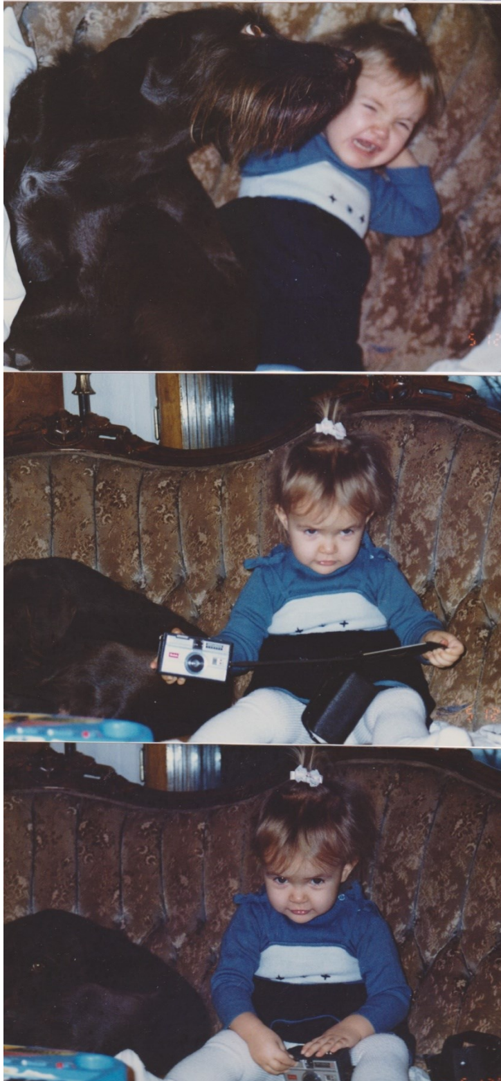
Kuva 15. Ei aina niin iloinen pikku eläinten ystävä.