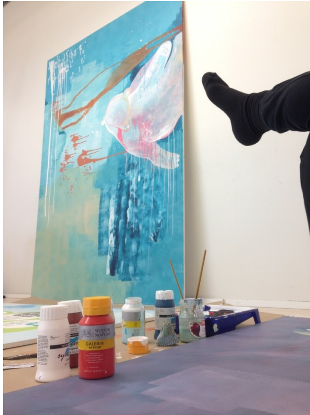
Kuva 22. Prosessikuva II (Laine,L.).

Halusin kokeilla toisenlaista maalaustekniikkaa eläinhahmoissa. Tein aluksi hyvin ohuen maalikerroksen, jota hinkkaamalla sain aikaiseksi tasaisemman jäljen, missä siveltimenvedot eivät näkyneet. Kaadoin erikokoisille alueille vedellä ohennettua akryylimaalia hahmon ääriviivojen sisällä. Veden määrää lisäämällä sain säädeltyä maalin läpinäkyvyyttä. Mitä paksumpi seos, sen vähemmän tausta pääsi kuultamaan läpi. Joiltain alueilta halusin maalin valuvan myös hahmon ääriviivojen ylitse. Valumaefektin sain nostamalla pohjaa vuorotellen sen eri kulumista. Kun valumat saavuttivat mieleiseni position, oli työ asetettava takaisin vaakatasoon. Tämäntyyppinen työskentely vaatii useamman tunnin kuivumisajan, joten tehokkuuden maksimoimiseksi oli jälleen hyvä havaita useamman teoksen yhtäaikaistyöstämisen edut. Hidas kuivuminen mahdollisti myös pidempiaikaisen maalinkäsittelyn. Värejä pystyi sattumanvaraisesti sekoittamaan kaatamalla niitä päällekkäin. Vasta maalin kuivuttua oli mahdollista nähdä, mitä väreille ja kuvioille oli