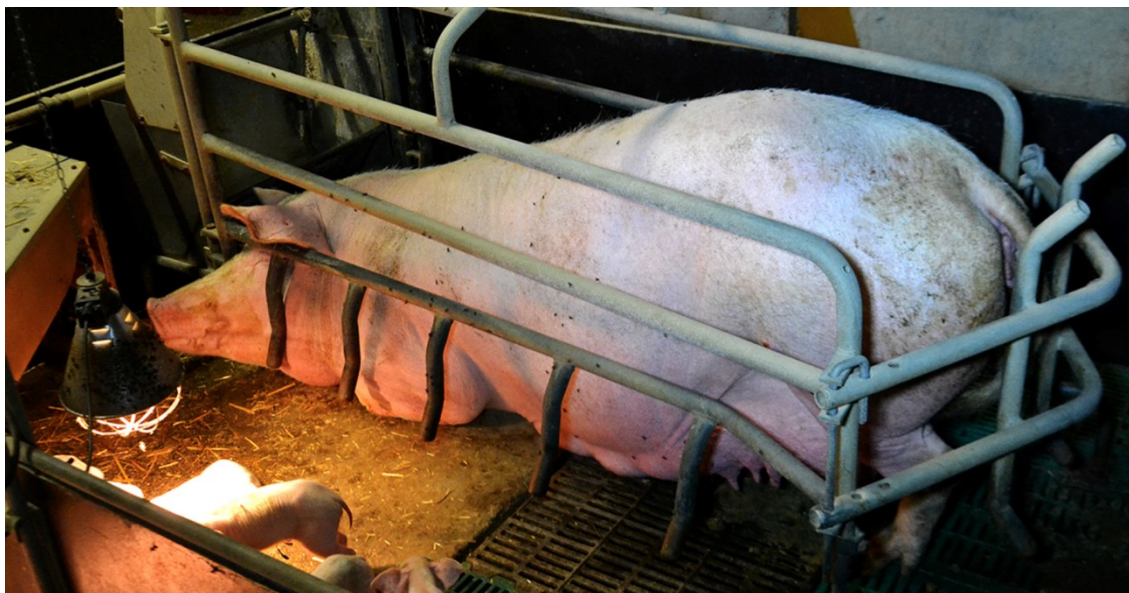
Kuva 16. Porsitushäkki (Oikeutta eläimille 2017).

Perehdyin Atrian nettisivujen sikatiloista kertovaan osioon. Nettisivuilla on listattu kysymyksiä muun muassa tehotuotannon ja tehokkaan tuotannon erosta, sikojen hyvinvoinnista sekä liikkuvuusmahdollisuuksista. Vastaukset oli kirjoitettu siloteltuun sävyyn, totakai. Atria vastaa tehotuotantoon, ettei kannattavuuden maksimointia eläinten hyvinvoinnista välittämättä tapahdu heidän tilallaan. Vastauksissa myös kerrottiin, kuinka lajityypillinen käyttäytyminen taataan antamalla sioille leluja, sanomalehtiä, olkia ja turveta tongittavaksi ja tutkittavaksi. Liikkumiseen liittyvään kysymykseen on vastattu kertomalla, kuinka suurin osa sioista saa liikkua vapaasti koko elämänsä ajan. Porsimisaika on yksi poikkeuksista, ja silloinkin halutaan vain taata porsaiden turvallisuus, ettei emo pääse tallomaan niiden päälle. Saparosta puhutaan suomalaisena ylpeyden aiheena. Sitä ei poisteta suomalaisilta sioilta, mikä tekee lihasta eettistä. Sapiro toimii myös hyvinvoinnin mittarina. Häiriökäyttäytyminen näkyy sioilla kannibalismina, jolloin sika syö toisen sian sapiroa. Aiemmin mainitut virikkeet ja vapaus liikkua estävät kuitenkin häiriökäyttäytymisen, eikä sitä tapahdu kuin harvoin (Atria 2019, porsastilat). Jos tämä olisi ainoaa informaatiota, jonka tietäisin tuotantoeläimen kohtelusta, mielikuvani siitä olisi oikeinkin levollinen. Liha on eettisesti tuotettua, siat saavat liikkua vapaina, niillä on leluja, ja pikku porsaidenkin turvallisuus on taattu.