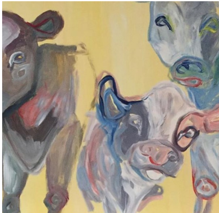
Kuva 19. Yksityiskohta teoksesta Hyötytalous (Laine,L.).

Vuodelta 2014 oleva ”Hyötytalous”-niminen teokseni on hyvä esimerkki siitä, miten voi epäonnistua tavoitteessa saada katsoja pohtimaan ihmisen eläimelle aiheuttamaa kärsimystä. Kyseisen teoksen kohdalla tarkoitukseni oli luoda visuaalisesti kaunis teos vakavasta aiheesta tuoden sisältö esiin nimeämisen avulla. Tarkoitukseni oli piiloviestittää kantani tuotantoeläinten kohtelusta eikä julistaa aihetta esimerkiksi kuvaamalla lehmä roikkumassa nilkastaan verta valuvana teurastuksen yhteydessä. Taulu on nyt sijoitettuna kotiin, missä se on asetettu vierekkäin lehmän taljan sekä lehmän nahalla päällystetyn jakkaran kanssa. Visuaalisuus eikä niinkään sisältö on tässä tapauksessa mennyt aiheen edelle. Lehmä-aihe taiteessa, on tosin hyvin kaupallistunut Miina Äkkijyrkän ja hänen Marimekolle suunnitteleminen tekstiileiden kautta. Väitän, että tästä joutuksen on haastavaa kuvata lehmää ilman, että mielikuvat assosioituisivat maalaisidylliin. Nimi ”Hyötytalous” antaa toki tilaa tulkinnan vapaudelle. Se ei suoranaisesti julista eläimen asemaa hyödyn välineenä talouden rattaissa. Jos voisin nimetä työn uudestaan, niin ”Hyötyeläin” avautuisi todennäköisesti katsojalle paremmin.