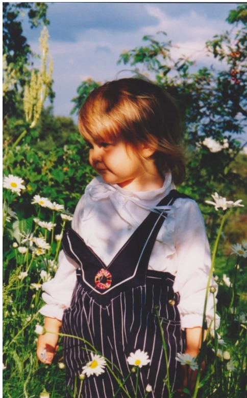
Kuva 6. Päivänkakkaroiden ihmetelijä (kotialbumi).