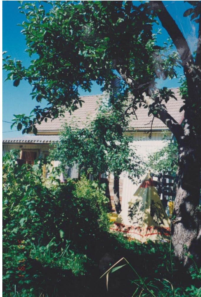
Kuva 3. Kotipiha.

Jos en huininut metsässä, tuijotin piirrettyjä. Nykypäivänä suhtautumiseni Walt Disneyn piirrosanimaatioihin on kriittinen, mutta lapsuuteni elin paljolti niiden kautta. Niissä eläinten ja esineiden inhimillistäminen on vahvasti läsnä. Erityisesti Pocahontas-elokuva on ollut lapsuuteni suurimpia vaikuttajia. Herkistyn edelleen sitä katsoessani, ja löydän itseni useasti ystäväni kanssa laulamasta elokuvan tunnuslaulua Tuulen värit. Kappaleen on säveltänyt Alan Menken, ja alkuperäisen sanoituksen ”Colors of the wind” on luonut Stephen Schwartz. Kappaleen sanat pohjautuvat luontoa ylistävään teokseen Intiaanipäällikkö Seattlen vastaus Suurelle Valkoiselle Päällikölle. Vaikka lapsena tuskin mietin sen syvällisemmin laulun sanoja, oli kuvallisella informaatiolla selkeä viesti: luontoa sekä sen eläimiä tulee kunnioittaa.