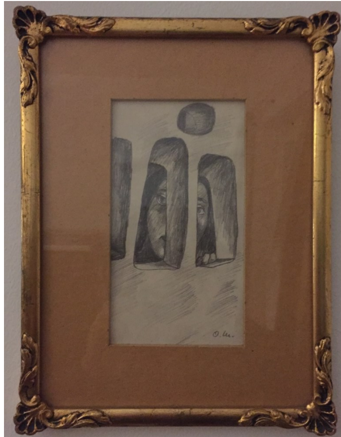
Kuva 12. Otto Mäkilän lyijykynäpiirros.

olisikaan käyttänyt. Olin inspiroitunut Otto Mäkilän piirustuksista. Eritoten niissä kiinnostivat surrealistiset rakennukset, joissa ihminen oli kuvattu. Kuvassa 12 oleva teos on yksi mieleenpainuvimpia. Muistan tulkinneeni kuvaa siten, että ihminen on vangittu ajatuksiinsa. Tiedä sitten, mistä tämä tulkinta oli peräisin. Ehkä hain heijastuspintaa teiniajan sekavaan ajatus- ja tunnemaailmaan. Muistan hämärästi, että meillä olisi ollut myös Mäkilän piirroksia, joista näki rakennukset kokonaisuudessaan, eikä pelkästään ikkunaa, kuten kuvassa (Kuva 12). Muistan myös piirroksia, joissa rakennus oli muovautunut ihmistorson muotoon. Piirustuksissa esiintyvät pyöreät reikäiset muodot toistuivat sen aikaisissa savitöissäni. Elin tässä lyijykynän mustavalkoisessa maailmassa aina vuoteen 2014 asti, kunnes innostuin väreistä ja akryylimaalin käytöstä.