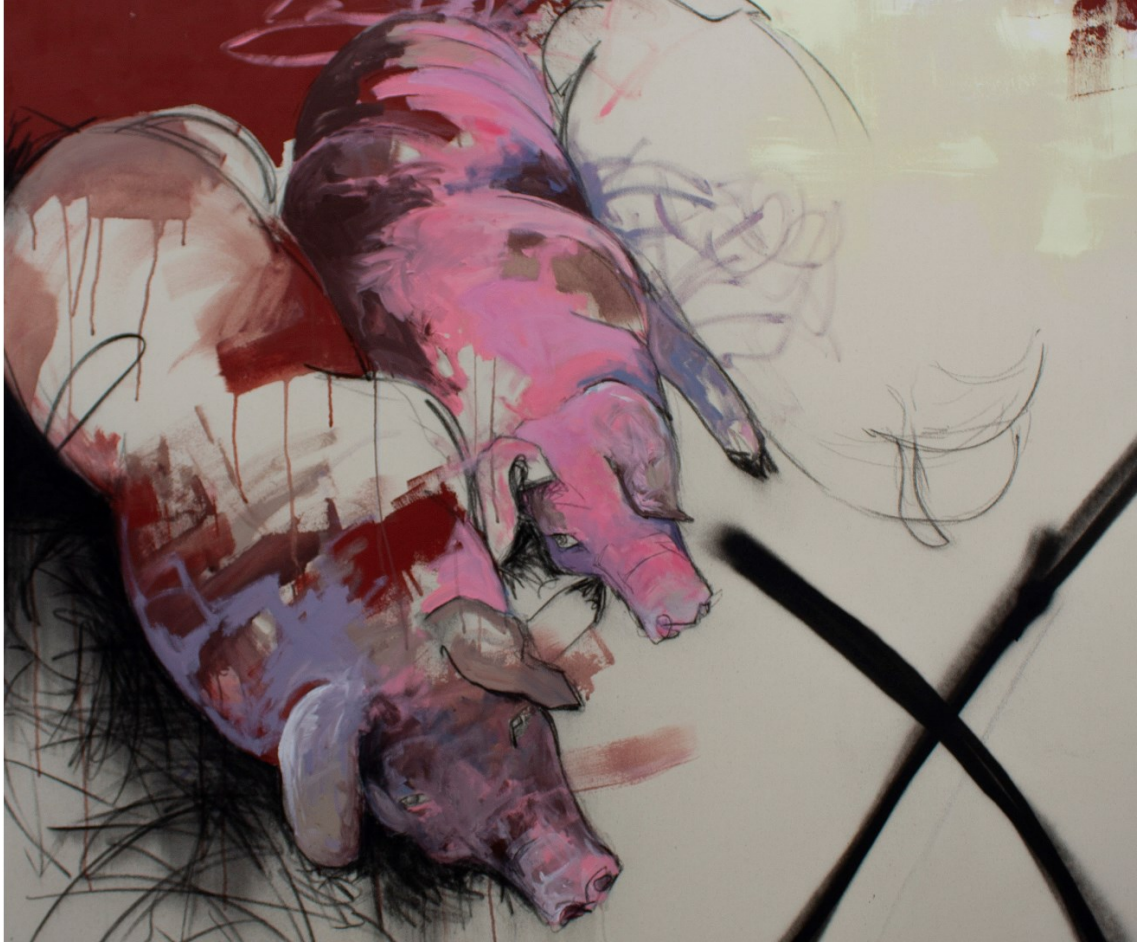
Kuva 18. Yksityiskohta teoksesta 3 § (Laine,L.).

Kolmannen opiskeluvuoden maalausjakson katselmuksessa, sain Teemu Mäeltä kritiikkiä edellä kuvatusta työstä. Ensin hän kommentoi oman tulkintani mukaan ivalliseen sävyyn, että työn nähtyään hän tulkitsi sen tekijän vegaaniksi. Hän myös kehotti minua pohtimaan, jospa käsittelisinkin taiteessani aivan jotain muuta aihetta ja keskittyisin eläinoikeusasioihin muilla elämäni osa-alueilla. Olen henkilökohtaisesti sitä mieltä, että niin taide kuin eläintenoikeudet ovat niin vahva osa omaa identiteettiäni, etten näe ainaakaan tässä kohtaa aiheelliseksi sitä, että vaihtaisin käsittelemääni aihetta. Tiedän koko ajan enemmän eläintenoikeuksiin liittyvistä epäkohdista, ja taide on väline käsitellä näitä turhautumisen tuntemuksia. Kyllä ajatus, tunne ja halu toisenlaisen aiheen käsittelyyn lähtee syvältä itsestäni, kun sen aika on.