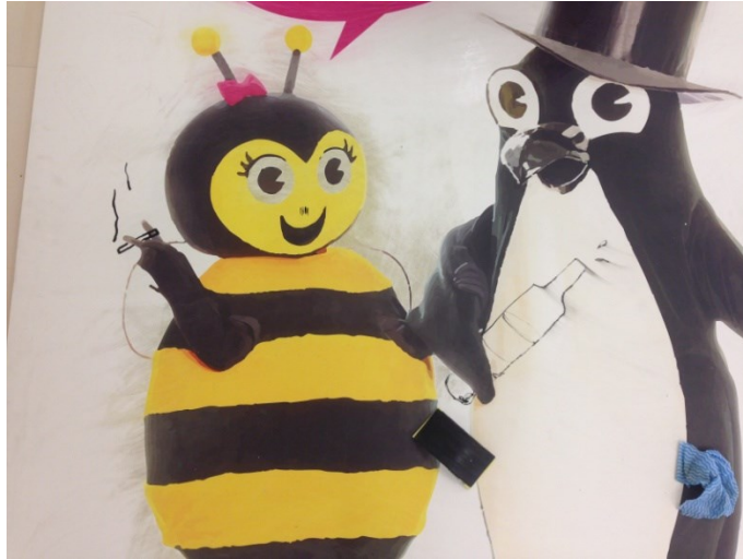
Kuva 20. Mainostaulun pohjakäsittelyä (Laine,L.).

metriä leveitä ja 2,5 metriä korkeita. Teokset tuli toteuttaa paikan päällä, ja aikaa työstämiseen oli 5 päivää. Nopea aikataulu, julkinen esillepano sekä valtavan kokoiset pohjat koettelivat paineensietokykyäni. Ymmärsin, että jos aion toteuttaa 3 teosta määrättyssä ajassa, minun tulisi keskittyä isoihin linjoihin, eikä jumittua aikaa vievään pikkutarkkaan maalausjälkeen.