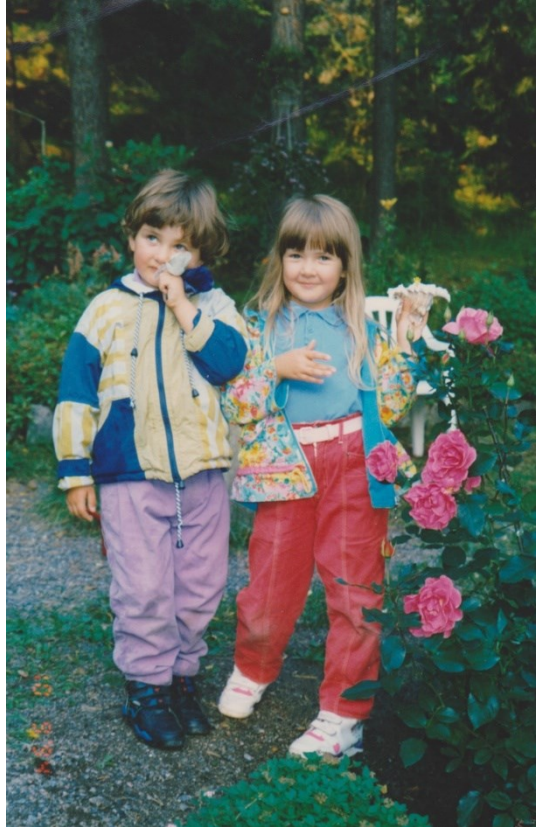
Kuva 10. Mamman mökillä veljeni kanssa (kotialbumi).