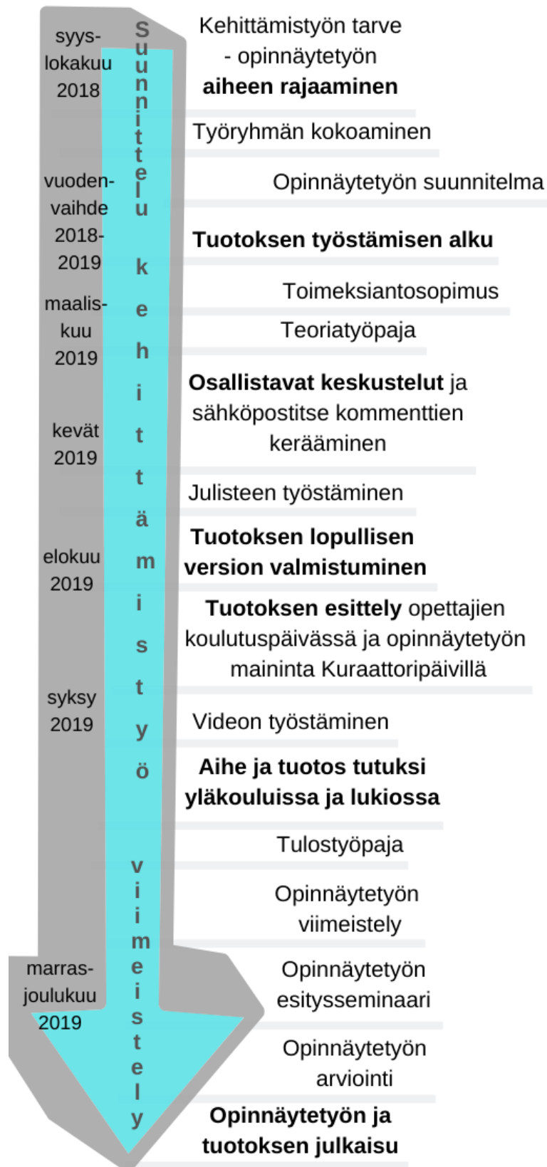
Kuvio 1. Opinnäytetyön prosessi.