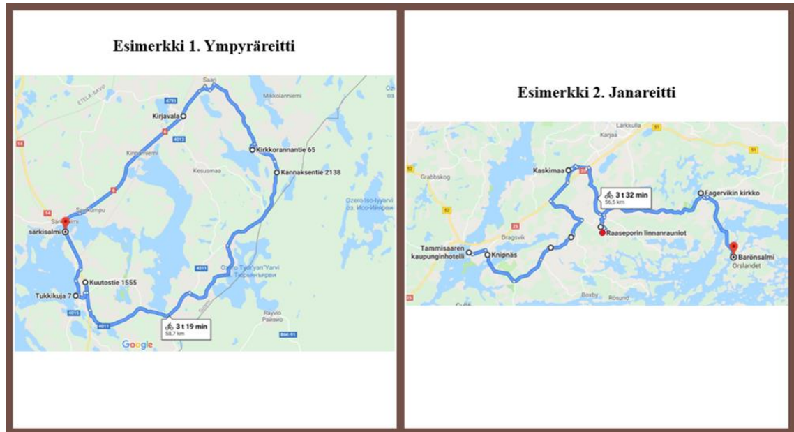
Kuva 1. Ympyrä- ja janareitti kartalla.

Kuten kuvasta 1 voi huomata, janareitti ei mene aina suoraa linjaa pitkin kohti määrän-päätä. Se saattaa puikkelehtia matkanvarrella paikasta toiseen. Joissakin tapauksissa reitti jopa saattaa ristetä matkan aikana, jonka jälkeen se palaa takaisin reitille. Tällaisia risteäviä tekijöitä voivat olla esimerkiksi nähtävyys tai taukopaikka.