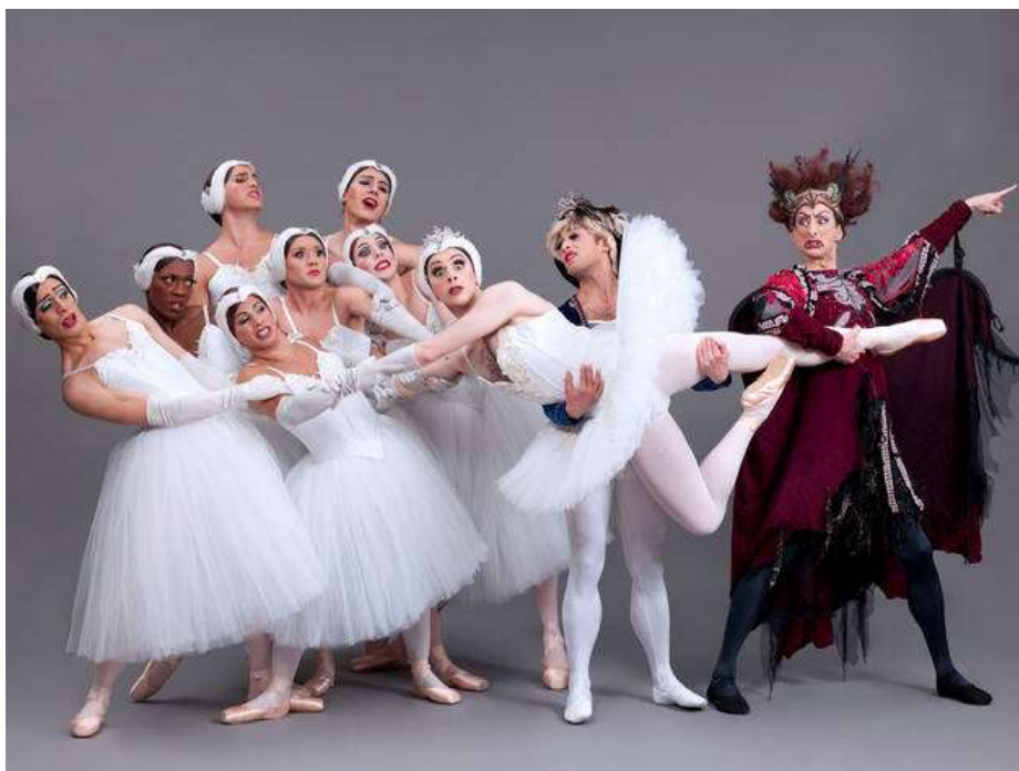
KUVA 1. Miestanssijoista koostuvan Les Ballets Trockadero de Monte Carlo -balettiseurueen tyyliä voidaan pitää campmaisena drag -taidemuotona.

Olen pitänyt drag queeneja kiehtovana kauan ennen RuPaul's Drag Race -ohjelman tuotua taiteenalan lähemmäs populaarikulttuuriin. Drag -artistien kyky muuntautua omasta henkilökohtaisesta persoonastaan tunnistettaviksi hahmoiksi ja luoda hankalista, herkistä ja jopa poliittisista aiheista etenkin esteettistä viihdettä on innoittanut ja muokannut vahvasti omaa tyyliäni paitsi arjessa että taiteilijantyössäni.