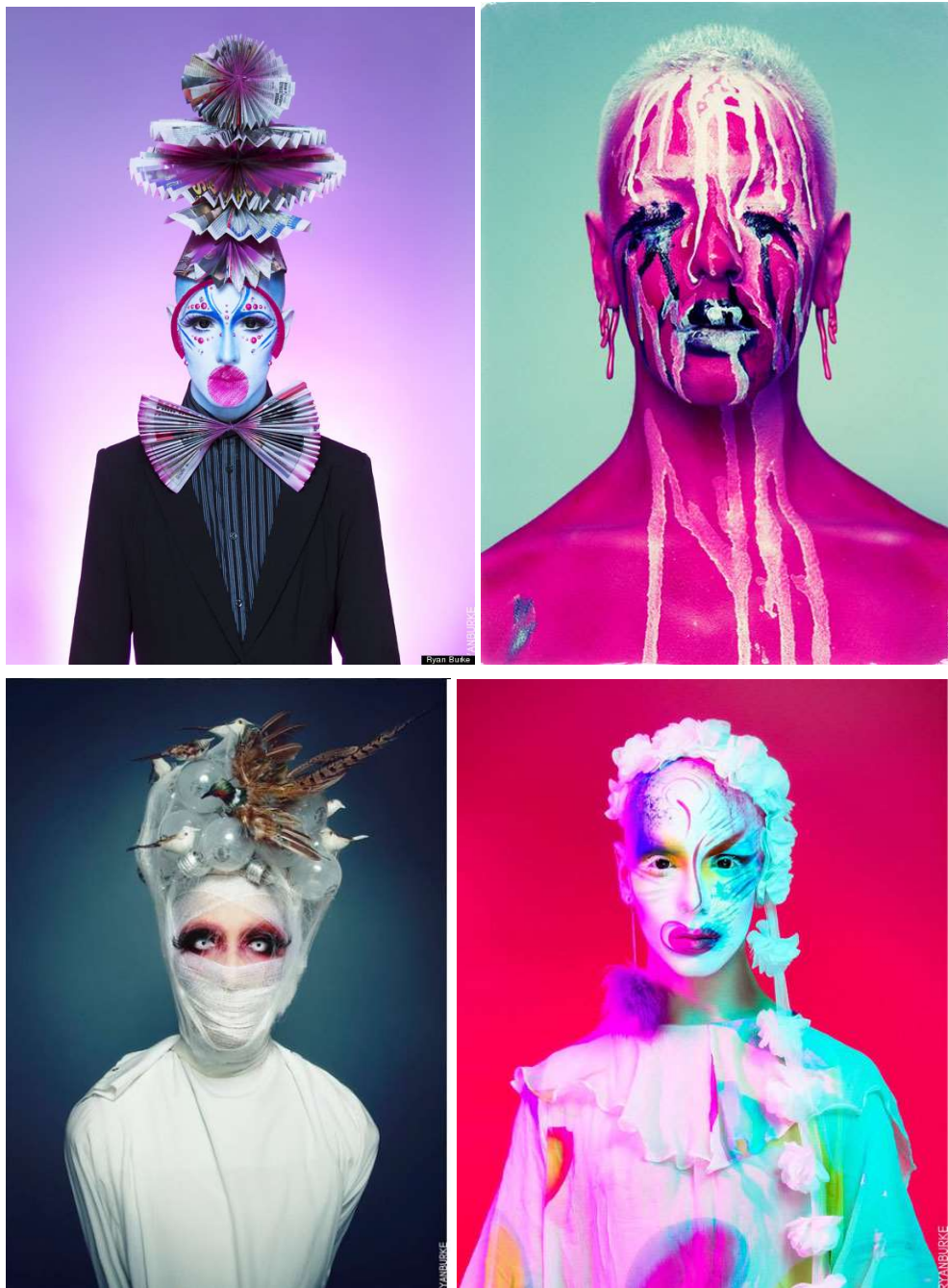
KUVAT 4, 5, 6 JA 7. Club Kid- tyyliä kunnioittaen visuaalisesti modernimpia ja pehmeämpiä luomuksia. (Kuvat: Ryan Burke).