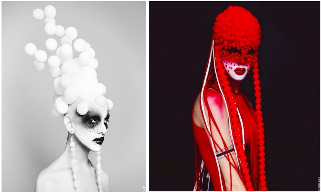
KUVAT 2 JA 3. Inspiraatio valko- ja punasoluihin.

Otan paljon vaikutteita artistien rohkeasta lavaenergiasta, olemuksesta ja heittäytymiskyvystä. Monien artistien repertuaariin liittyy olennaisesti vaatevalintojen ja meikin lisäksi aina jossain määrin myös liike ja liikkuminen. Tavoitteeni oli tätä mukaillen tuoda tanssiteos lavalle ottaen vastaavanlaisen aistien yltäkyläisyyden seikat huomioon. Näen teokseni kokonaisuuksina, joissa tanssin ja ilmaisun lisäksi haluan panostaa yhtä tarkasti myös puvustukseen, rekvisiittaan, meikkiin ja musiikkiin.