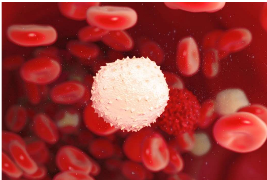
KUVA 9. Valkosolu punasolujen keskellä.

Koska tanssijat tulisivat esittämään itsenäisiä soluja ihmishahmojen sijaan, tahdoin haastaa tanssijat esiintymään kasvot peitettyinä. Haastoin samalla myös itseni, sillä ilmeet olisivat olleet yksi helppo tapa lisätä komediaa teokseen. Koska ilmeitä ei tulisi näkymään, kehonkielen täytyy merkitä vielä enemmän.