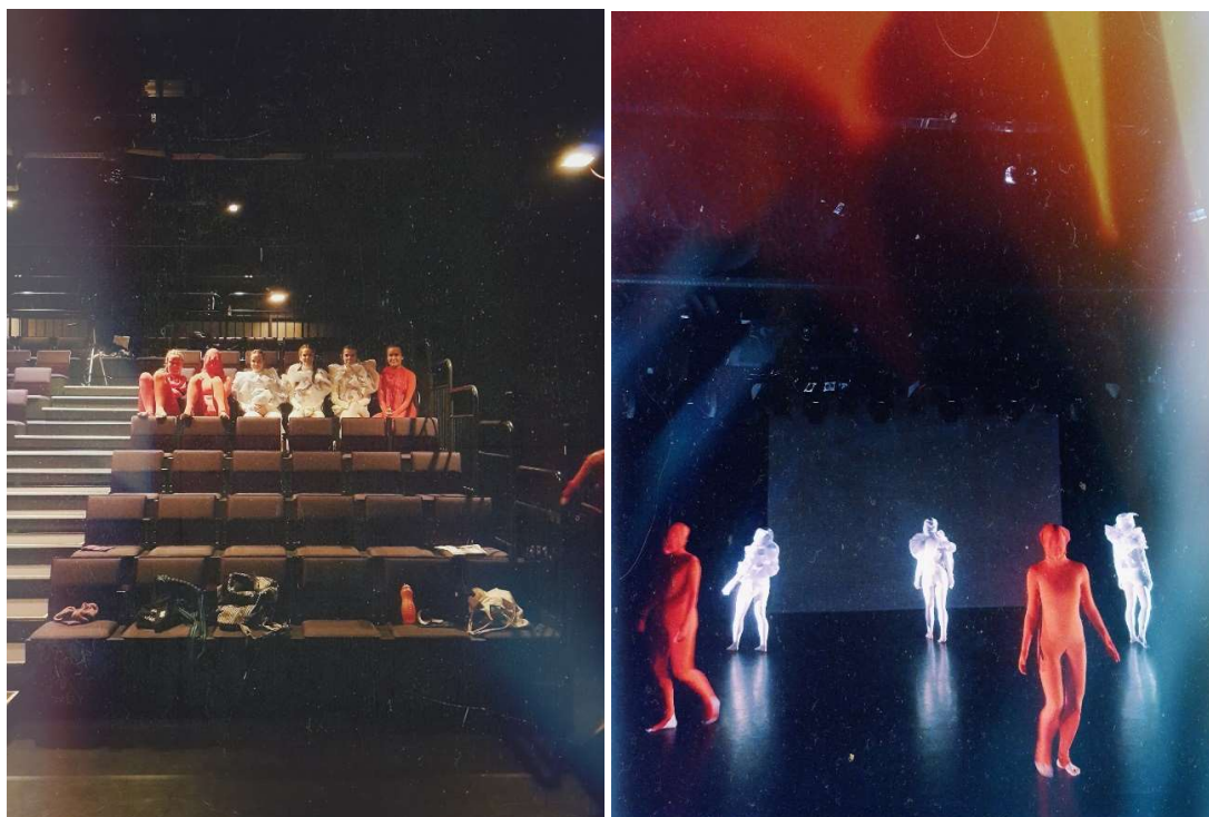
KUVAT 13 JA 14. Lähtölaukaus 2019 - festivaalin näytöspäivä Sotku-teatterilla (Laitinen 2019-3-2).