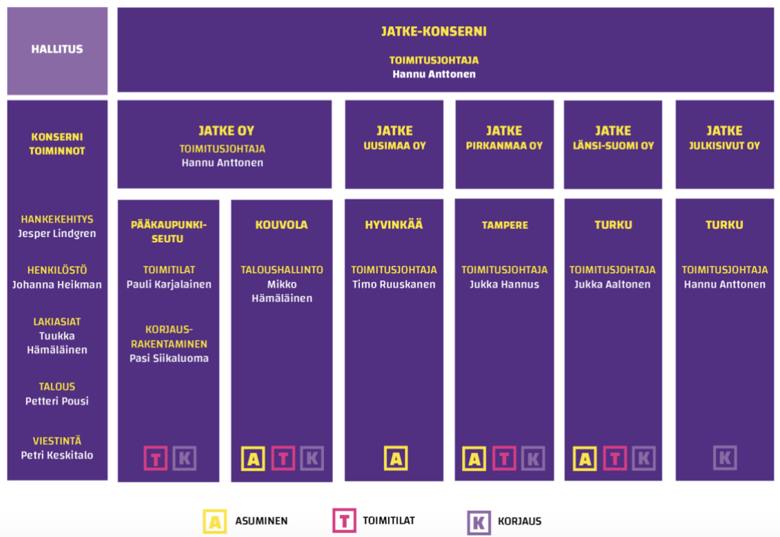
KAAVIO 2. Jatke Oy organisaatiokaavio (Jatke kotisivut 2019)