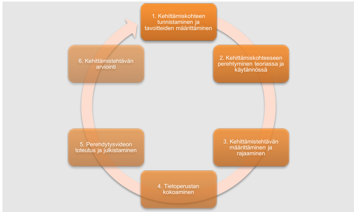
Kuvio 1. Kehittämistyön prosessi (Ojasalo ym. 2014)

syksyllä 2019. Opinnäytetyön prosessia kuvaillaan raportissa Ojasalon, Moilasan ja Ritalahden (2014) kehittämistyön prosessin mukaan. Kehittämistyön prosessi on esitetty kuviossa 1. Prosessin kautta tarkastelu auttaa järjestelmällisyydessä ja sen kautta on helppo ottaa huomioon ne seikat, jotka kussakin vaiheessa olisi hyvä tehdä ennen seuraavaan siirtymistä (Ojasalo ym. 2014: 21–23).