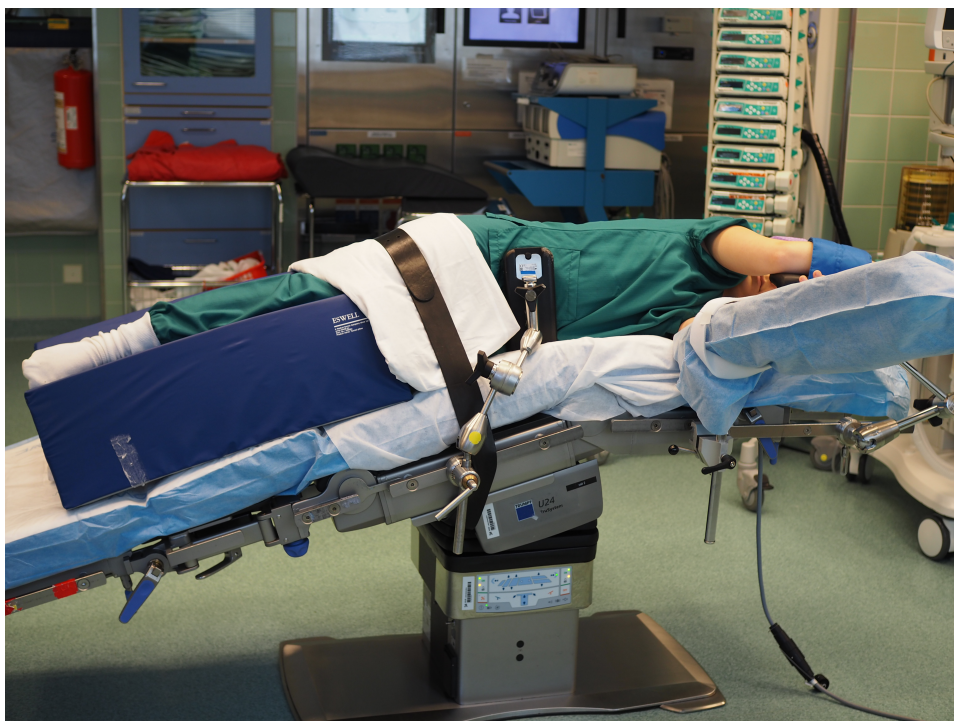
Kuvio 4. Kylkiasento.