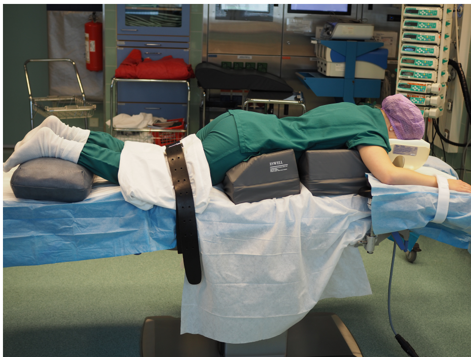
Kuvio 5. Vatsa-asento.