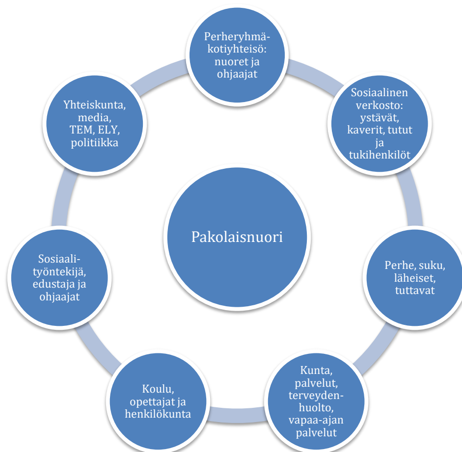
Kuvio 1. Pakolaisnuoren kotoutumista tukevat toimijat (Iisakkila 2019.)

Yksintulleiden kotoutumisen tukeminen perheryhmäkoteissa on yhteistyötä yhteiskunnan toimijoiden kanssa. (Kuvio 1). Suomessa on erilaisia perheryhmäkoteja, koska kunnissa toimitaan alueiden toimintaympäristön ehdoilla. Tämä tuo haasteita perheryhmäkotien laadun valvonnalle ja toiminnan yhdenmukaisuudelle Suomessa.