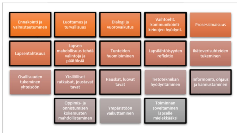
Kuvio 6. KESY ja Lapsen osallistumista vahvistavat tekijät kirjallisuudessa (Vänskä, Pollari & Sipari 2016, 36)

KESY:n avulla voidaan lisäksi kannustaa lasta ja keskustelusta saadulla tiedolla voidaan informoida sekä ohjeistaa muita aikuisia. Ikätoverisuhteita KESY-korteilla ei varsinaisesti tueta, vaikka niistä voidaankin keskustelussa saada tärkeää tietoa. Sama pätee lapsen osallisuuden tukemisessa yhteisöön sekä ympäristöön vaikuttamisessa. KESY:ssä itsessään ei näy prosessimaisuus, mutta sitä voidaan kyllä hyödyntää osana toimintaterapiaprosessia. Tietotekniikkaa ei vielä KESY:ssä hyödynnetä, mutta kehityskohteista puhuttaessa aineistossa esiin nousi kehitteillä oleva digiversio.