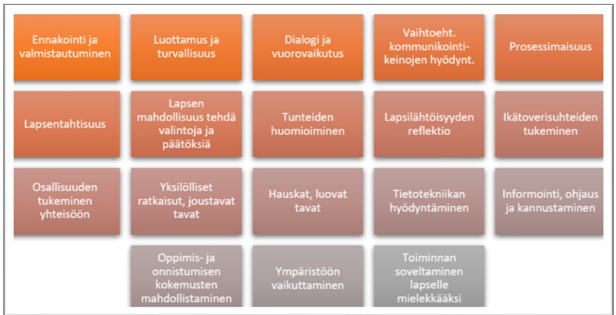
Kuvio 1. Lapsen osallistumista vahvistavat tekijät kirjallisuudessa (Vänskä, Pollari & Sipari 2016, 36)

Myös Bekken (2017, 486 - 487) on tarkastellut tutkimuksessaan lasten kuntoutuksessa toteutettavaa päätöksentekoa. Hän toteaa, että lapsen osallistaminen päätöksentekoon sosiaali- ja terveyspalveluissa on kompleksinen asia, johon vaikuttaa muun muassa ammattilaisten eri taustat, asiakkaan oikeudet sekä vanhempien näkemykset. Se, missä määrin lapsi asetetaan todellisen päätöksentekoprosessin keskipisteesseen vaikuttaa todennäköisesti voimakkaasti varsinaiseen lopputulokseen. Bekkenin (2017, 487) mukaan esimerkiksi ammattilaisten näkökannat lapsen kyvystä muodostaa omat käsityksensä vaikuttavat siihen, kuinka lasta kannustetaan ilmaisemaan mielipiteitään ja kuinka heitä kuunnellaan. Bekken (2017, 494) huomioi artikkelissaan myös ympäristön vaikutuksen lapsen osallisuuteen. Hänen mukaansa useiden aikuisten läsnäolo huoneessa voi vaikuttaa lapsen haluun kertoa omista asioistaan.