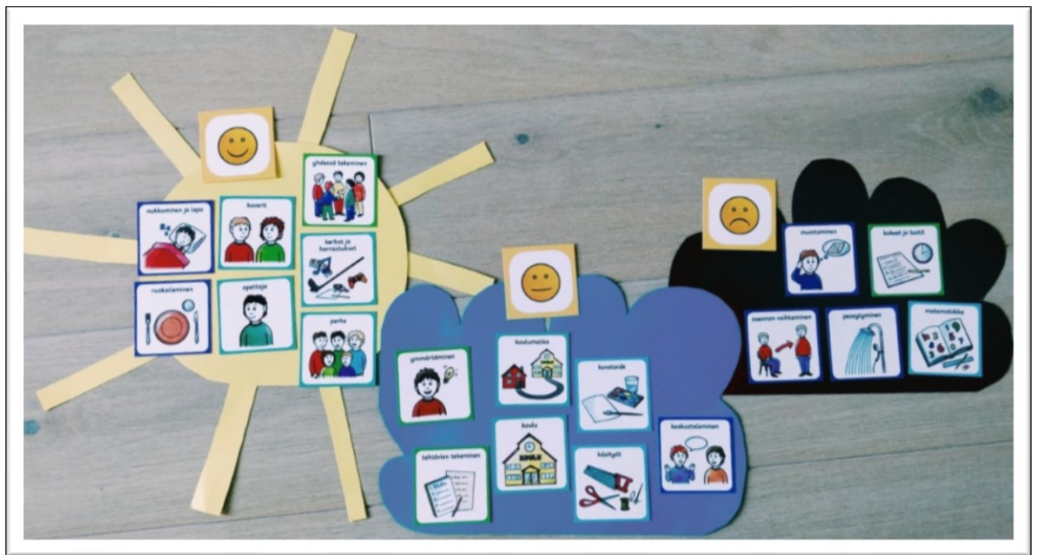
Kuvio 3. KESY-korttien käyttöesimerkki

KESY:ä pelatessa lapsi asettaa näihin osa-alueisiin liittyviä kuvakortteja alustoille, jotka kuvaavat lapsen mielipidettä kyseisestä aiheesta. Alustoja on yleensä kolme ja ne voidaan erotella toisistaan esimerkiksi erivärisin kartongein tai erilaisin muodoin. Alustat kuvaavat lapselle mielekkäitä, neutraaleja sekä epämiellyttäviä asioita. Lapsi saa itse määrittää, mitä kortteja hän kustakin osa-alueesta haluaa käyttää ja miten asettelee kortit. Alla olevassa kuviossa (Kuvio 3) on esitetty kolme alustaa, johon lapsi on asetellut haluamansa kortit eri osa-alueista. Aurinko kuvastaa mielekkäitä asioita, sininen pilvi neutraaleita asioita ja musta pilvi lapsen ikäviksi kokemia asioita.