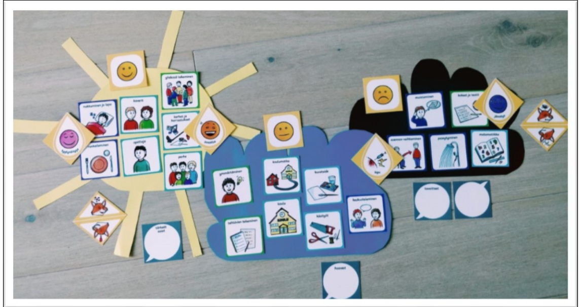
Kuvio 4. Esimerkkiin lisätyt tunne- ja kettukortit

lapsi kokee esimerkiksi asennon vaihtamisen hankalaksi, koska siitä aiheutuu hänelle kipua. Lisäksi kuvioiden vierelle on nostettu esiin kettu-kortit sekä puhekuplat haaveista, tärkeistä asioista sekä tavoitteista.