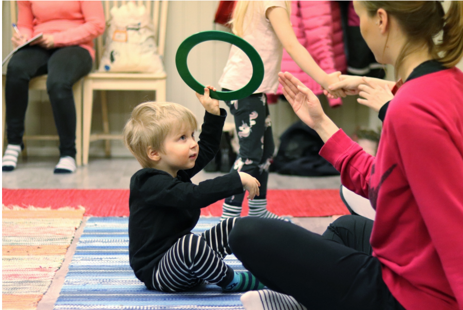
Kuva 3. Jongleerausrenkas.

Työpäiväkirjan havaintojen mukaan jongleerauksessa oli nähtävissä aluksi huivien sekä renkaiden kanssa vuorottelua aikuisella ja lapsella, erityisesti silloin kun parille jaettiin vain yksi, yhteinen väline. Havaintojen mukaan pallot olivat aluksi aikuinen-lapsi -pareille yhteistyötä haastavia, sitten merkityksellisiä ja lopussa omia välineen liikutteluideoita tuottavia. Havainnot kertovat mielestäni kontaktista lapsen ja aikuisen välillä, sekä tutustumisprosessista uuden välineen kanssa toimimiseen.