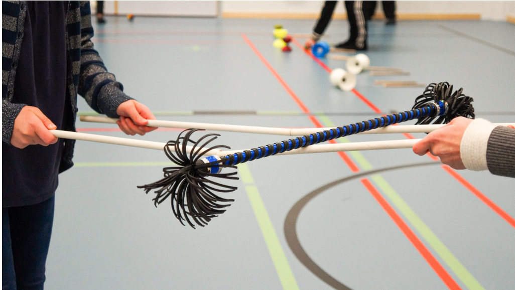
Kuva 4. Kukkakeppi eli flower stick. Kuvaaja: Onni Venäläinen 2017.

Sirkustoimintaa varten hankitut kukkakepit oli suunniteltu lasten käyttöön, ja ne olivat hieman keskimääräistä lyhyempiä ja kevyempiä. Kyselylomakkeissa kukkakepit nousivat esiin välineinä, jotka oli koettu hauskoiksi ja mielekkäiksi. Välineen visuaalinen näyttävyys ja liikkeen aiheuttamat muutokset välineen hapsuihin (eli kepin päässä oleviin ”kukkiin”) saivat yhden osallistuvan lapsen kommentoimaan, että hapsujen liike näyttää hänen mielestään autopesulalta. Otin ryhmän kanssa autopesula-mielikuvan käyttöön, ja kannustin osallistujia laittamaan harjakset pyörimään yhdessä. Kommentti korostaa mielestäni osuvasti sitä miten mielikuvitus voi täydentää ja tarinallistaa sirkusvälineistön toimintaa. Näissä tilanteissa ohjaajalla on mahdollisuus tarttua osallistujien tarjoamiin, yllättäviinkin mielikuviin, ja motivoida niiden avulla fyysistä toimintaa. Kukkakeppi oli myös väline, jonka kanssa toteutettava aikuisen ja lapsen yhteistyö lisääntyi havaintojen mukaan jokaisen kerran myötä, jolloin ne olivat mukana toiminnassa. Aikuiset ohjeistivat lapsia, millä havaittiin olevan vaikutuksia lapsen yhteistyöhön keskittymiseen. Joillain kerroilla lapset olivat myös valmiita vuorottelemaan aikuisen kanssa välineen käytössä.