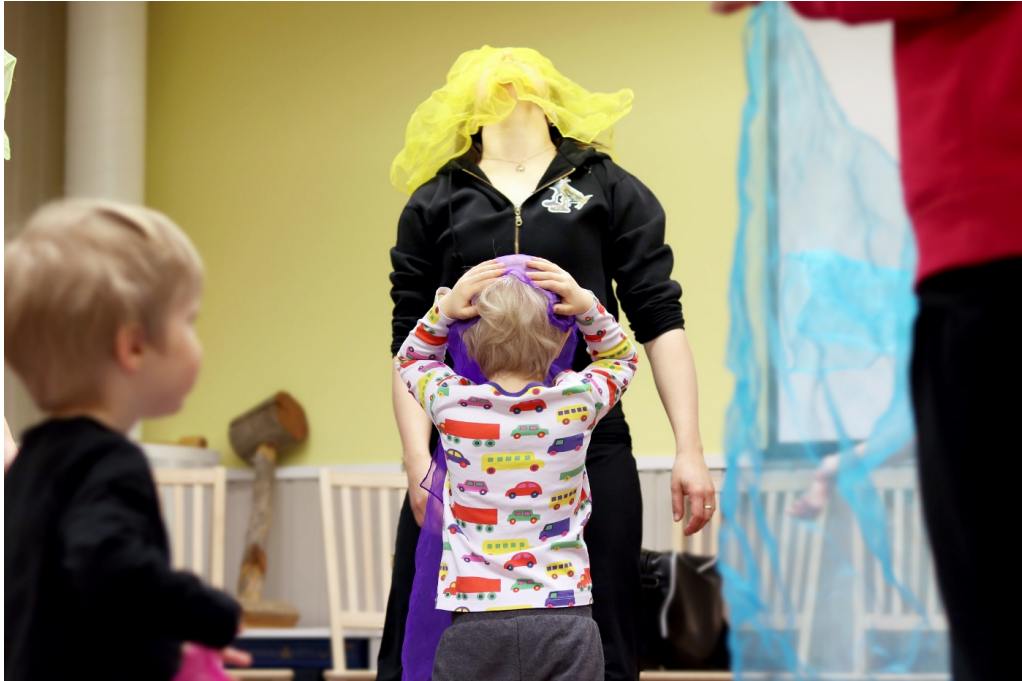
Kuva 5. Aikuisen rooli sirkustoinnassa.

Toinenkin osallistuja pohti niin ikään toimintaa ohjaavan aikuisen vaikutusta sirkustointaan: