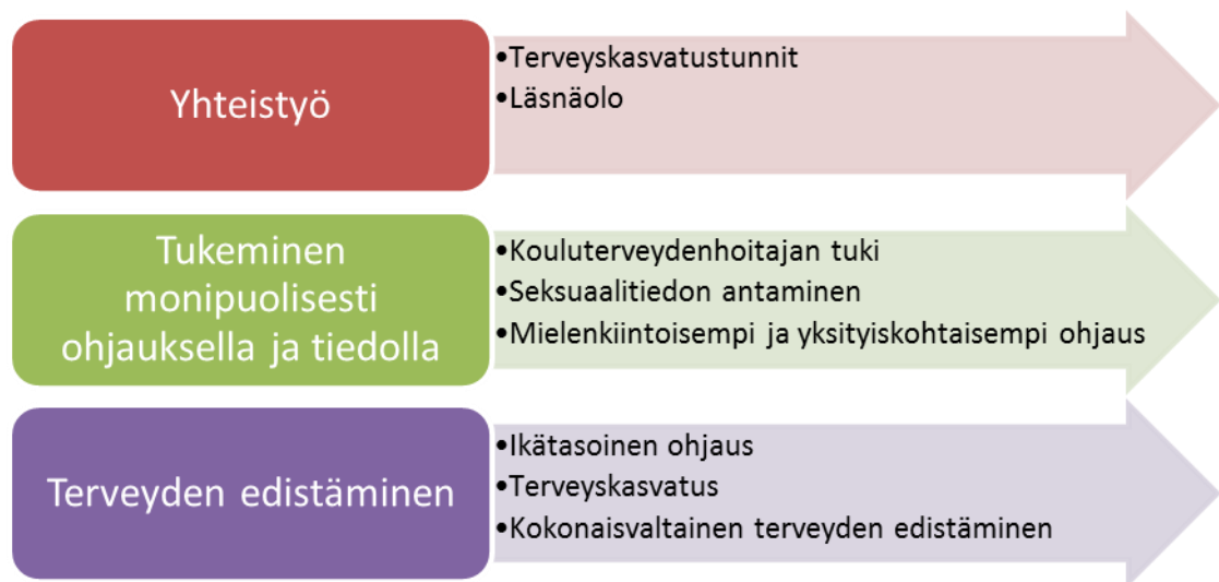
Kuvio 4. Kouluterveydenhoitaja edistää alakouluikäisen lapsen seksuaaliterveyttä pää- ja alaluokat.

Tutkiessa sitä miten kouluterveydenhoitaja on edistämässä alakouluikäisen lapsen seksuaaliterveyttä, saatiin kolme pääluokkaa. Ensimmäinen pääluokka on yhteistyö, joka pitää sisällään terveystuntit ja läsnäolon. Toisena pääluokkana on tukeminen monipuolisesti ohjauksella ja tiedolla, jossa kouluterveydenhoitaja tukee ja antaa tietoa seksuaalisuudesta sekä mielenkiintoisempaa ja yksityiskohtaisempaa ohjausta. Kolmantena pääluokkana on terveyden edistäminen, johon kuuluu ikätasoinen ohjaus, terveystuntit ja kokonaisvaltainen terveyden edistäminen. (Kuvio 4.)