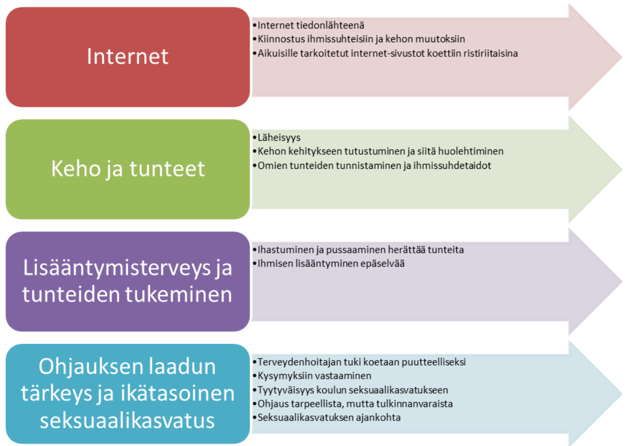
Kuvio 3. 1.—4.-luokkalaisten tiedon, tuen ja ohjauksen tarpeet seksuaaliterveydestä ja kehitysvaiheista pää- ja alaluokat.

luokka pitää sisällään ovat: terveydenhoitajan tuki koetaan puutteelliseksi, oppilaiden kysymyksiin vastaaminen, tyytyväisyys koulun seksuaalikasvatukseen, ohjaus tarpeellista, mutta tulkinnan varaista ja seksuaalikasvatuksen ajankohta. (Kuvio 3.)