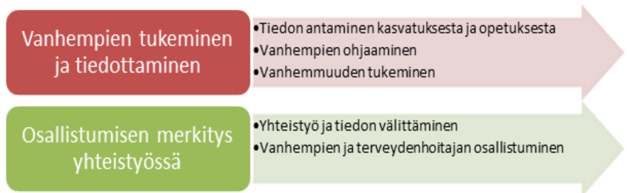
Kuvio 2. Kouluterveydenhoitaja auttamassa vanhempia lapsen seksuaalikasvatuksessa. pää- ja alaluokat.

Tutkittaessa aihetta miten kouluterveydenhoitaja auttaa vanhempia lapsen seksuaalikasvatuksessa muodostui kaksi pääluokkaa. Ensimmäinen on vanhempien tukeminen ja tiedottaminen, johon sisältyy tiedon antaminen kasvatuksesta ja opetuksesta, vanhempien ohjaaminen ja vanhemmuuden tukeminen. Toiseksi pääluokaksi tuli osallistumisen merkitys yhteistyössä, jonka alle kuuluu yhteistyö ja tiedon välittäminen sekä vanhempien ja terveydenhoitajan osallistuminen. (Kuvio 2.)