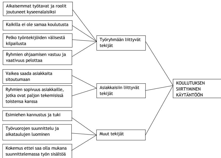
KUVIO 3. Koulutuksen siirtyminen käytäntöön.

Työpaikalla aikaisemmat roolit ja toimintatavat joutuivat kyseenalaisiksi. Ryhmien ohjaamiseen liittyen hankaluutena oli päättää kenen kanssa ryhmiä haluaa tai ei halua pitää. Myös ryhmien ohjaamiseen liittyvän vastuun ja vaatavuuden kuvattiin pelottavan. Edelleen hankaluutena koettiin, ettei kaikilla työpaikan työntekijöillä ole samaa koulutus pohjaa ja ymmärrystä ryhmien toiminnasta ja niiden ohjaamisesta. Koulutuksen jälkeen koulutuksen saaneet työntekijät halusivat toteuttaa saamaansa menetelmää käytännössä ja työntekijät, jotka eivät olleet osallistuneet koulutukseen, joutuivat uudenlaisen tilanteen eteen. Haastateltavat kuvasivat sen johtaneen uusien menetelmien kyseenalaistamiseen ja mitätöintiin. Kilpailua ja vertailua toisten työntekijöiden vetämien ryhmien välillä pelättiin: kenen ryhmät ovat suosittuja ja kenen eivät - ja mistä se johtuu, kuten eräs haastateltava kuvaa.