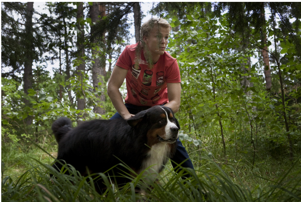
Kuva 3. Näyttelijät uppoutuneina rooleihinsa.

Kuvauksissa onkin tärkeää nopea reagoitokyky yllättäviin muutoksiin. Muutosten sattuessa kohdalle korostuu eläinnäyttelijöiden ennakkoharjoitusten tärkeys, sillä kun eläin on tottunut monipuolisiin harjoituksiin, se oppii helposti ja nopeasti uutta: