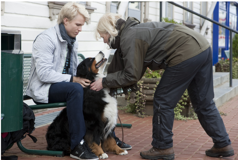
Kuva 2. Viimeiset neuvot eläintenkouluttajalta näyttelijöille ennen kuin kamerat käyvät.

Roskisprinssin kesäkuvauksissa suuria vaikeuksia ei enää tullut ja kaikki meni hyvin. Koirien kouluttajat olivat hoitaneet koulutusurakkansa huolella, joten koirat toimivat loistavasti. (Niemi, R. 2011.):