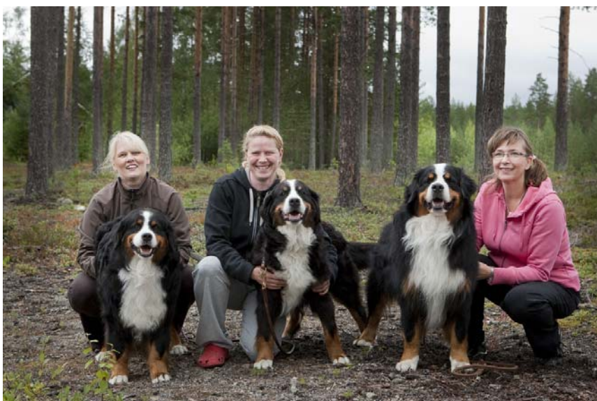
Kuva 1. Eläinnäyttelijät ja -kouluttajat valmiina Roskisprinssin kuvauksiin.