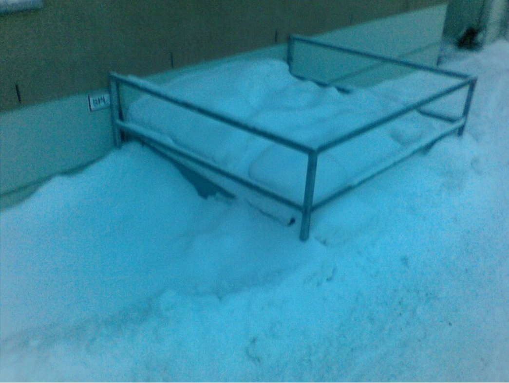
Kuva 2. Savunpoistoluukun lumirasituksesta.

Vesivuodot on vaikea paikallistaa autohallin päällä olevista pihakansista. Ensiksi vuodon ilmennyttyä on tarkistettu, mitä rakenteita vuotoalueen välittömässä läheisyydessä on. Yläpuolisia rakenteita tutkimalla saadaan rajattua vuotokohtaa pienemmäksi alueeksi. Korjaus on yleensä tapahtunut yläpuoliseen rakenteen paikallisena purkamisella ja vaurioituneen rakenteen korjaamisella. Esimerkiksi valaisinpylvään asentaja on rikkonut ruuveillaan vesieristeen. siten on korjattu korjaamalla vesieriste rajatulta alueelta, sekä eristämällä valaisin kondenssikosteutta vastaa. Näin tehdyt korjaukset ovat kestäneet. Savunpoistoluukku on vuotohistorioissa hyvin yleinen vuotoalue, jota on ollut hankala korjata. Paras keino estää vuotoja on talvella pitää savunpoistoluukkujen ympäristö lumettomana. Pihakanteen liittyvien ulko-ovien kynnykset olivat 90-luvulla tehdyissä rakennuksissa liian matalia. Kynnyksien kautta vuoti runsaasti vettä. Rakenne korjattiin lisäämällä vesieristettä. Rakennusmääräyksissä on yleisesti määrätty liian matalat kynnyskorkeudet. Pihakannen kaivot ovat monin tavoin hankala rakenne. Talvisin kaivoissa on oltava lämmitys, ettei hiekkapesä pääsisi jäätymään. Kaivon seinämissä olevat reiät voivat myös tukkeutua luoden kosteuspainetta kosteuseristeeseen. Kaivonympäristö useimmiten pysyy kunnossa, jos huolta säännöllisesti ja huoltoyhtiö on tunnollinen.