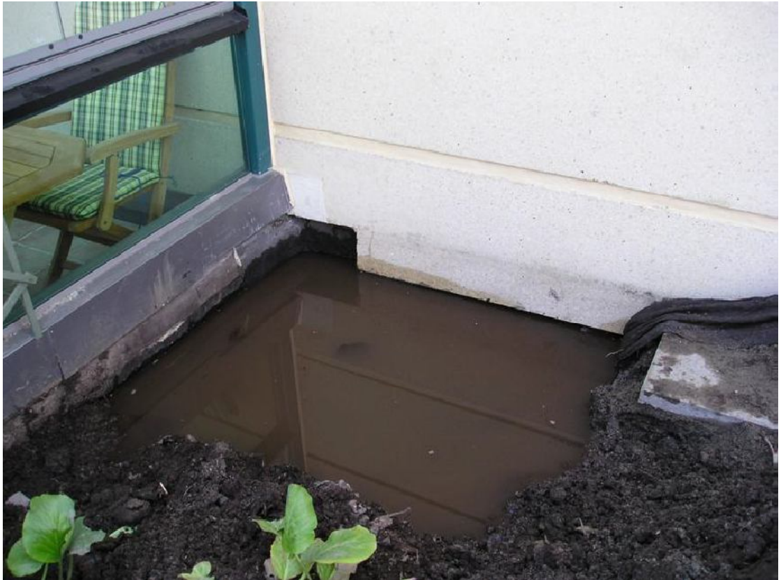
Kuva 1. Tukkiutunut kaivo.

Kaupunkien kaavoittamisessa ja myöntämisessä rakennusluvissa on vaatimuksia viherrakentamiselle, eli kun tontit on rakennettu täyteen, niin myös puut ja pensaat joudutaan rakentamaan pihakansille. Kansille rakennetaan istutuslaatikoita, joihin kasvit istutetaan. Istutuslaatikko on kokonaisuudessaan riskirakenne, koska sen huollossa tapahtuu aina suuria puutteita samoin kun aikoinaan omakotitalojen tasakatoissa, näissäkin rakenteissa vedenpoistoreiät pitää olla avattuna.