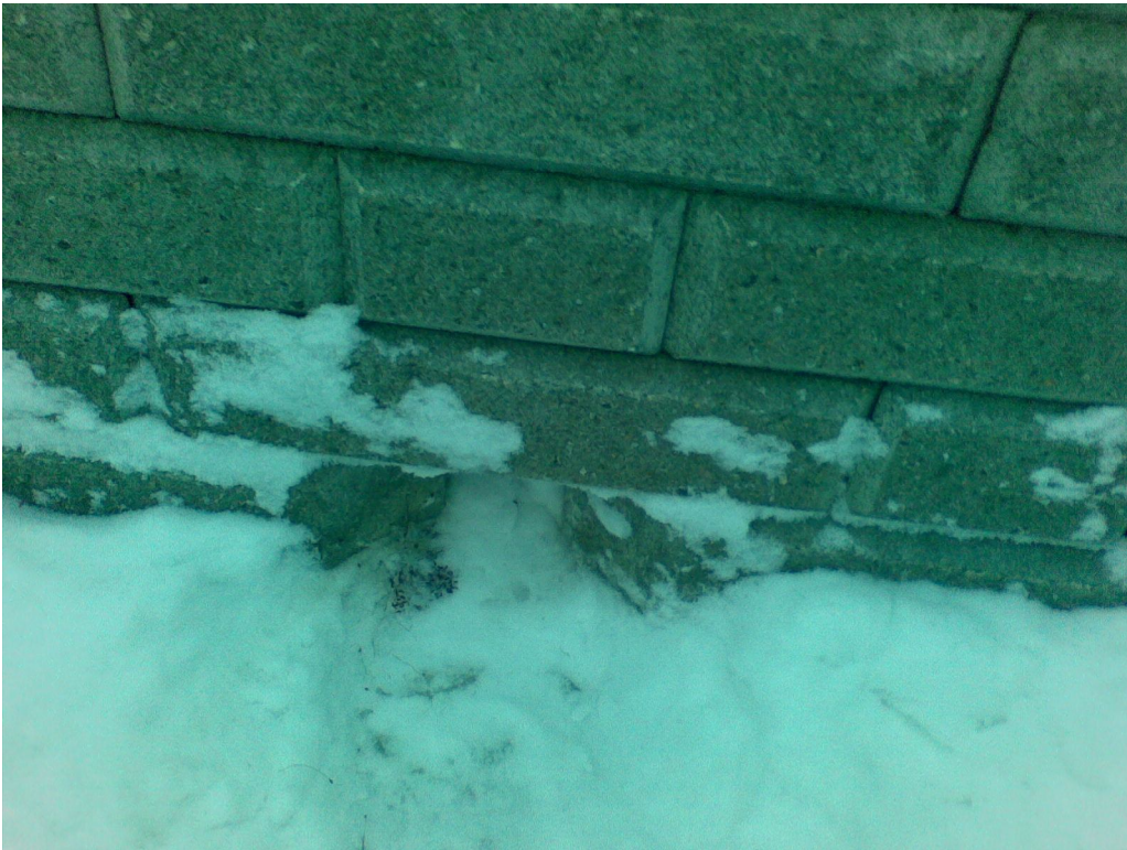
Kuva 4. Kukkalaatikon vedenpoistoaukko.

Testauksessa ja etsinnässä käytetään vaaratonta typpi-vetykaasua ja herkkä elektronista "haistelijaa". Tällä menetelmällä voidaan tutkia myös maan sisässä olevia vesijohdovuotoja. Anturia kuljetetaan rakenteen päällä, tunnistuen kaasupurkauksen ja vuotoaikan.