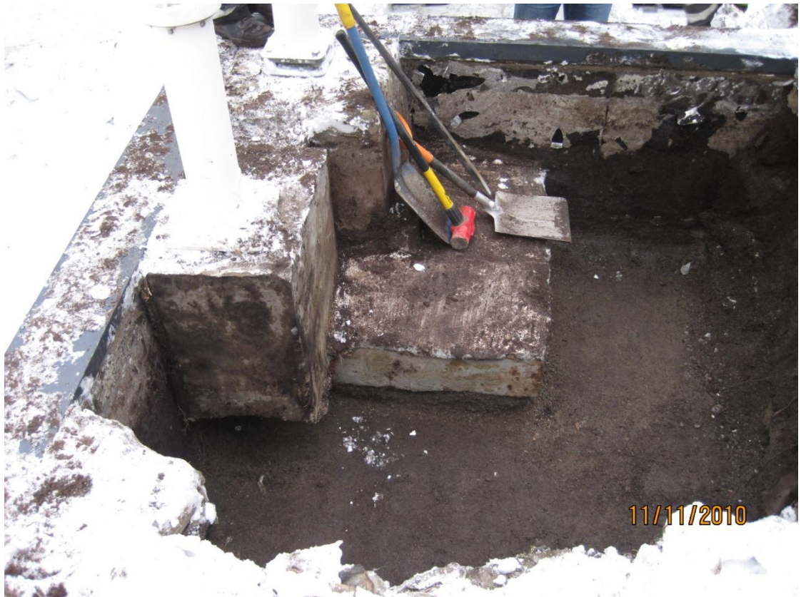
Kuva 4. Rikkoutuneen vesieristeen korjaus.

On selvää että kustannuksen muodostuminen riippuu korjauskohteista ja korjauksen laajuudesta. Toisinaan korjaus voi olla pieni kittausta tai suuri kokonaisen pihakannen aukaisu. Betoniyhdistyksen tekemän tutkimuksen mukaan pihakannen peruskorjaus maksaa 300–600 €/m 2 . Eli pienikin kannan aukaisu maksaa helposti 10 000€. On siis selvää että pitää etsiä keinoja korjauksien määrän minimoimiseksi. Rakentamisen laatuun pitää käyttää enemmän aikaa ja resursseja.