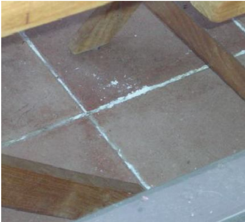
Kuva 6. Vesivuoto näkyy laatoituksen pinnassa.

Rakenne on muuten sama kuin xps-levyrakenne, mutta tämä levy on tehty liimaamalla yhteen 5-10 mm halkaisijaltaan olevia xps-palloja. näin saatu rakenne on erittäin hyvin vettä johtava salaoja. 10 cm paksun salaojalevyn hinta asennettuna on noin 25 €/m 2