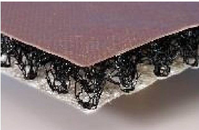
Kuva 5. Salaojamaton rakenne Enkadrain.

Tässä rakenteessa käytetään yleisesti salaojamattoa. Maton sisäosa on avoin kennonosto joka on vettä vapaasti johtava rakenne. Maton kokoonpuristuvuus on pientä joten vedenpaine on pieni. Pintarakenne on tiivis kuitukangas. suodatinmatto toimii myös erotuskerroksena. Maton asentaminen maksaa asennettuna noin 10–15 €/m 2 .