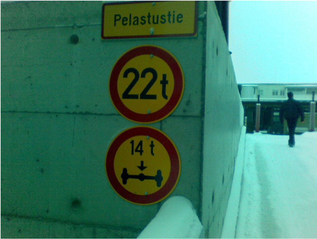
Kuva 7. Pihakannen kuormituksia.