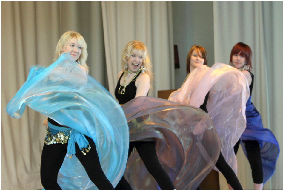
Kuva 2. Tanssiryhmä Etnica