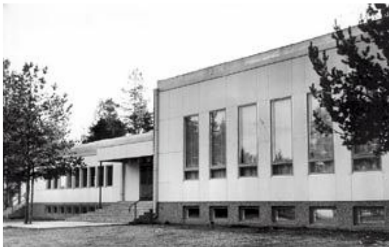
Kuva 1. Puistokulma

Tapahtumapaikaksi olin varannut jo ennen haastattelututkimuksen tekemistä Puistokulman. Puistokulman on talkoovoimin rakentanut Tikkurilan Järjestöjen Taloyhdistys ry, ja ensimmäiset tanssit siellä järjestettiin 25.4.1964 (Puistokulma ry 2010). Puistokulmalla on Vantaalla pitkä historia ja kohderyhmä tuntee sen hyvin. Puistokulma on kaksikerroksinen paikka. Alakerrassa sijaitsee pieni ja ylhäällä suuri sali.