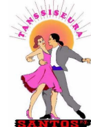
Kuva 3. Sunnuntaihuvit K-55 juliste