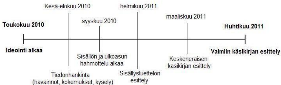
Kuvio 3. Käsikirjan tekoprosessin aikajana

nut käsikirjaani säännöllisin väliajoin niin kirjallisesti kuin suullisestikin. Käsikirjan tekoprosessin aikajanassa (Kuvio 3) on listattu käsikirjan eri vaiheet kronologisessa järjestyksessä.