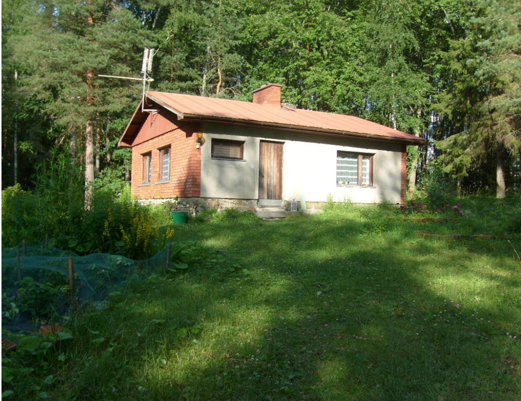
Kuva 1. Raakunsaarella sijaitseva Matti Riston kesämökki, jossa hän vietti suurimman osan ajastaan myöhemmällä iällä.