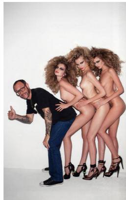
Terry Richardson, Purple Magazine 2009 (Issue 12)

Feromonien teoskokonaisuuden valokuviin esiintyy myös alastomia ihmisiä. Olen pohtinut, olisiko ollut mahdollista tuoda heidät fyysisesti paikalle näyttelyyn – eräänlaisina veistoksina. Tällaisiin teoksiin olen tutustunut esimerkiksi Marina Abramovicin performansseissa, kun hän pakottaa katsojan alastoman ihmisen läsnäoloon. Tämän idean totesin kuitenkin mahdottomaksi toteuttaa omassa näyttelyssäni. Asiassa olisi ollut liikaa epävarmoja elementtejä. Valokuvassa esiintyvän alastoman ihmisen tuominen fyysisesti osaksi teoskokonaisuuttani muuttaisi kokemuksen performanssiksi, mihin en pyri. Näin menettäisin hallittavuuden yksittäisten teoksieni välillä.