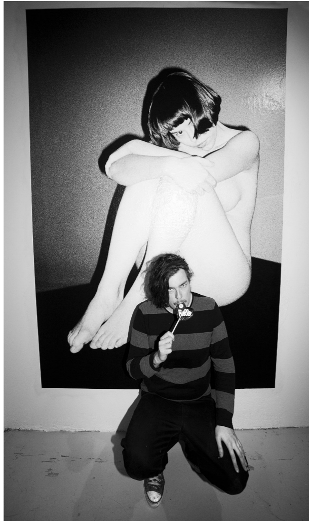
Minä teokseni äärellä Ars Autoisten Ovi Rivoon näyttelyssä 2011