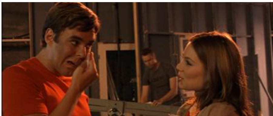
KUVA 3. Elokvassa Saippuaprinssi lavasteet ovat osa tarinaa.

Saippuaprinssi on esimerkkielokuvista kaikkein sarjakuvamaisin ja tarkoituksella liioiteltu. Liioittelu sopii elokuvan edustamaan farssin tyyliin. Saippuaprinssin lavastuksessa on käytetty voimakkaita värejä, jotka vaikuttavat kokonaisvärimaailmaan hyvin vahvasti. Lavastuksella on tärkeä tunnelmaa luova rooli tässä elokuvassa. Elokuva tapahtuu pääosin elokuvastudiolla, joten lavasteet ovat usein ihan konkreettisesti läsnä lavasteina kuvissa (ks. kuva 3). Saippuaprinssi kertoo saippuasarjan tekemisestä ja suurin osa tapahtumista on sijoitettu studiomaaiseen saippuasarjan tekemisen lomaan. Päähenkilö, tarinanärkevin henkilö, on studioilla ikään kuin sarjakuvasanakarittarena, joka joutuu jatkuvasti uusiin kamppailuihin ja tilanteisiin osoittamaan fiksuutensa ja viehättävyytensä.