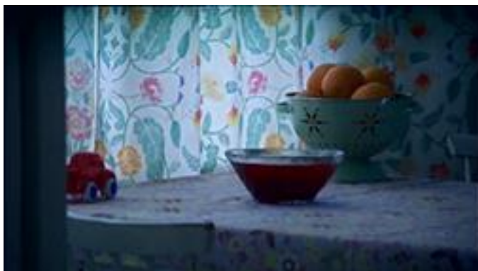
KUVA 9. Unettomien 1.kohtauksen 1. kuva

elokuvan loppupuolella. Ensimmäisen kohtauksen vakava tunnelma luo pohjan seuraavalle kohtaukselle ja päähenkilön esittelylle.