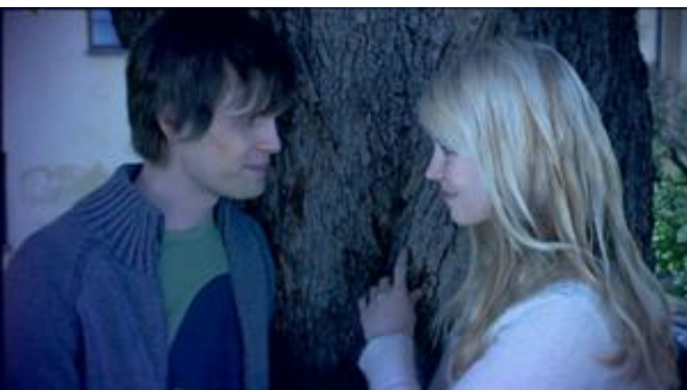
KUVA 8. PLK puolilähikuva Kuva elokuvasta Unettomat