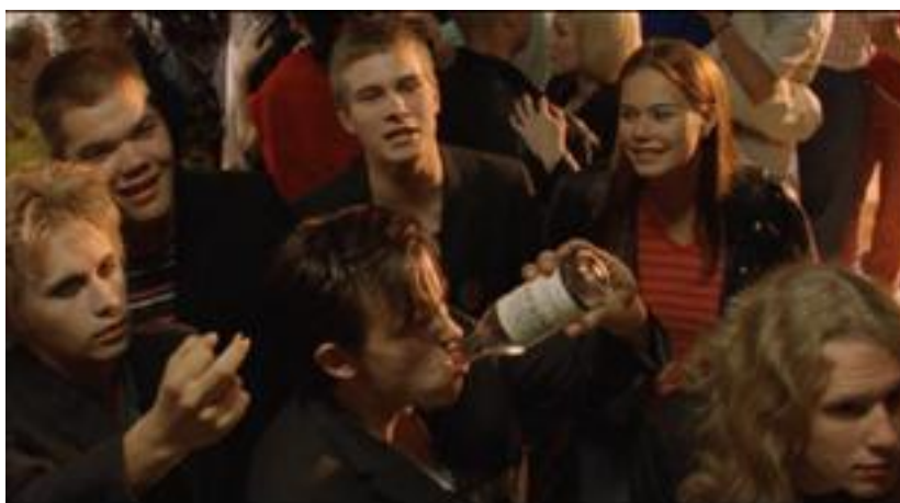
KUVA 1. Elokuvassa Pitkä kuuma kesä toistuvat lämpimät sävyt.

Värit vahvistavat tarinan tunnelmaa. Esimerkiksi epookkia tehdessä väreillä voi korostaa myös ajan patinaa tai kyseisen ajan muotivärejä. Esimerkiksi 1970-luvusta kertovassa elokuvassa voidaan korostaa vaikkapa oranssin ja ruskean sävyjä. Dome Karukosken ohjaama draamaelokuva Kielletty hedelmä -elokuva (Suomi 2009) oli täynnä kirkkaita ja kuulaita pastellivärejä; turkoosia, fuksian punaista, vaaleankeltaista. Värit toistuivat niin vaatteissa, lavasteissa kuin esim. baarikohtausten valoissa. Värit vahvistivat elokuvan tunnelmaa ja päähenkilöiden nuoruuden vimmaa.