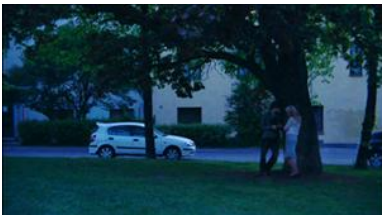
KUVA 5. YK yleiskuva Kuva elokuvasta Unettomat