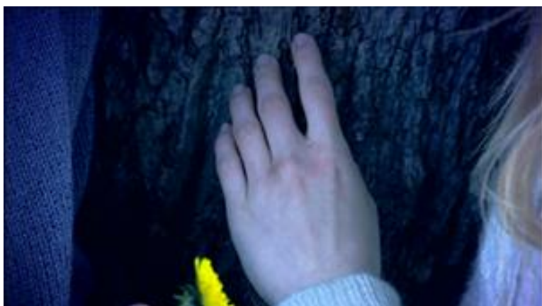
KUVA 6. ELK erikoislähikuva Kuva elokuvasta Unettomat