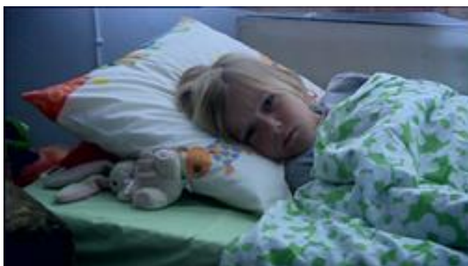
KUVA 12. Unettomien 1. kohtauksen 2. kuvan loppu