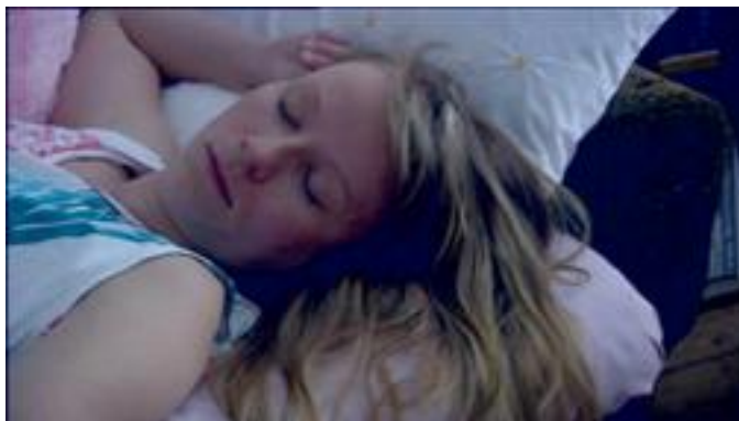
KUVA 11. Unettomien 1. kohtauksen 2. kuvan keskikohta