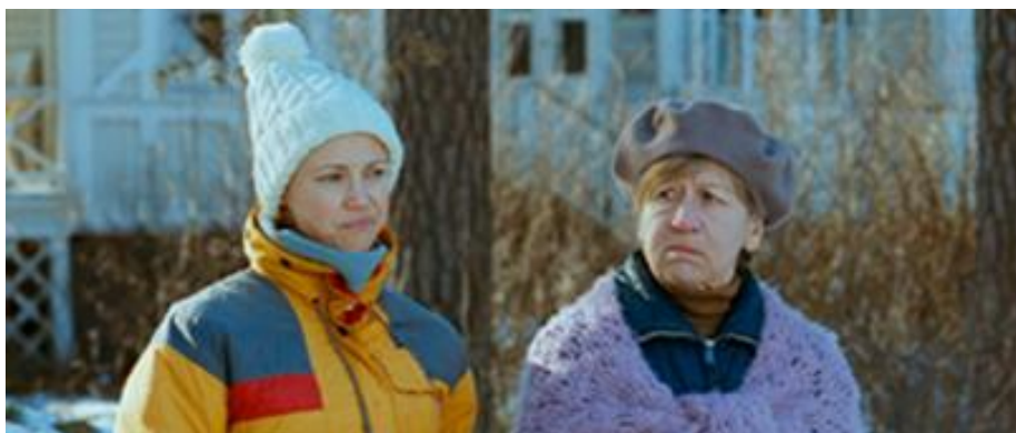
KUVA 2. Sooloilua -elokuvasa on paljon kuulaita talvisia ulkokuvia.

bändijäsenten ikävistä ja tylsistä kotioloista. Näissä kuvissa on harmaat seinät, sohvat ja sukulaiset. Elokvassa ei ole naispääosia, mutta yksi isompi naissivuosarooli ja liuta pienempiä sivurooleja. Elokvassa on pääosassa pojista koostuva bändi ja tytöt ovat elokvassa pääosin bändin ihailijoiden tai sivustaseuraajien rooleissa. Pitkä kuuma kesä on hyvin humoristinen elokuva ja tämä näkyy elokvan visuaalisuudessa erityisesti sivuhahmojen tyypittelyssä, karuissa punkkareissa ja 1950-luvun tyyliä ihailevissa elviskopioissa.