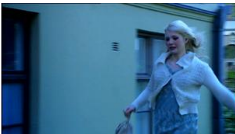
KUVA 4. Unettomat -elokuvan värimaailma on pastellisävvyinen.

Saippuaprinssi on esimerkkielokuvista kaikkein sarjakuvamaisin ja tarkoituksella liioiteltu. Liioittelu sopii elokuvan edustamaan farssin tyyliin. Saippuaprinssin lavastuksessa on käytetty voimakkaita värejä, jotka vaikuttavat kokonaisvärimaailmaan hyvin vahvasti. Lavastuksella on tärkeä tunnelmaa luova rooli tässä elokuvassa. Elokuva tapahtuu pääosin elokuvastudiolla, joten lavasteet ovat usein ihan konkreettisesti läsnä lavasteina kuvissa (ks. kuva 3). Saippuaprinssi kertoo saippuasarjan tekemisestä ja suurin osa tapahtumista on sijoitettu studiomaaiseen saippuasarjan tekemisen lomaan. Päähenkilö, tarinanärkevin henkilö, on studioilla ikään kuin sarjakuvasanakarittarena, joka joutuu jatkuvasti uusiin kamppailuihin ja tilanteisiin osoittamaan fiksuutensa ja viehättävyytensä.