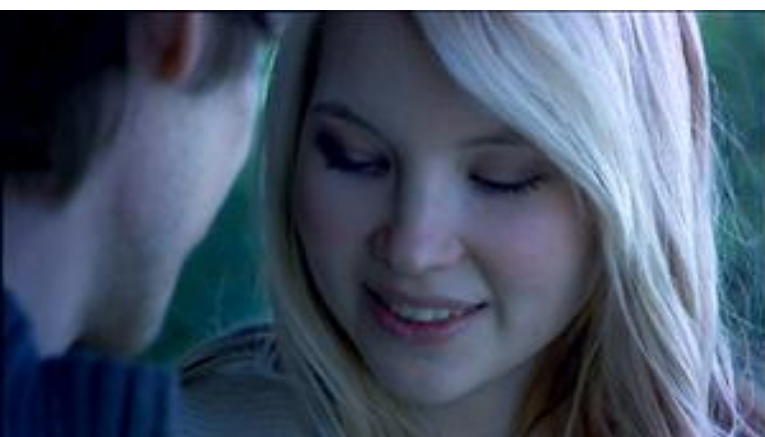
KUVA 7. ELK erikoislähikuva Kuva elokuvasta Unettomat