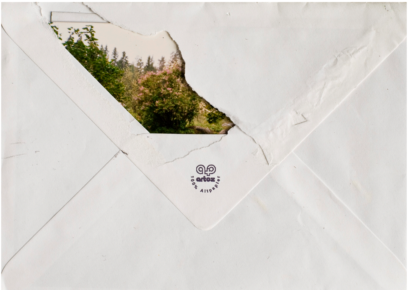
Kirje VI, 2011 Lambda alumiinille 17cm x 12cm / Letter VI, 2011 Lambda on aluminium 17cm x 12cm