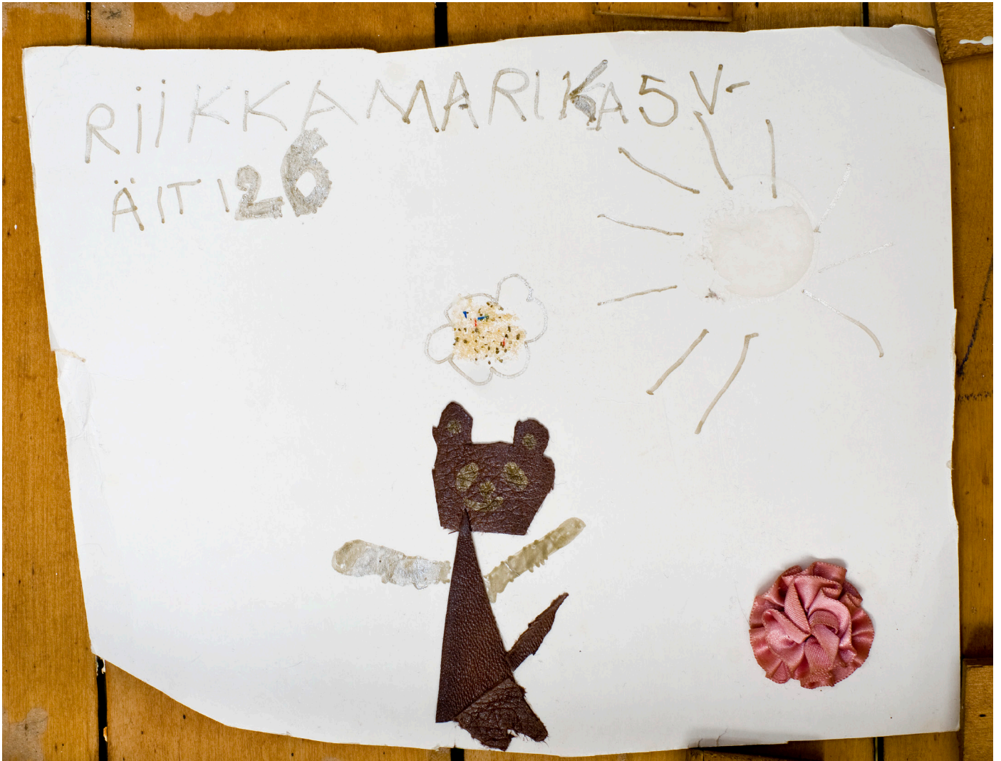
Present, 2011 Lambda alumiinille 26cm x 20cm / Present, 2011 Lambda on aluminium 26cm x 20cm