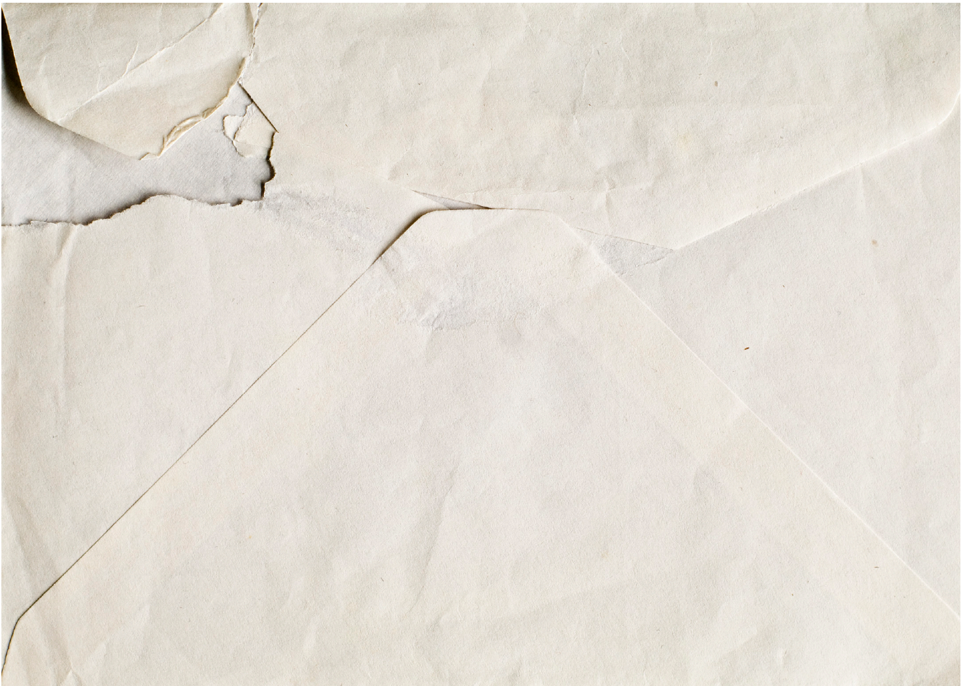
Kirje VII, 2011 Lambda alumiinille 17cm x 12cm / Letter VII, 2011 Lambda on aluminium 17cm x 12cm