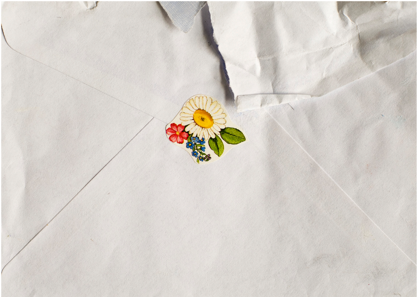
Kirje V, 2011 Lambda alumiinille 17cm x 12cm / Letter V, 2011 Lambda on aluminium 17cm x 12cm