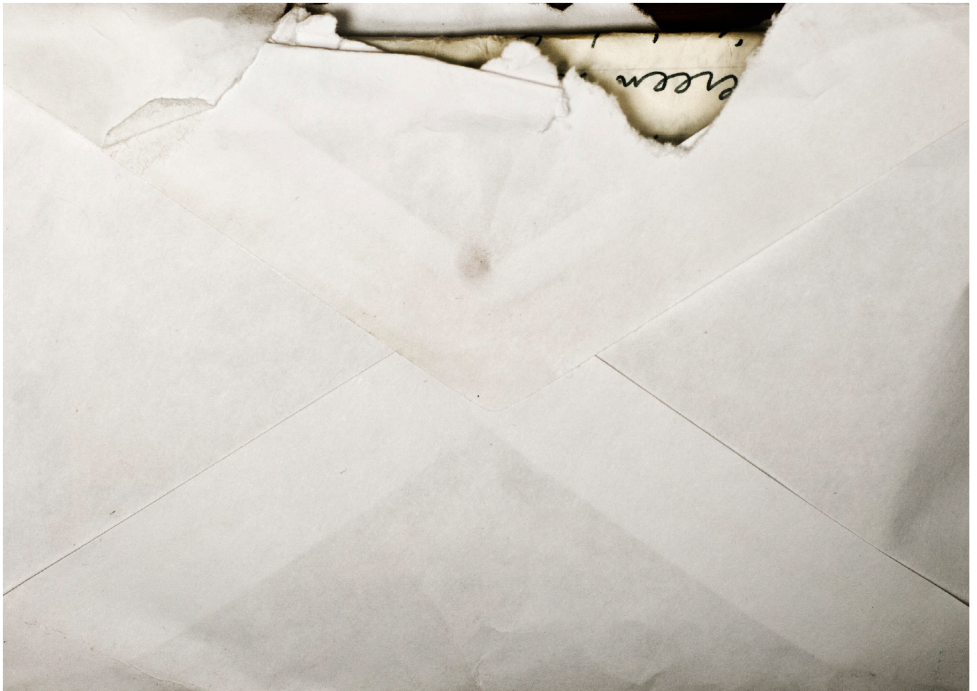
Kirje II, 2011 Lambda alumiinille 17cm x 12cm / Letter II, 2011 Lambda on aluminium 17cm x 12cm