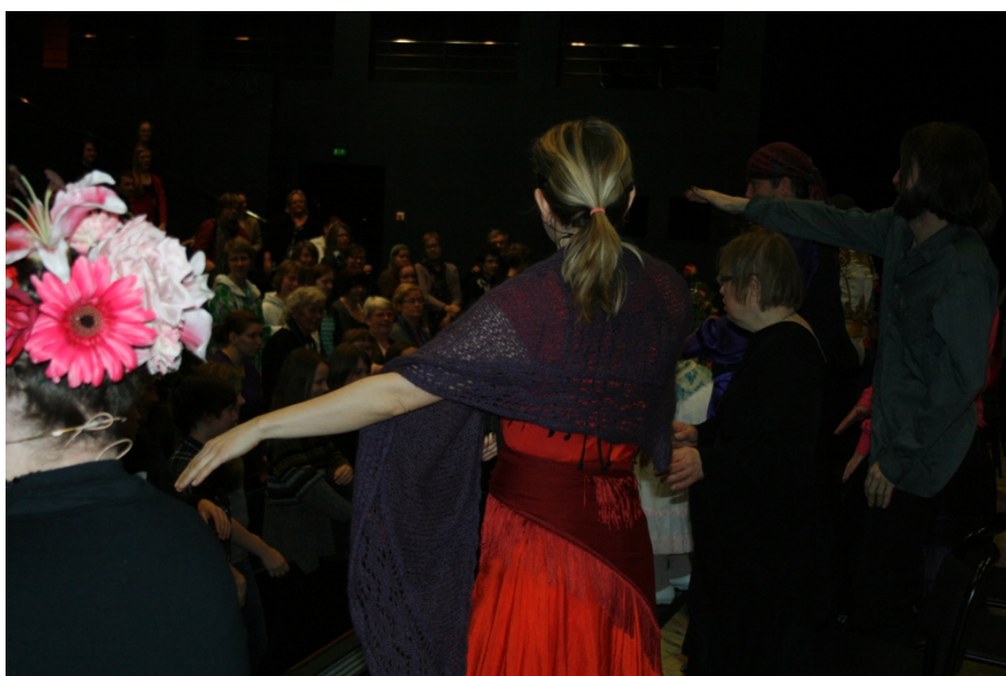
Bild 7&8: Möte med publiken. Nationaloperan 2011.