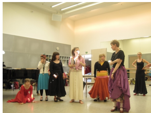
Bild 3&4: Repetitioner av En rovfågel flyger in på Operan hösten 2011.