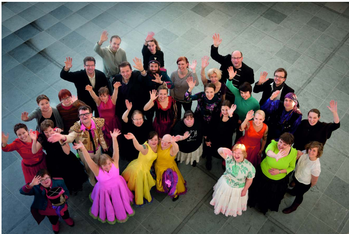
Bild 12: Hela arbetsgruppen. En rovfågel flyger in en variation på Carmen 2011.