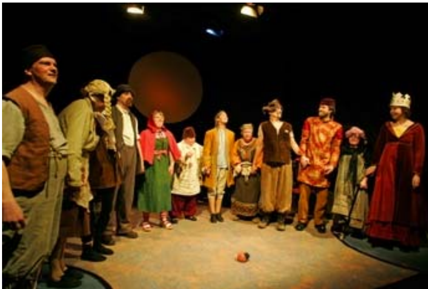
Bild 2: DuvTeatern 2007, Sagan om Hans och Greta och mycket annat.

I detta kapitel presenterar jag DuvTeatern. Beskrivningarna av DuvTeatern baserar sig på diskussioner som har förts med DuvTeaterns konstnärliga ledare Mikaela Hasán samt information om gruppen från olika dokument som t.ex. ansökningar och hemsidan, om inte annat nämns.