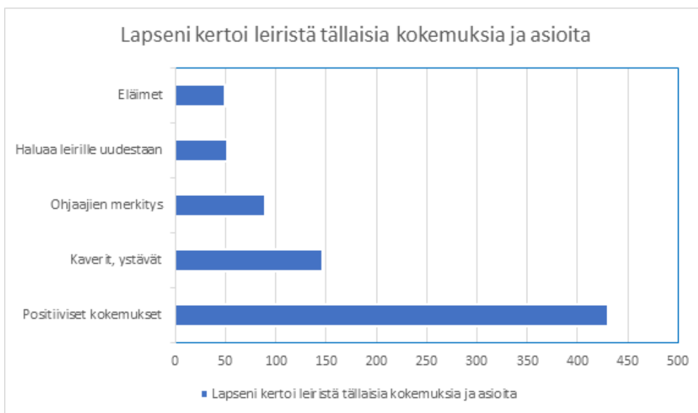
Taulukko 2: Lapseni kertoi leiristä tällaisia kokemuksia ja asioita.