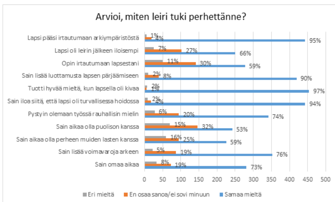
Taulukko 1: Arvioi, miten leiri tuki perhettänne?

Yhteistyöjärjestöjen leireillä kesän 2019 aikana olleiden lasten vanhempia pyydettiin leirien loputtua heille toimitetulla palautelomakkeella arvioimaan millä tavoin leiri tuki perhettä. Alla olevassa taulukossa (Taulukko 1) näkyvien väittämien lisäksi kysyttiin myös yksi avoin kysymys, jossa vanhemmat saivat kertoa omin sanoin millä tavoin leiri tuki perhettä. Vastauksia analysoitiin sekä taulukon että avoimien vastausten avulla. Taulukossa huomioituina ovat vain suljetut vastausvaihtoehdot. Vastausten tulkinnassa on hyvä ottaa huomioon, että kaikki huoltajat eivät välttämättä ole vastanneet kaikkiin kysymyksiin, joten väittämien tuloksia ei voi täysin luotettavasti verrata keskenään.