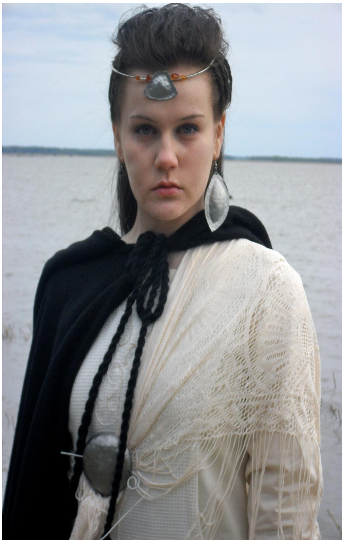
LIITE 7. Esittelykuva.