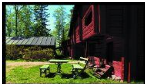
Kuva 9. Bragen ulkomuseoalue, Vaasa.