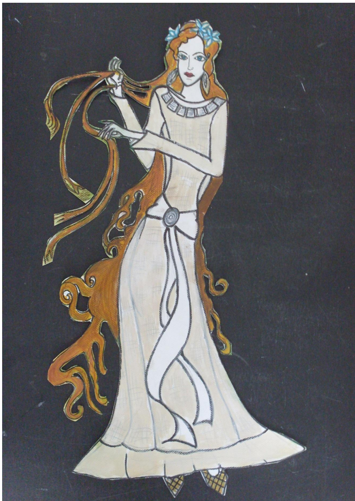
LIITE 3 a. Luonnostelukuva.