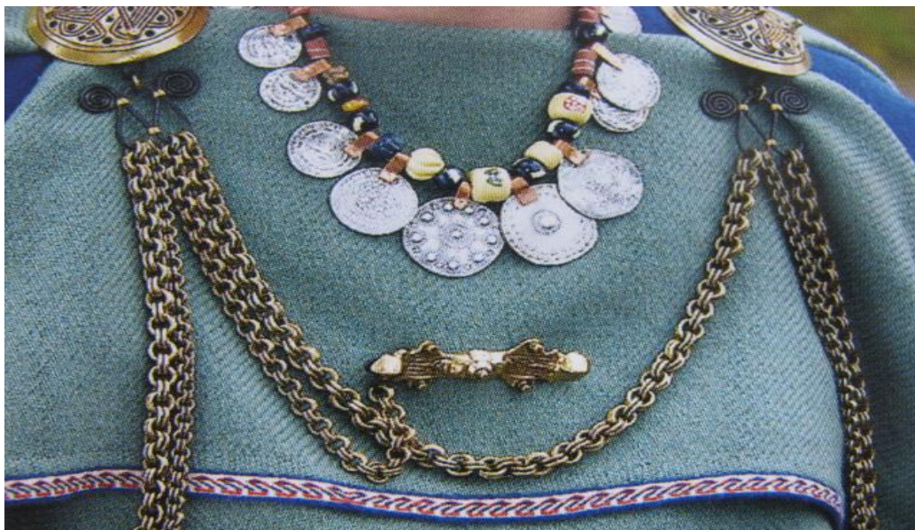
Kuva 5. Muinaispuvun koruja, Kalmistopiiri, 2011.

Suunnittelemassani kaulakorussa on myös yksi hela ja sitä koristamassa meripihkahelmet, joita käytettiin Suomessa myös valuuttana. Kaulakoru on taivutettu paksusta rautalangasta ja sen päät on käännetty kärkipihdeillä spiraalin muotoon. Helmet on kiinnitetty ohuella ja taipuisammalla rautalangalla. Rautalanka on kiiltävämpää, joten se antaa viehättävän ja siron lisäyksen kiinnitystarkoituksensa ohella. Kaulakorun helan innoittaja oli Kuusamon Lämsän hopeinen kirvesriipus.