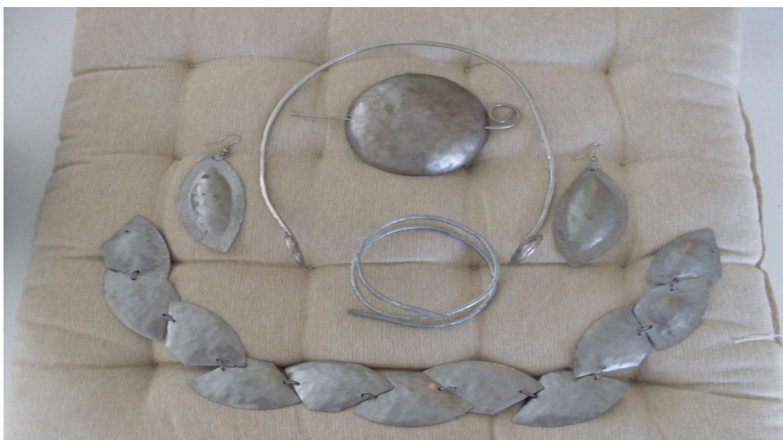
Kuva 6. Oma korusarja

Suunnittelemassani kaulakorussa on myös yksi hela ja sitä koristamassa meripihkahelmet, joita käytettiin Suomessa myös valuuttana. Kaulakoru on taivutettu paksusta rautalangasta ja sen päät on käännetty kärkipihdeillä spiraalin muotoon. Helmet on kiinnitetty ohuella ja taipuisammalla rautalangalla. Rautalanka on kiiltävämpää, joten se antaa viehättävän ja siron lisäyksen kiinnitystarkoituksensa ohella. Kaulakorun helan innoittaja oli Kuusamon Lämsän hopeinen kirvesriipus.