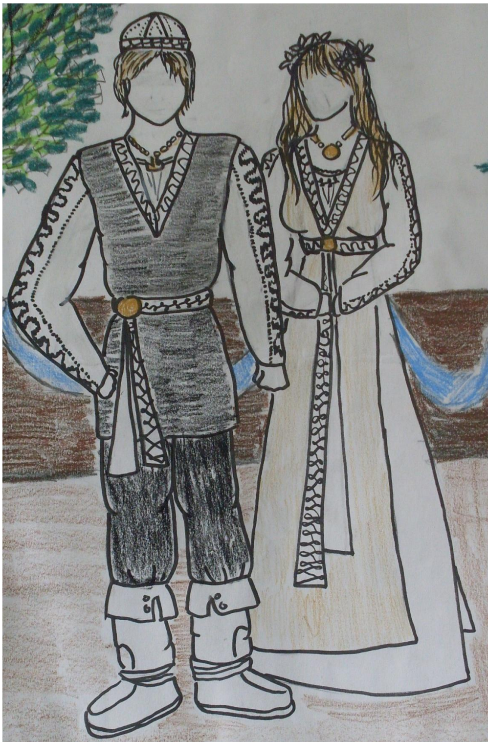
LIITE 3 b. Luonnostelukuva.