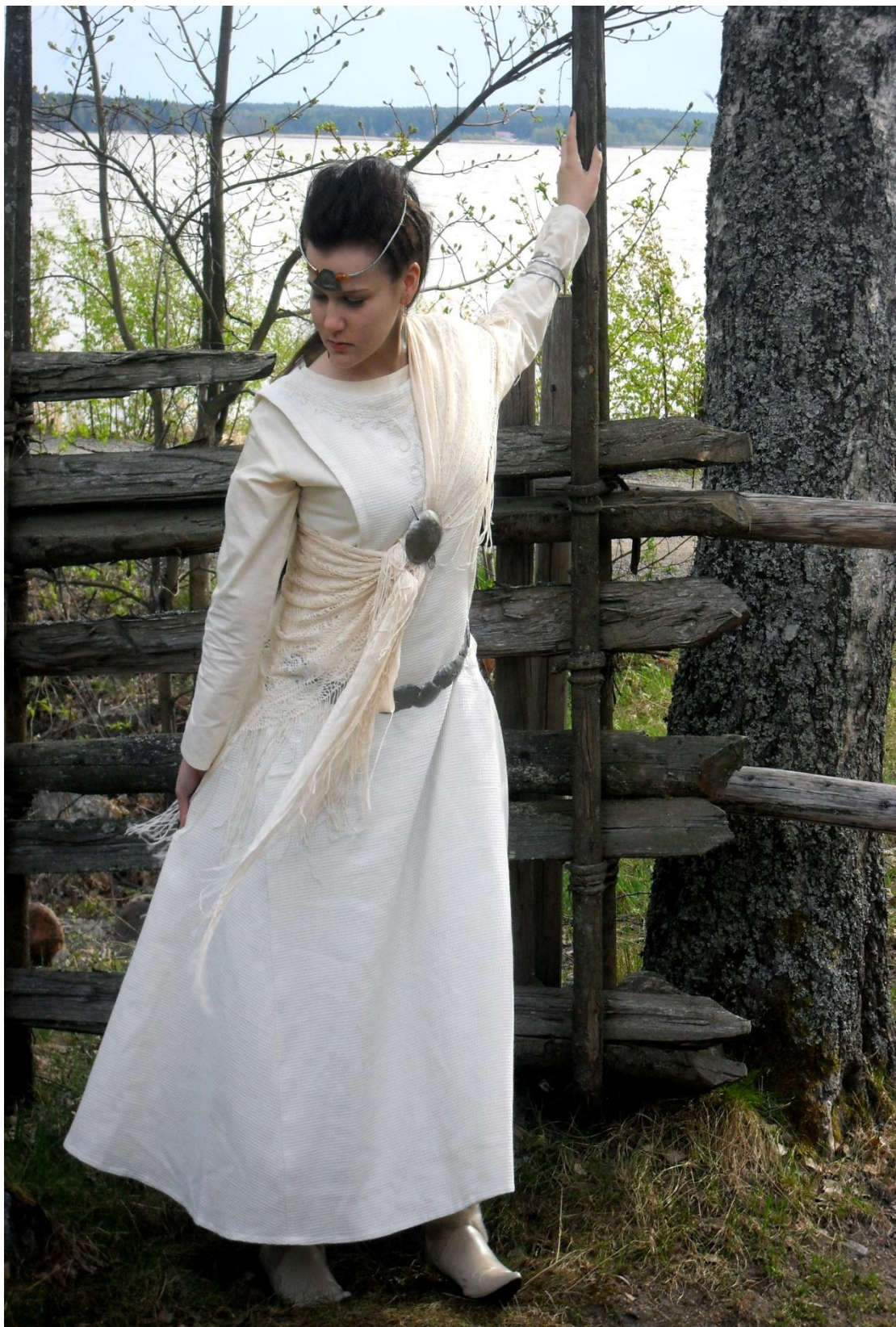
LIITE 5. Esittelykuva.