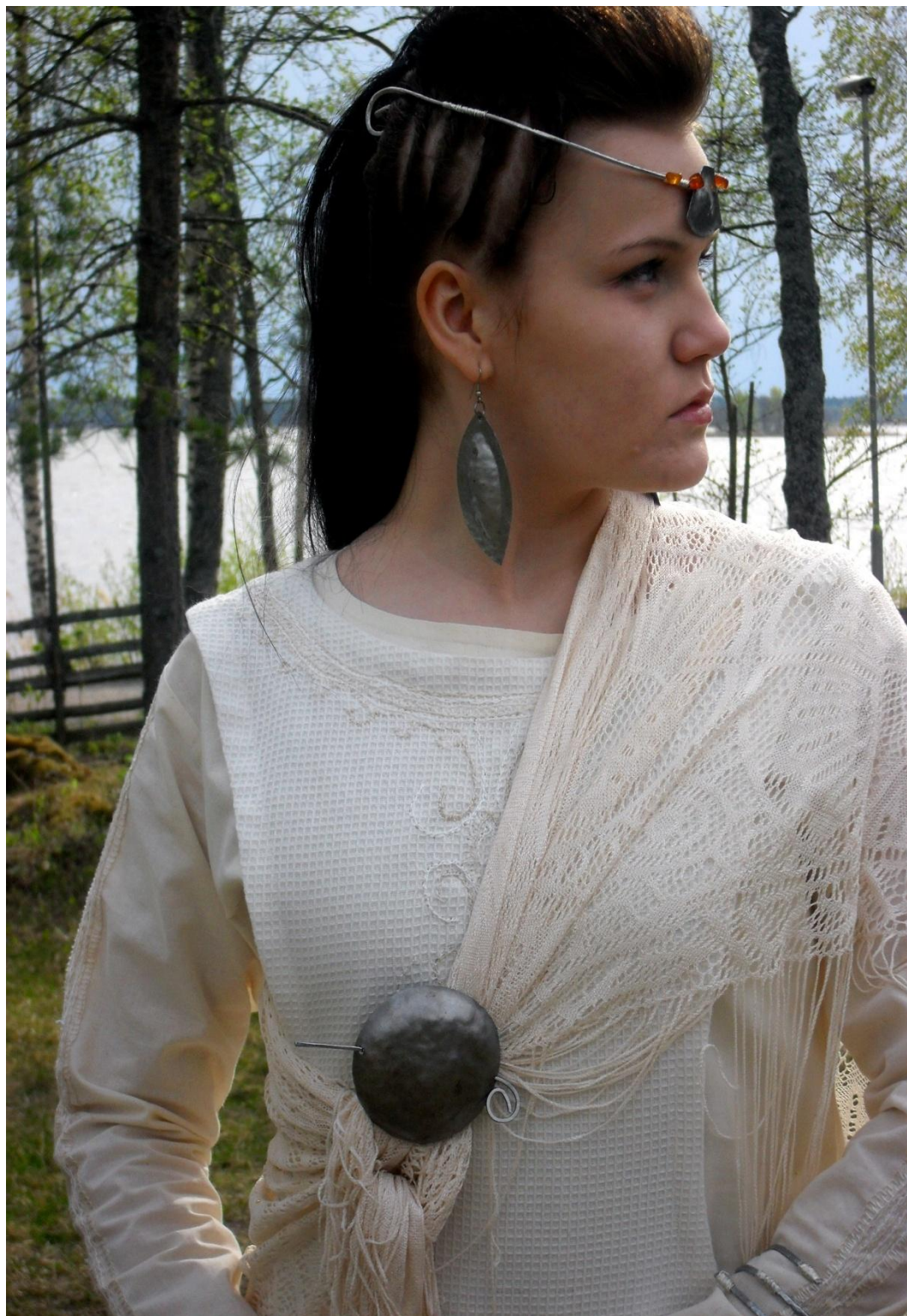
LIITE 4. Esittelykuva.