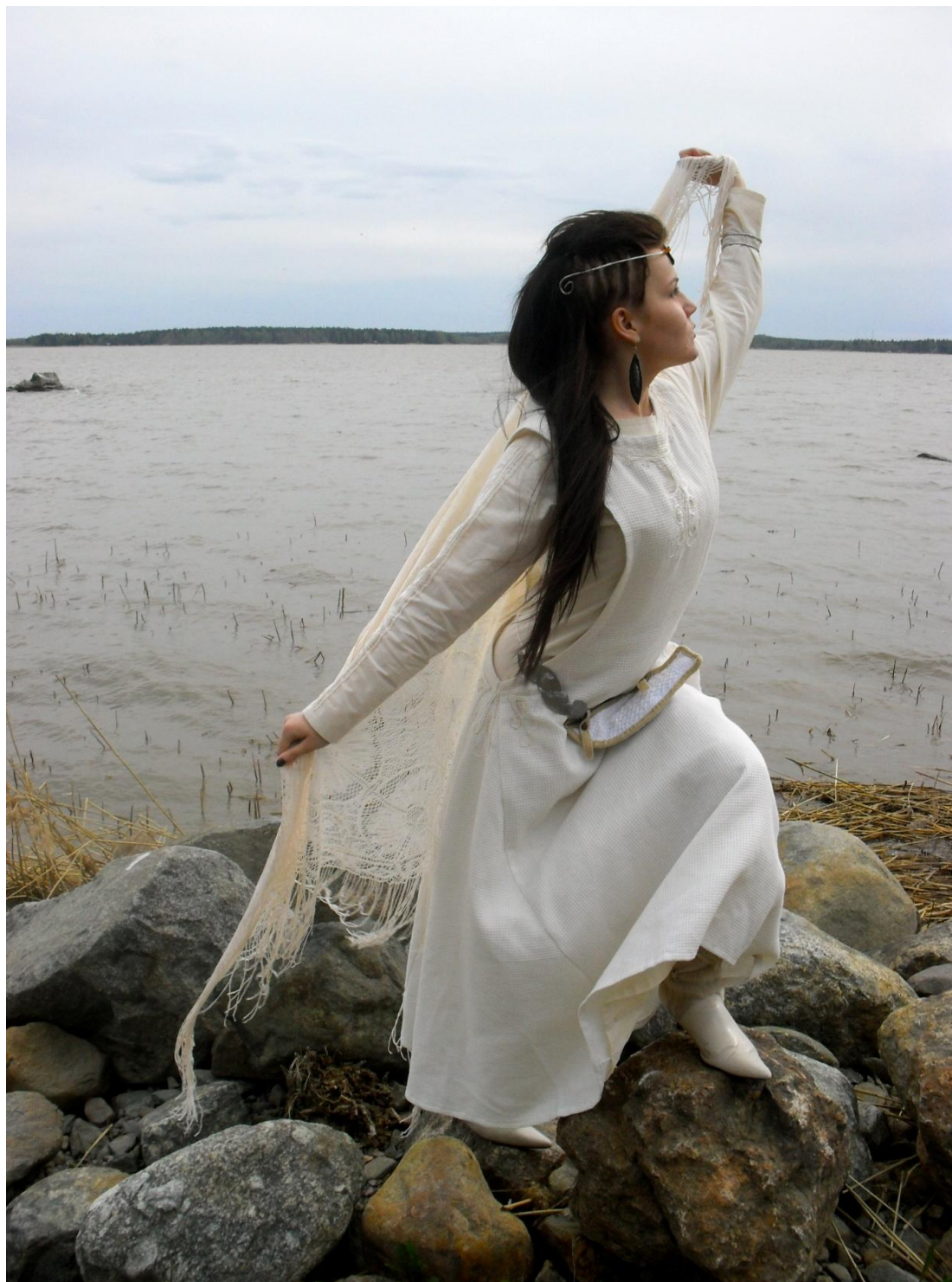
Kuva 10. Esittelykuva (Liite 8).