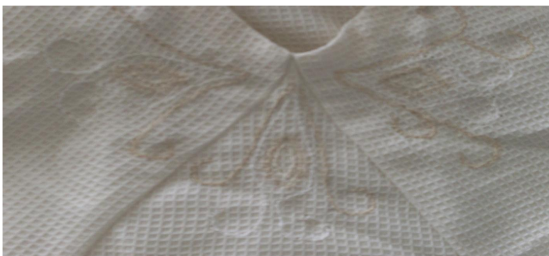
Kuva 3. Spiraalikirjontaa.

Tutkin aikakauden kirjallisuutta ja totesin, että tyypillisiä kirjontamalleja ovat olleet esiliinoissa ja helmoissa spiraali- ja rastikoristeet. Päätin käyttää asussani vaaleilla ja hieman kiiltävöpintaisilla puuvillalangoilla tehtyjä kirjailuja. Tätä varten opettelin uuden taidon harjoittamalla peruskirjontapistoja. Kirjailuja tein liivimekon etukappaleen miehustaan pääntien ympärille ja alusmekon hihoihin olalta hihansuun käänteeseen saakka.