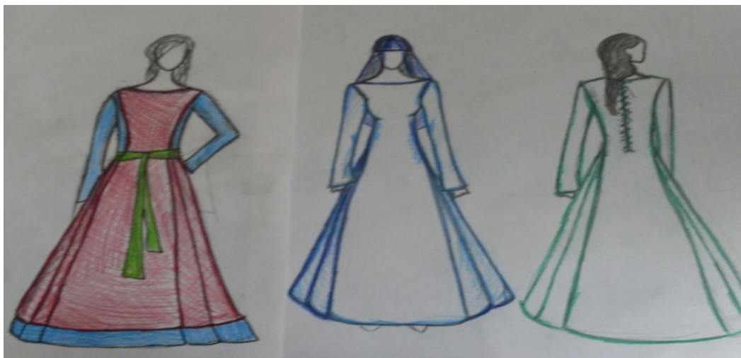
Kuva 4. Luonnostelukuvia puvun mallista ja leikkauksista.