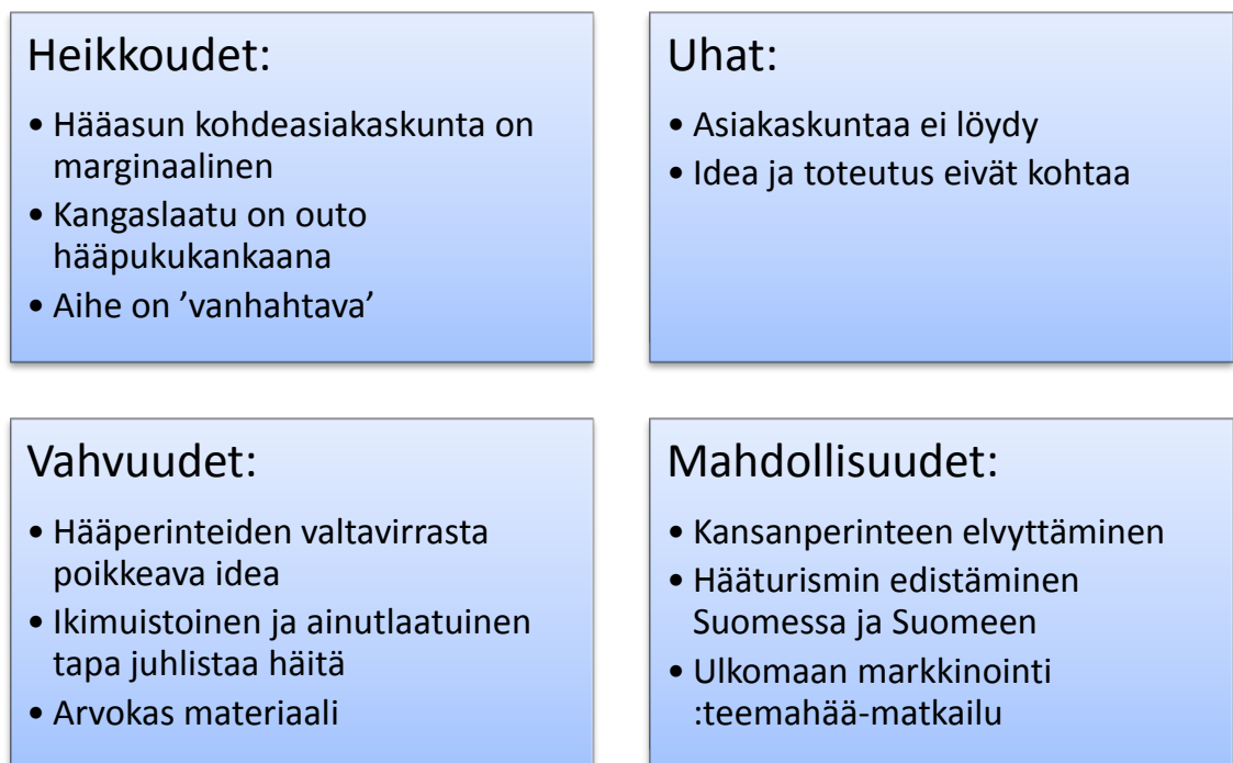
Kuva 1. S.W.O.T.

Hääasun vahvuudet löytyvät hääperinteen valtavirrasta poikkeavasta ideasta ja ainutlaatuisesta materiaalista. Ikimuistoisten ja ainutlaatuisten häiden keskeisellä paikalla ollessaan hääasu olisi mieleenpainuva kokonaisuus.