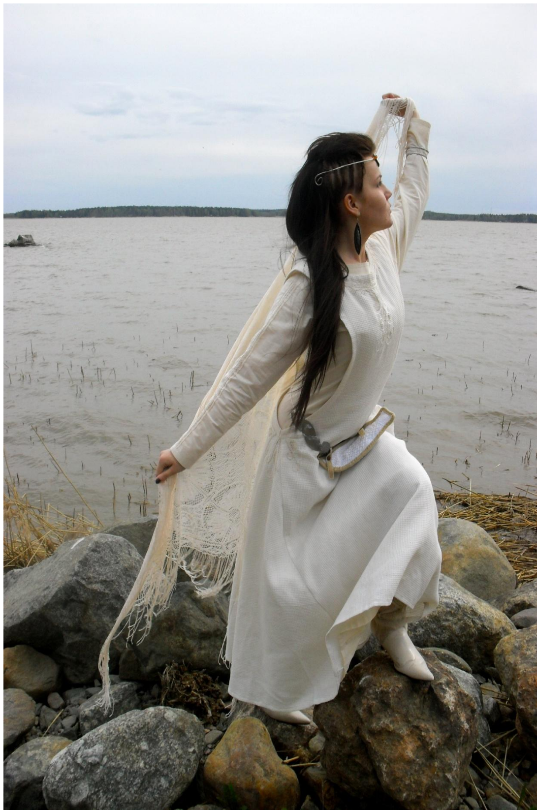
LIITE 8. Esittelykuva.