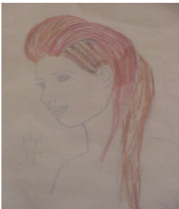
Kuva 8. Pohjolan tytär -kampaus.

Sain hääsun kuvausvaiheeseen toukokuun alkupuolella. Malliksi sain tutun nuoren naisen, jonka kanssa lähdin neuvottelemaan kuvauksista ja aikataulusta. Saimme ajan sovituksi ja aloimme miettiä kampausta ja meikkiä. Päätimme, että kummatkin tehdään itse. Kampaasmalleja haimme lehdistä samoin kuin historiallisista elokuvista ja tv-sarjoista. Kokeilimme useampaa eri tyyliä ja päädyimme hyödyntämään mallin omia pitkiä hiuksia. Kampaussessioita varten tarvitsimme muutamia eri tapaamiskertoja. Lopulta löysin mieleiseni tyylin mallini hiuksiin.