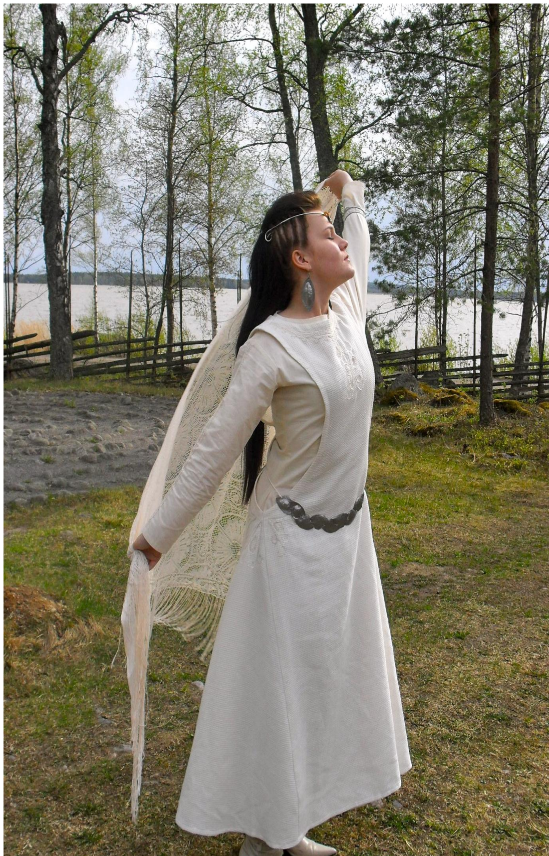
LIITE 6. Esittelykuva.