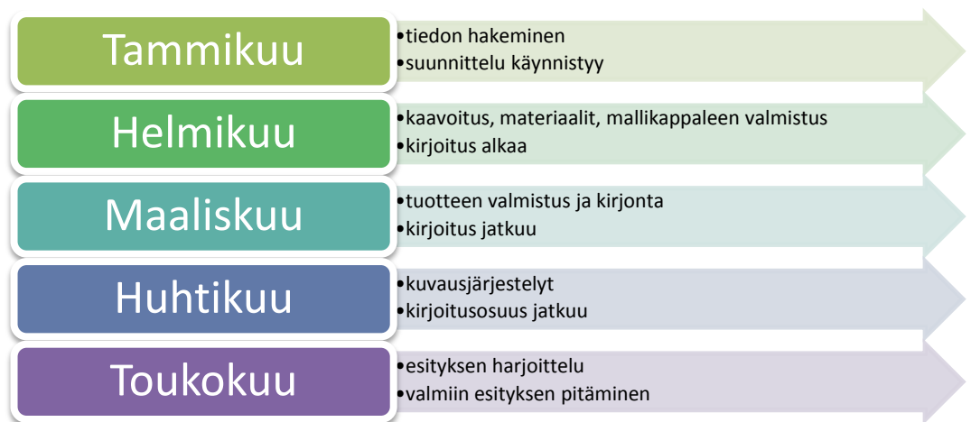
Kuva 2. Aikataulukkaavio.

Aikataulu muotoutui käytännön syistä kevään kattavaksi projektiksi. Suoritin samaan aikaan työharjoitteluani ja pitkät työpäivät rajoittivat nopeampaa etenemistä. Kirjastoihin pääsin työpäivän päätteeksi. Tammikuu 2011 oli varsinainen taustatietojen etsintävaihe ja varsinainen suunnittelutyö alkoi samaan aikaan. Helmi-maaliskuulla suoritin hääasun kaavoituksen, ostin materiaalit ja valmistin mallikappaleen asusta. Samaan aikaan aloitin kirjoitusvaiheen. Loppukevät kului kirjoituksen ja harjoittelun parissa.